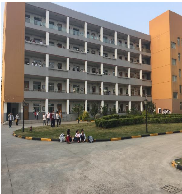
圖 7. 上海臺商子女學校校園