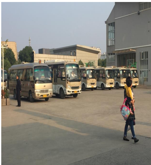
圖 9. 上海臺商子女學校校園