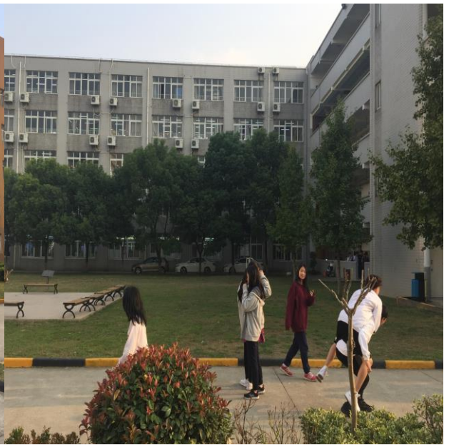
圖 8. 上海臺商子女學校校園