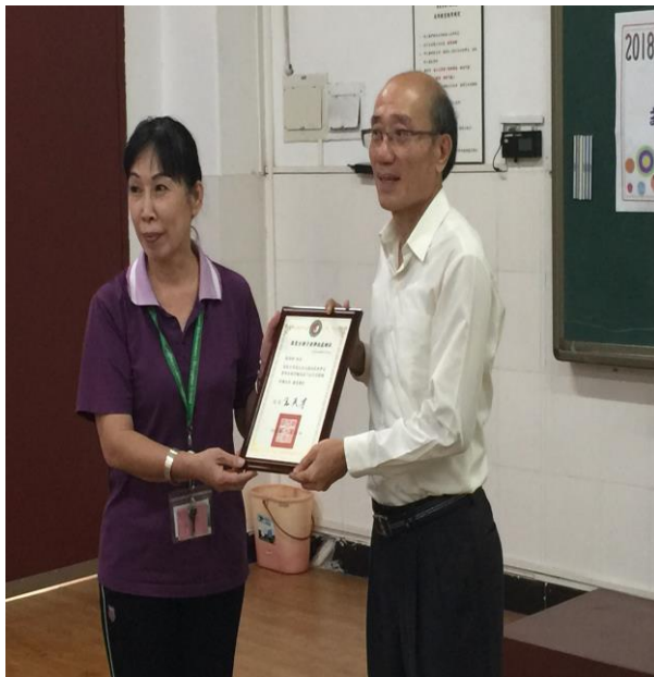
圖 13. 東莞臺商子弟學校頒贈感謝狀