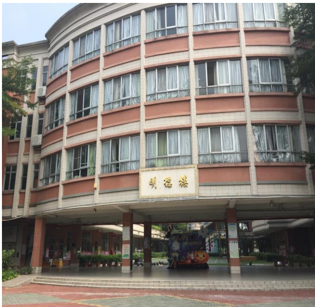
圖 17. 東莞臺商子弟學校校園