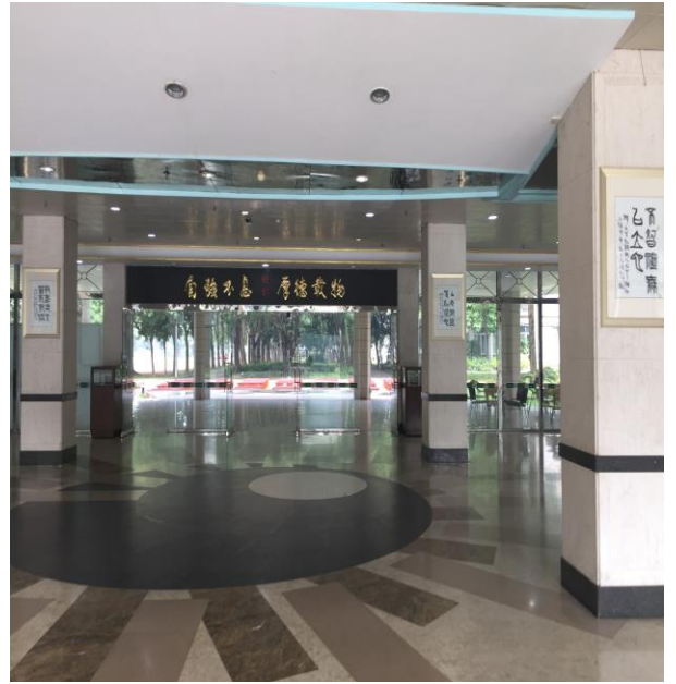
圖 16. 東莞臺商子弟學校校園