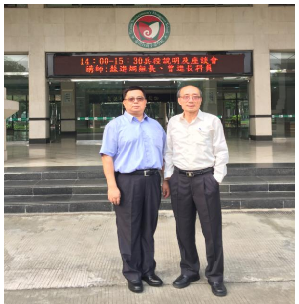
圖 14. 東莞臺商子弟學校校園