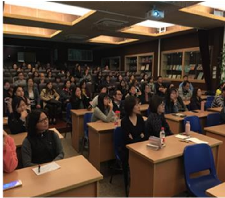
圖 4. 華東臺商子女學校家長學生座談會