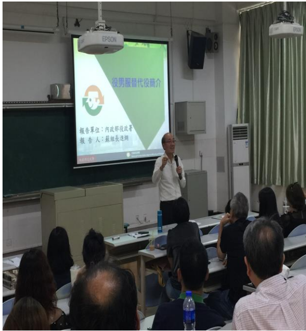
圖 11. 東莞臺商子弟學校座談會情形