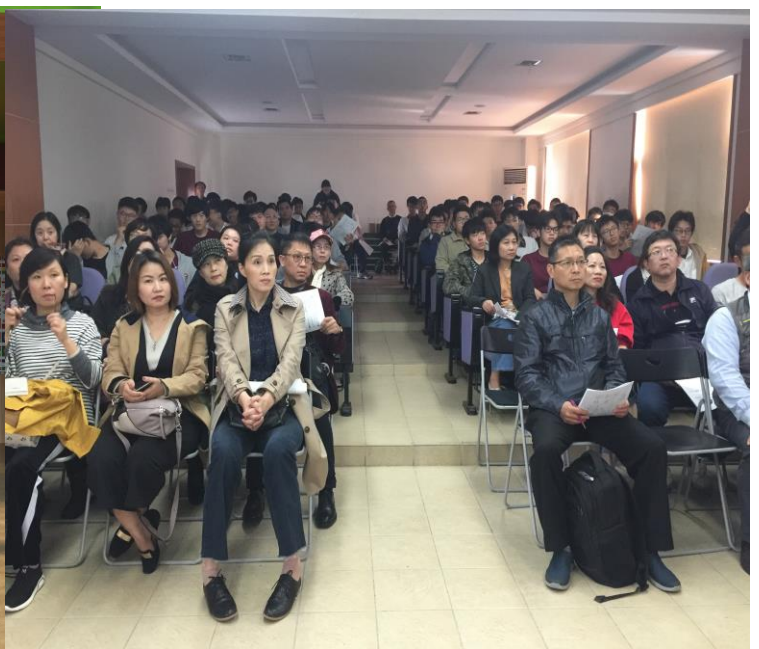
圖 6. 上海臺商子女學校家長學生座談會