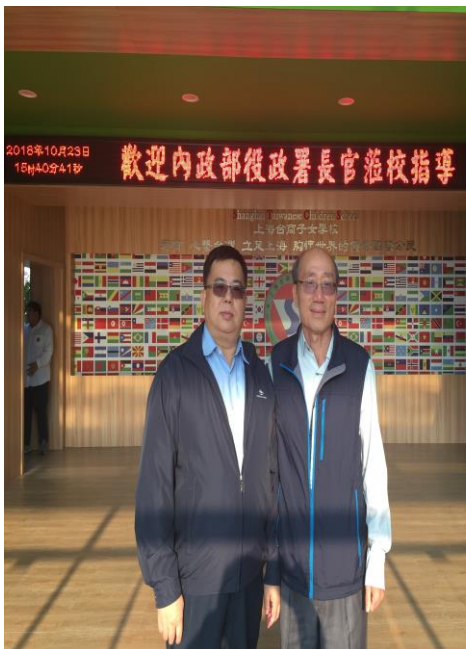
圖 5. 上海臺商子女學校