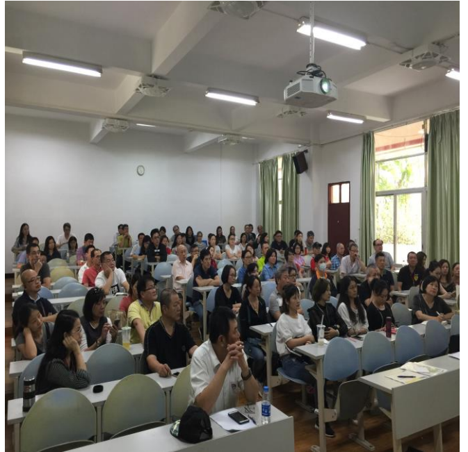
圖 12. 東莞臺商子弟學校座談會情形