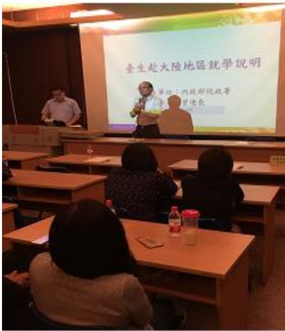
圖 3. 華東臺商子女學校家長學生座談會