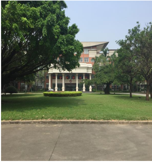
圖 15. 東莞臺商子弟學校校園