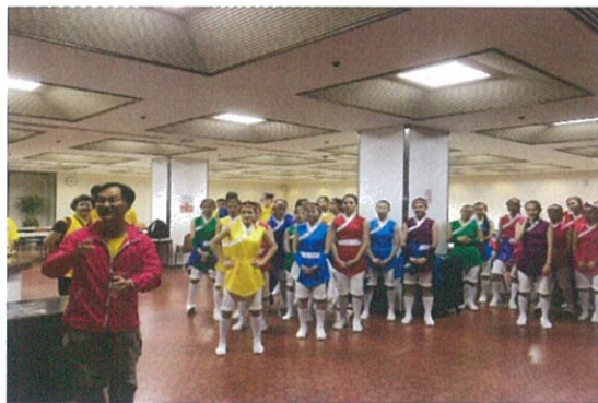
會後柯處長前往後臺勉勵同學