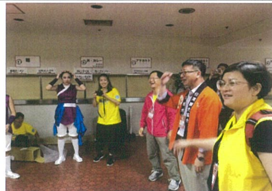
會後柯處長前往後臺勉勵同學