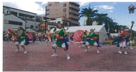
由觀光局與蘭陽女中組團赴日演出。

【本報記者報導】交通部觀光局與宜蘭縣立蘭陽女子高級中學一團，於十月四日至十月八日止，前往日本三重縣參加「YOSAKOI」國際舞祭活動，將農村文化融入舞蹈和劇中，展現台灣山區的民間文化特色。隨後於日本三重縣地原市對當地民眾的熱情。