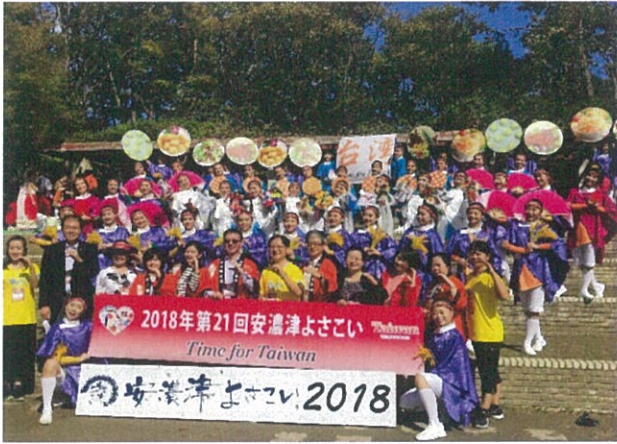
踩街遊行前全員大合照