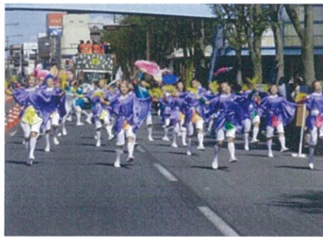
由觀光局與蘭陽女中組團赴日演出。

三重縣舞祭 YOSAKOI 國際舞祭活動在每年日曆上「第二」個年頭，不僅吸引日本各地民眾踴躍參與，更是當地地方盛事，觀光局為了強化日本地區宣傳力，由觀光局與蘭陽女中組團赴日演出，展現台灣山區的民間文化特色。