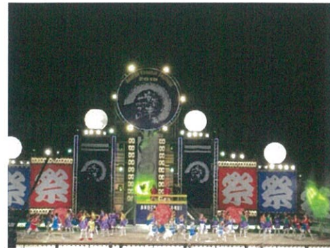
台灣代表隊蘭陽女中於主舞台表演