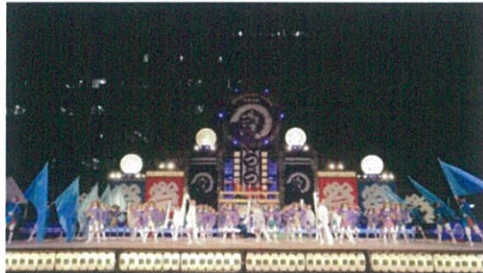
由觀光局與蘭陽女中組團赴日演出。