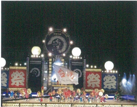
台灣代表隊蘭陽女中於主舞台表演