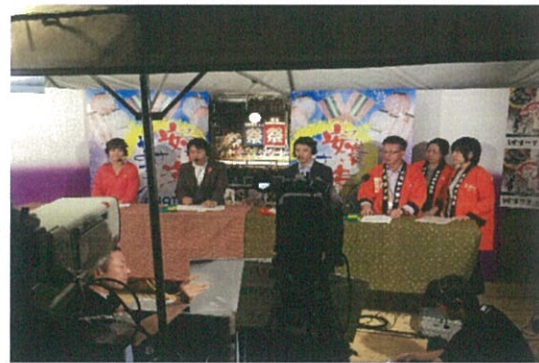
接受三重電視台訪問