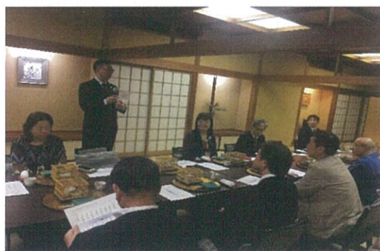
柯處長代表周局長向議員致意