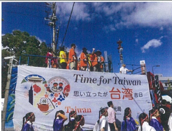
臺灣觀光形象宣傳前導車