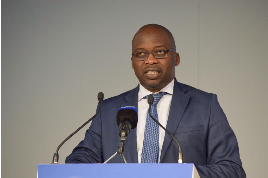
圖 3：南非法務部長 Michael Masutha 開幕致詞。