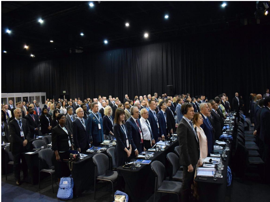
圖 1：第 23 屆 IAP 年會開幕式

國際檢察官協會（IAP）是一個非政府、非政治之組織，是世界上第一個國際檢察官組織。其於 1995 年 6 月在維也納成立，並於 1996 年 9 月在布達佩斯舉行的第一次大會，其創立是因為跨國犯罪日益嚴重，特別是販毒、洗錢及詐欺犯罪。國際間普遍認為需要加強檢察官間的國際合作，提高相互幫助、資產追蹤及其他國際合作的速度及效率。