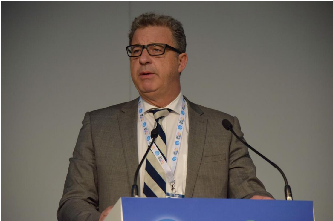
圖 5：聯合國國際刑事法庭首席檢察官 Serge Brammertz 主持討論。