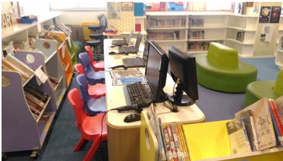
尚色園主辦可銘學校圖書館