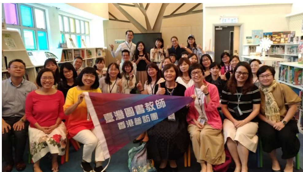
參訪油麻地天主教小學（海泓道）臺灣閱讀教師合影