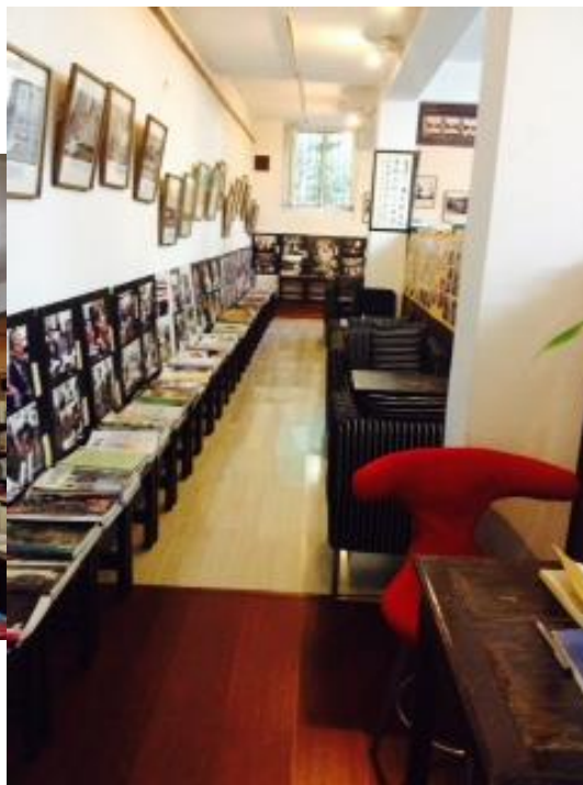
一樓茶座可免費閱覽雜誌書籍

三味書屋的書籍以文史哲類為大宗，並且多數是內容較艱深嚴肅的翻譯書(如《凱薩戰記·內戰記》、Peter Green《馬其頓的亞歷山大》等)，這與超大型的北京王府井書店(共 7 層樓)網羅廣泛類別書籍以及書展中