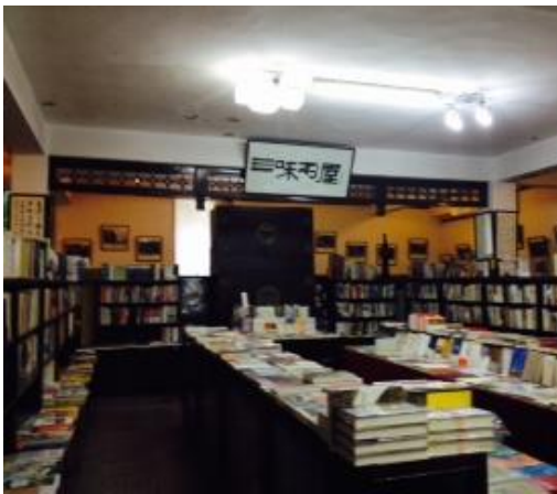
書店內裝，櫃面架上書籍約數千本