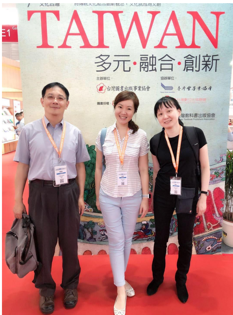
本部參訪人員於北京國際圖書博覽會臺灣館前合影

外展商 1,520 家。且共達成中外版權貿易協定 5,678 項，同比增長 7.9%。其中，達成各類版權輸出與合作出版意向和協議 3,610 項，同比增長 11.28%，達成引進意向和協議 2,068 項，同比增長 2.48%，引進輸出比為 1:1.74。書展期間，共舉辦了 1,000 多場文化活動，吸引 30 萬人次進場參觀，其中專業場人次達 15 萬，同比增長近 30%。 4