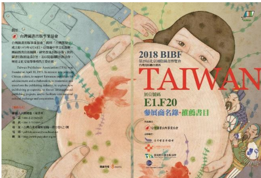
參展商名錄·推薦書目

協會今年特別設計製作「參展商名錄·推薦書目」手冊，於展會現場發送給參展人士。精美設計及提供資訊的方便性，獲得良好評價，另可提供後續的版貿接洽與聯繫需求。