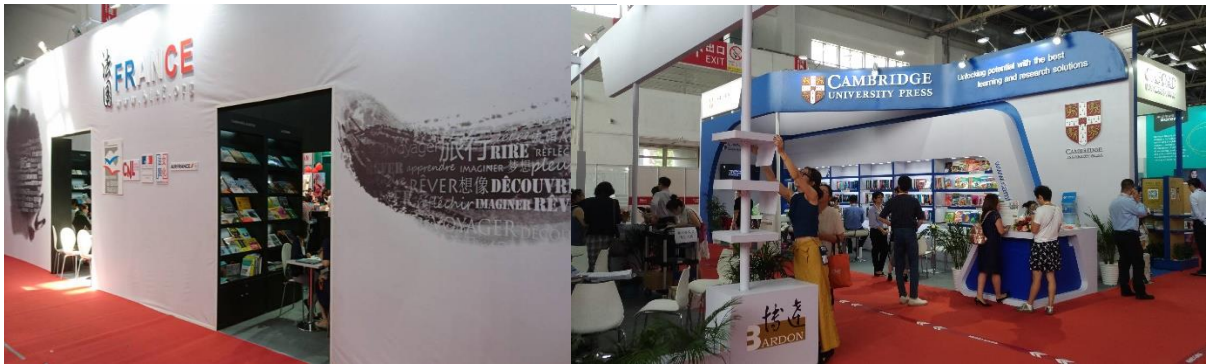
鄰近之法國及英國劍橋出版主題館

協會今年特別設計製作「參展商名錄·推薦書目」手冊，於展會現場發送給參展人士。精美設計及提供資訊的方便性，獲得良好評價，另可提供後續的版貿接洽與聯繫需求。