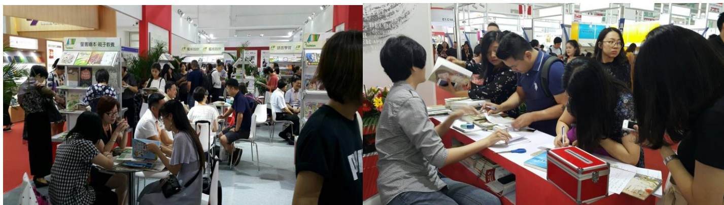
臺灣優質作品吸引大量人潮

今年臺灣館選擇靠近主走道的位置，走進 E1 區就能很快看到，也吸引更多人潮，相較於往年，在展位佈置、美術設計、書籍陳列等，都有整體規劃，與鄰近韓、美、法、英國等館輝映，更顯臺灣特色。