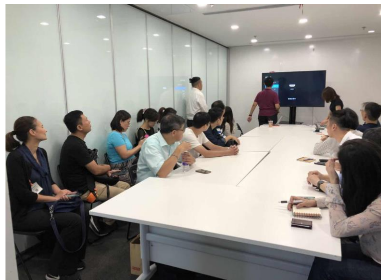
參訪來賓熱情發問