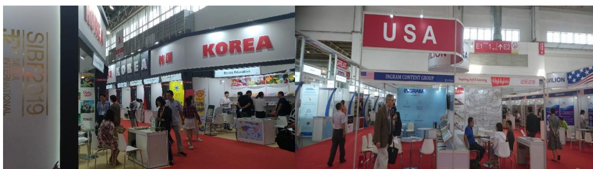
鄰近之韓國及美國主題館

今年臺灣館選擇靠近主走道的位置，走進 E1 區就能很快看到，也吸引更多人潮，相較於往年，在展位佈置、美術設計、書籍陳列等，都有整體規劃，與鄰近韓、美、法、英國等館輝映，更顯臺灣特色。