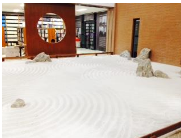
日式枯山水庭園室內造景