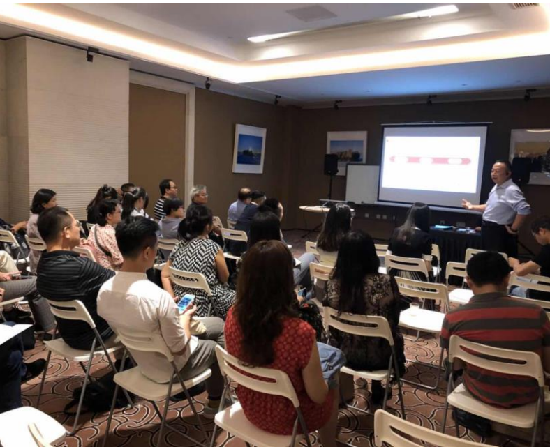
經營理念及產品類型分享