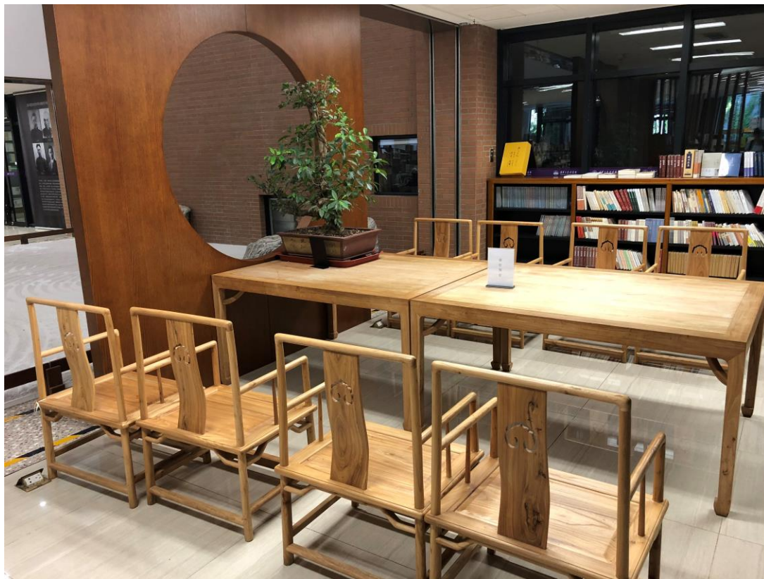
充滿人文氣息的內裝

鄴架軒內部陳設雅致帶有典型文人風格，大量木頭裝潢感覺相當溫暖，並運用中式園林及日式枯山水的造景概念於室內角落設置休憩閱讀空間。會議室可出借辦活動，不用時則開放讓學生免費溫書。