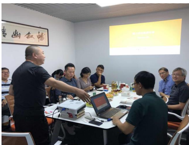
公司簡介與有聲書市場分析