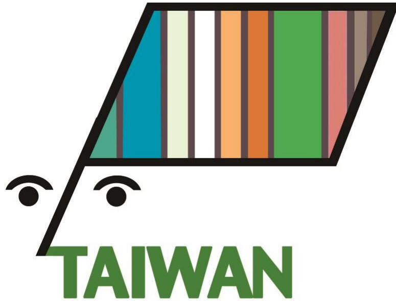
臺灣主題館主視覺圖像

本屆臺灣童書館設置 8 個展位，展售優質特色兒童書籍、益智教具等，於現場直接推廣予參觀者、世界各國同業、圖書館及幼教業者。展期五天臺灣主題館、臺灣兒童館，依出版協會的統計約有 400 次的版權會議，另因中國大陸出版公司較之出版集團更具發展潛力、更積極更有市場性，買斷出版內容，尤其是幼教類、兒童類的套裝圖書，預估後續版權交易金額，約可達新臺幣 3,000 萬元。