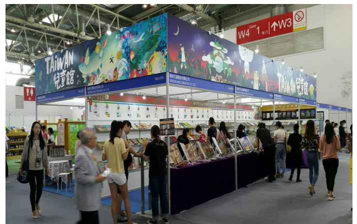
臺灣童書館整體設計