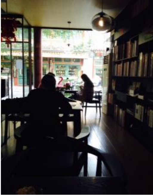
安靜閱覽書籍的客人