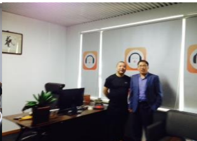
兩地數位產業龍頭業者相見歡