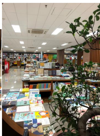
書店內部主題書區空間