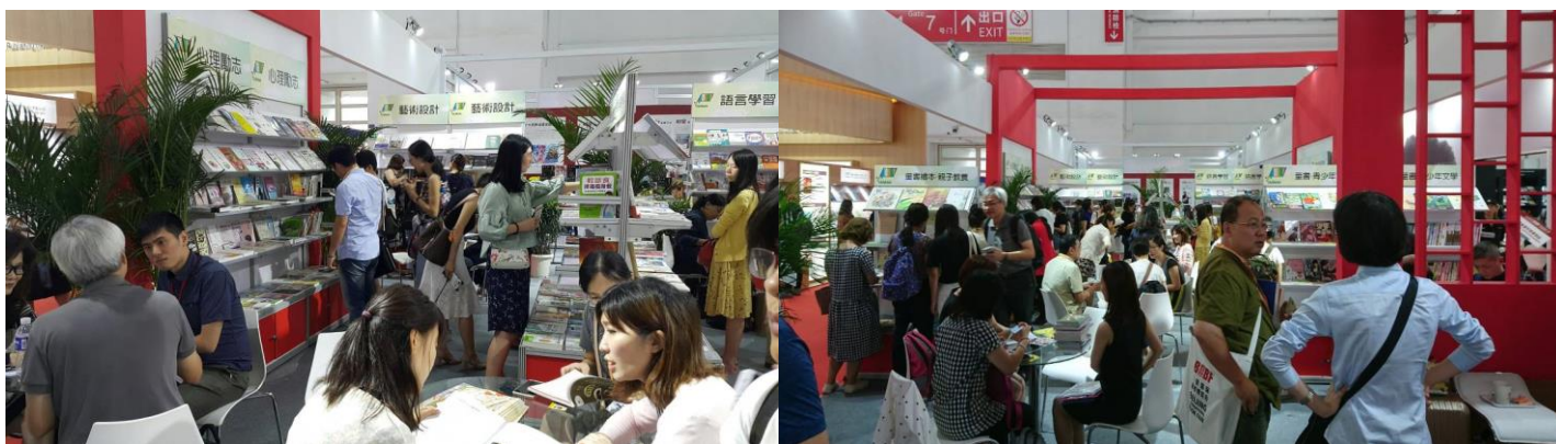
臺灣館內版權洽談熱絡