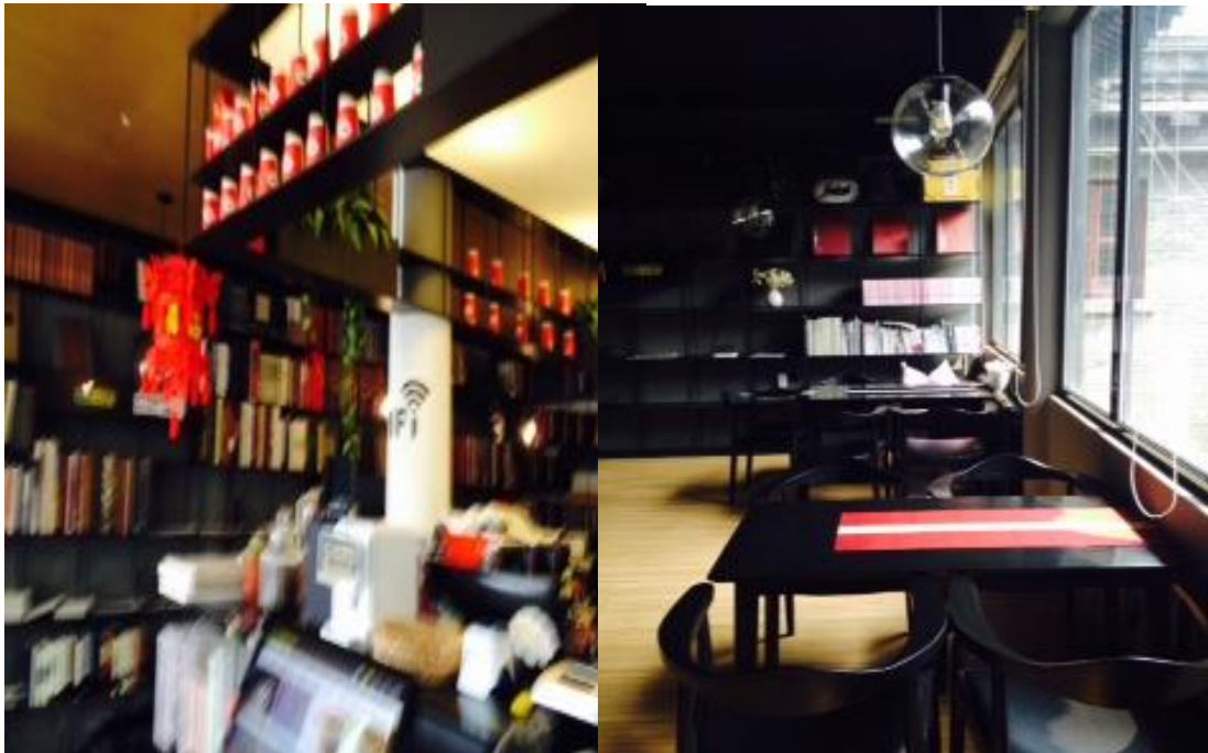
榮寶齋咖啡書屋入口處櫃台

店內全黑空間坐定後感覺異常放鬆，消費者像是躲進洞穴避暑的小動物，一邊翻閱畫冊小說，一邊看著大玻璃窗外赤柱青瓦中式老屋，烈陽伴著樹影讓顏色變得份外鮮明，像是登出了現實世界，進入古老中國的夢境一樣。觀察店內來客，年輕人到老者皆有，大多靜靜看書品飲，看來很熟悉也很享受這個空間，是一個很成功的咖啡廳兼營書店設計。