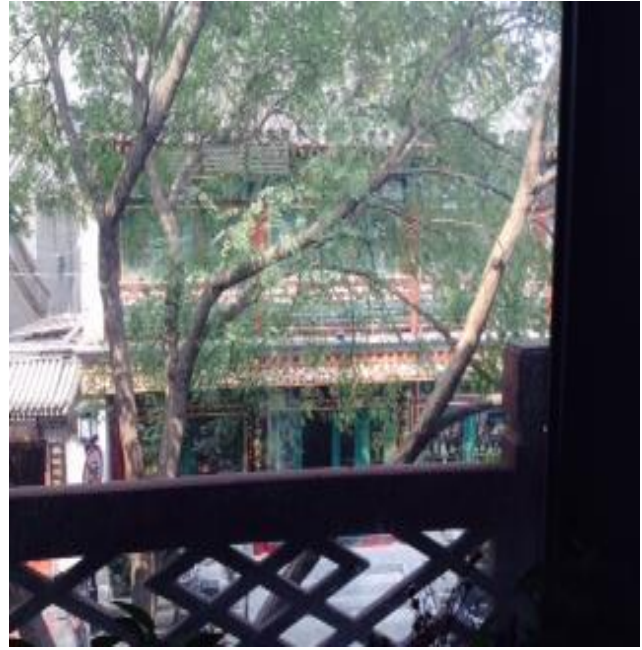
二樓落地窗外的街景

榮寶齋在書畫圈赫赫有名，很多人會專程去購買手工宣紙，店員也會依據客人所屬的宗派、師承及擅長題材(山水或花鳥靜物等)推薦適合的用紙，它不只是一間老書店而已，其多角、專業且永續的經營手法，或許值得國內的獨立書店及傳統產業職人借鏡。