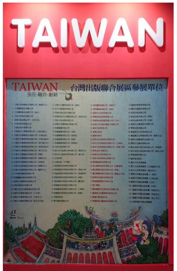
文化臺灣宣傳圖像看板

在展位左右兩側走道的中央，同時設置兩座大型看板，其中一個清楚標示了本屆臺灣館的參展單位名錄，整體的視覺規劃，呈現臺灣人文風情，吸引許多大陸出版業者進入參觀，現場也預備版權交易專屬會議室，提供個別洽談。