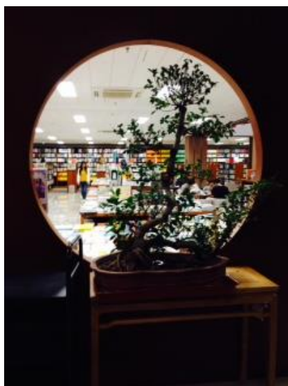
中式園林「借景」概念