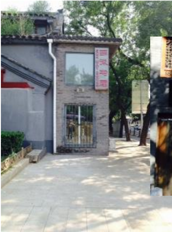
三味書屋，北京第一間民營獨立書店