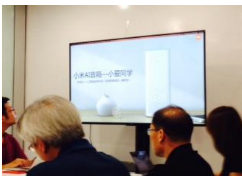
小米介紹智慧音箱「小愛同學」

就未來的發展趨勢部分，針對傳統產業如何因應當代市場的提問，小米科技的建議是鼓勵業者可積極學習 AI 機器及善用大數據等資源，並且深入了解互聯網及用戶的體驗，來提升服務及分析如何著力。同時小米科技也表示，已在規劃臺灣版本的小米智慧音箱，將在北京研發。