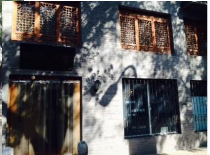
書店外觀新舊混合，隨意而閒適