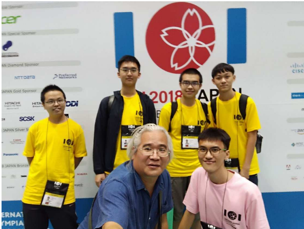
賽後我國選手們與指兩位指導老師合影

9月6日主辦單位安排了讓大家放鬆的活動，包括海濱公園海洋世界以及一個神社的參觀。海濱公園(Hitachi seaside park)非常的大，時間的限制下只能走一小段，但風景相當優美。海洋世界跟國內的類似遊樂園相同，有海豚海獅表演還有水族動物，Oarai Isosaki Shrine 是海洋世界附近的一個神社，讓大家可以了解日本文化。