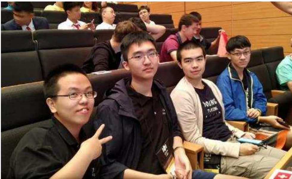
我國選手參加開幕式

9月2日早上為大會的開幕儀式，下午則為選手練習賽時間。開幕儀式主要是一些重要人士的致詞，由於日本皇室佳子內親王蒞臨會場，因此維安特別嚴格，李忠謀教授也以 IOI 主席的身分致詞。除了致詞之外，也安排了一些表演活動，今年大會有一位虛擬的演藝人員當親善大使，這個表演很受到年輕朋友的歡迎。下圖為選手在開幕典禮會場以及李忠謀教授致詞的照片。