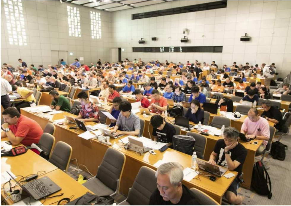
試題翻譯及領隊會議會場

9月2日早上為大會的開幕儀式，下午則為選手練習賽時間。開幕儀式主要是一些重要人士的致詞，由於日本皇室佳子內親王蒞臨會場，因此維安特別嚴格，李忠謀教授也以 IOI 主席的身分致詞。除了致詞之外，也安排了一些表演活動，今年大會有一位虛擬的演藝人員當親善大使，這個表演很受到年輕朋友的歡迎。下圖為選手在開幕典禮會場以及李忠謀教授致詞的照片。