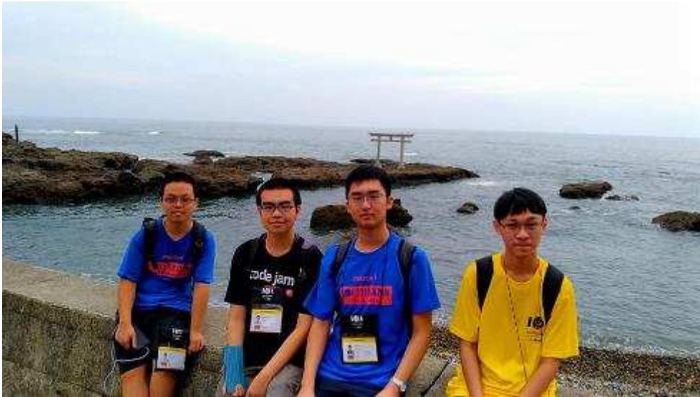
選手們參觀 Oarai Isosaki Shrine