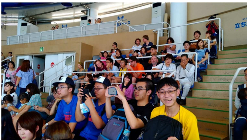
選手們參觀海洋世界

9月6日主辦單位安排了讓大家放鬆的活動，包括海濱公園海洋世界以及一個神社的參觀。海濱公園(Hitachi seaside park)非常的大，時間的限制下只能走一小段，但風景相當優美。海洋世界跟國內的類似遊樂園相同，有海豚海獅表演還有水族動物，Oarai Isosaki Shrine 是海洋世界附近的一個神社，讓大家可以了解日本文化。