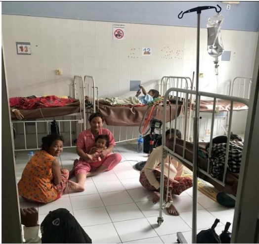
圖七(茶膠醫院住院病房現況)