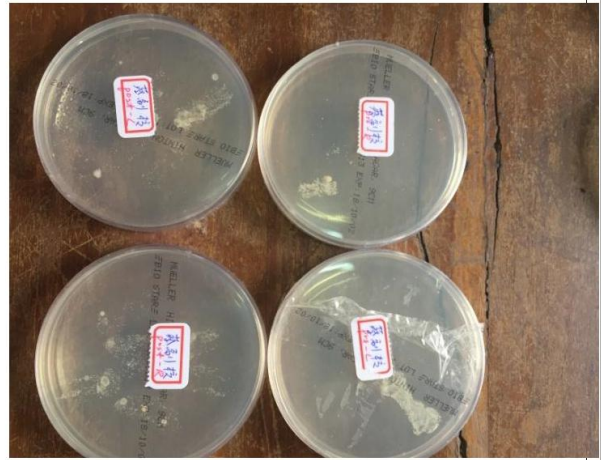
圖六(查看 24 小時培養血菌落數)