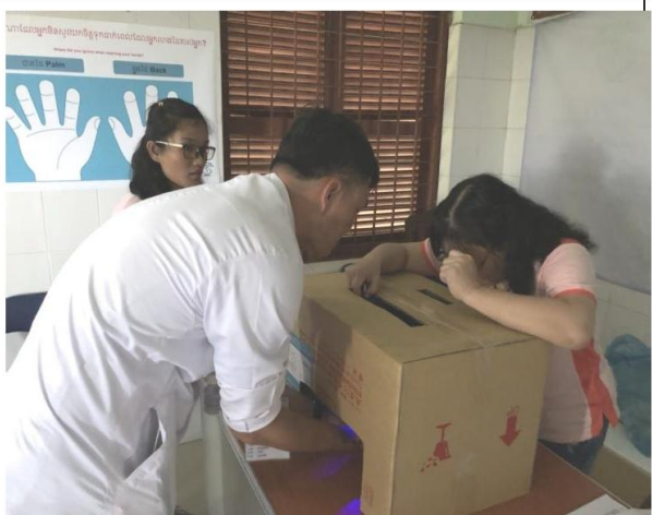
圖五(螢光劑闖關活動)