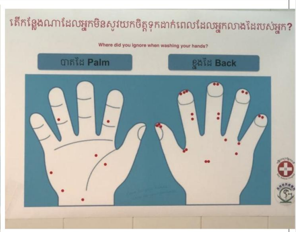
圖六(不易洗乾淨的部位分布圖)