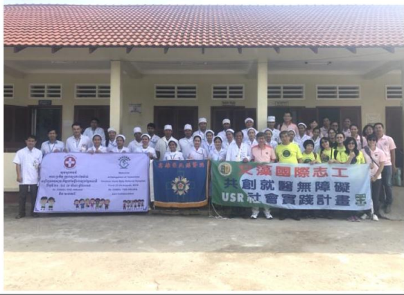
圖一(與巴提醫院員工合照)