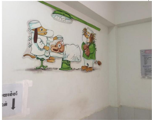
圖八(外國團體至茶膠醫院牆面繪圖)