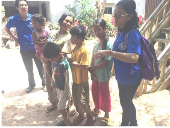
圖三(村莊內輔導個案家庭)