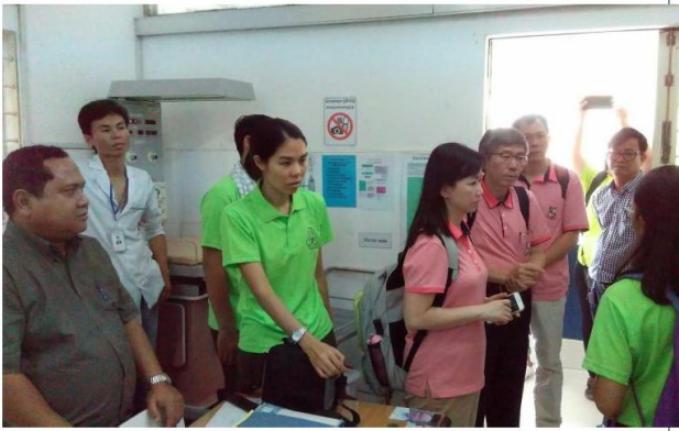
圖五(茶膠醫院院長醫院介紹)