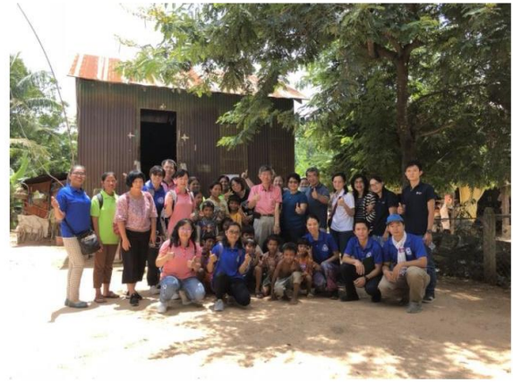
圖四(與村莊及工作人員大合照)