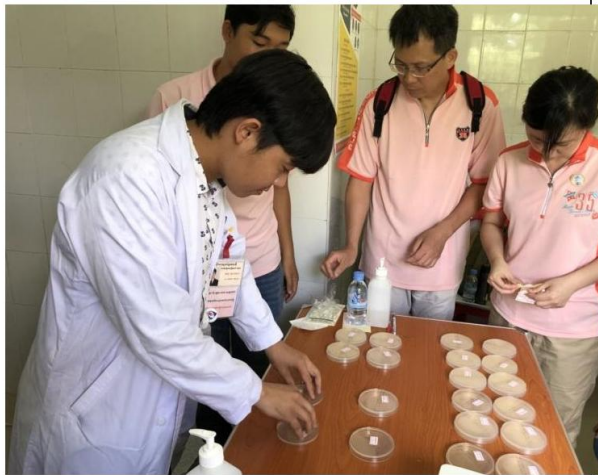
圖三(培養皿按壓活動)