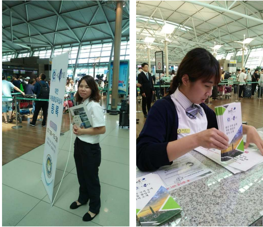
圖5 機場出境大廳招攬旅客、航空公司櫃檯放置摺頁