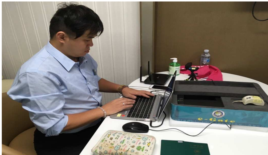
圖 3 工程師(廠商)安裝及測試電腦