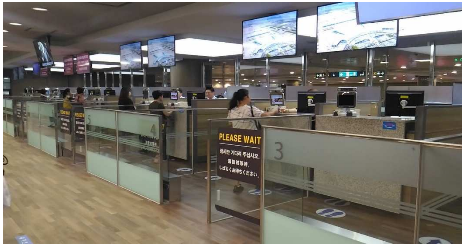
圖 10 查驗櫃檯前設置阻隔下一位旅客的透明門擋

韓國設有與日本相似一體成型之查驗機臺，生物特徵系統於查驗人員刷旅客護照後即自動切換該國籍語音字幕，可大量改善查驗之不便性及節省旅客通關時間，更能貼近旅客需求。