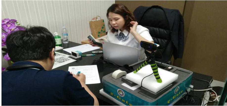
圖 7 辦理韓籍旅客註冊情形