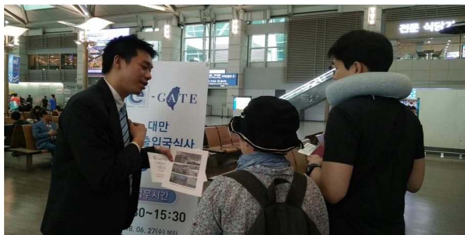
圖6 仁川機場出境大廳招攬旅客辦理自動通關註冊