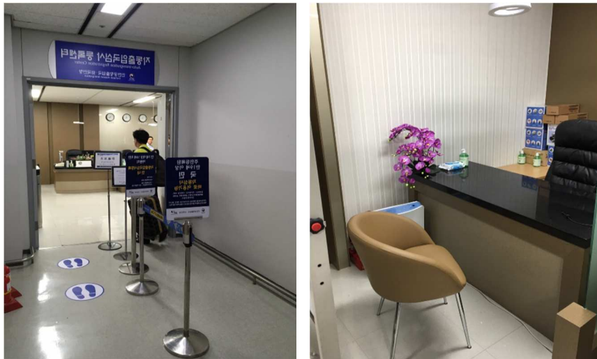
圖1 我駐點仁川機場受理註冊地點

(一)執行註冊地點：本次前往韓國註冊地點為仁川機場，為利旅客辦理後搭乘班機抵臺時即可使用，選在仁川機場出境大廳，惟受於場地協調取得不易，故未能安排於出境大廳顯眼處，為美中不足之處（圖1）。