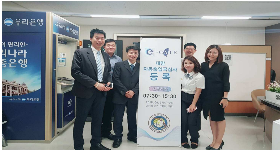
圖 2 我工作人員與韓方入出境管理局機場人員合影