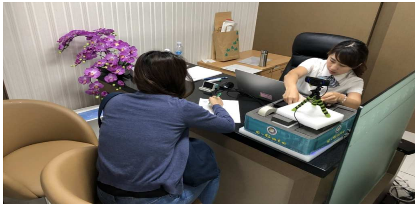
圖 8 辦理韓籍旅客註冊情形