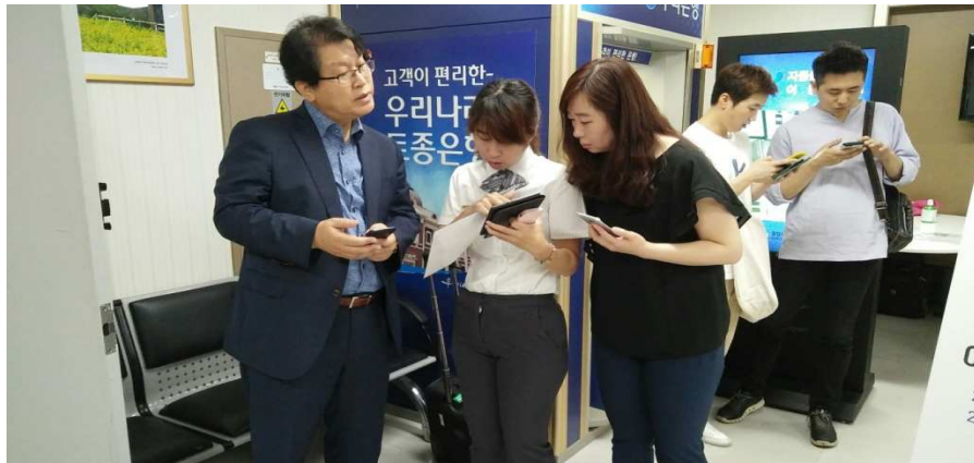
圖 9 協助韓籍旅客填寫電子 A 卡