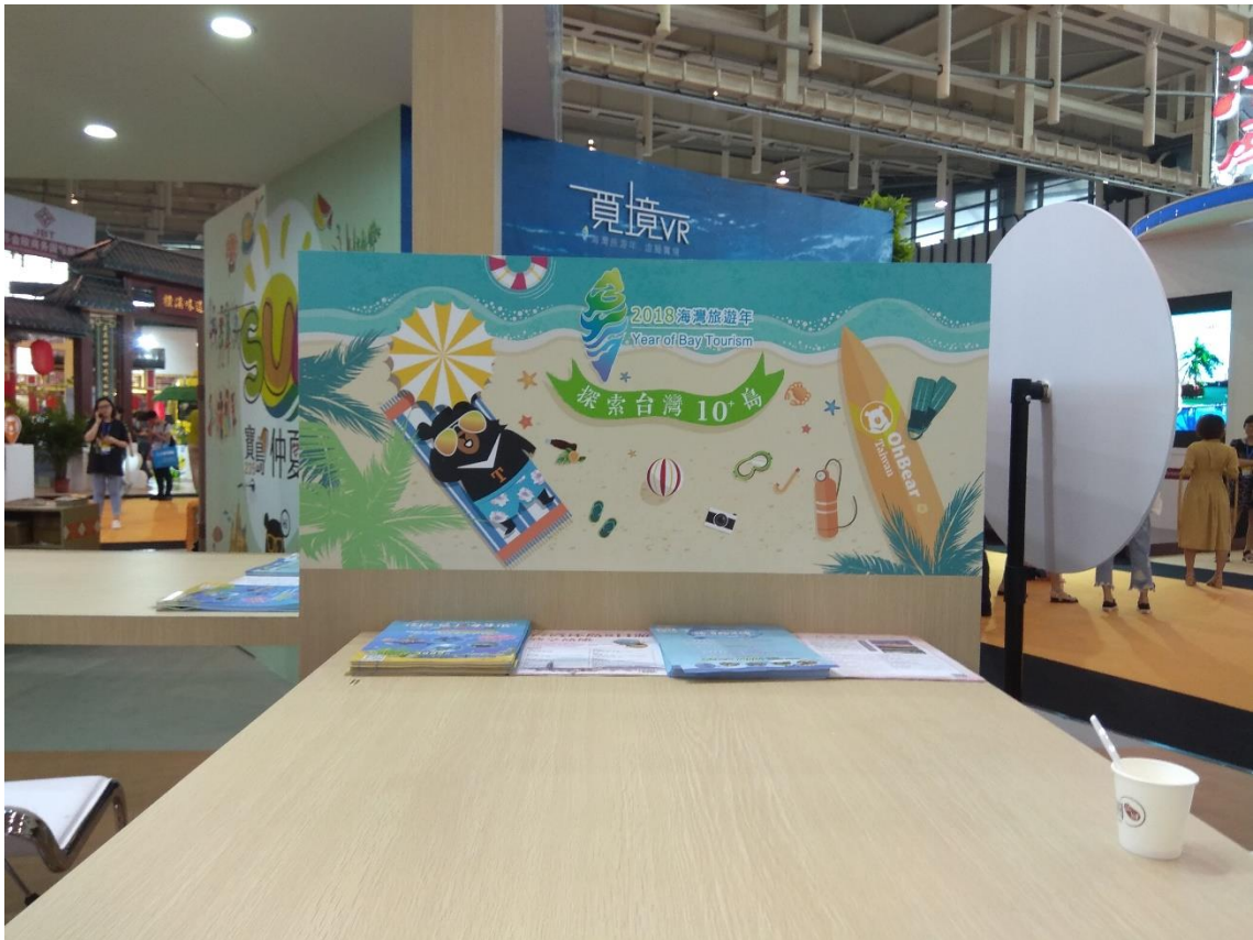
行銷 2018 海灣旅遊年