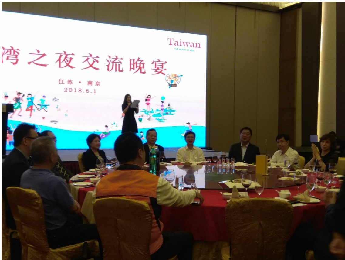
上海辦事處舉辦「臺灣之夜」交流晚宴