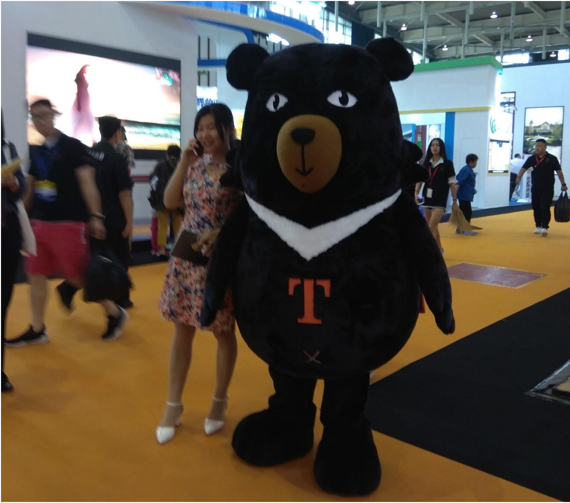
喔熊組長親自歡迎民眾來臺灣館參觀並合影