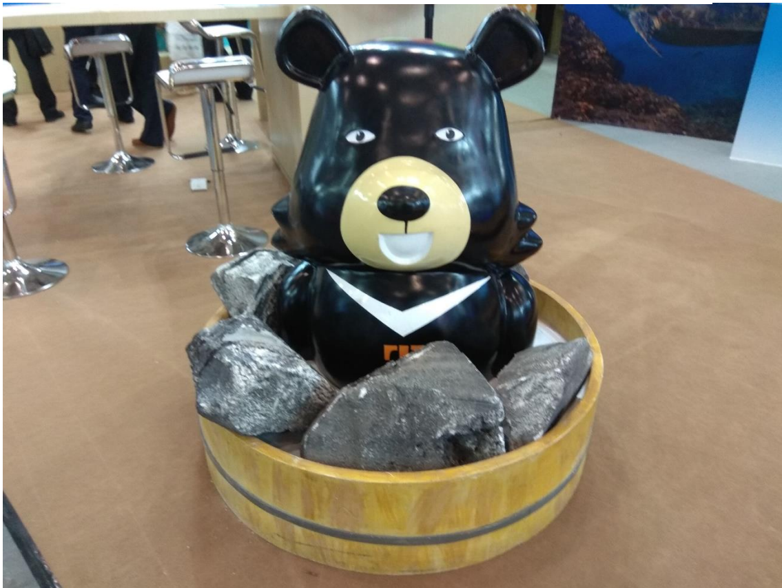
臺灣館溫泉主題旅遊元素