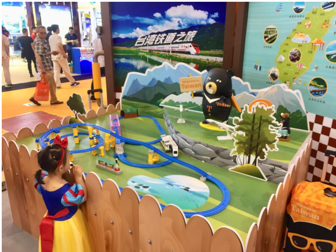
鐵道旅遊展式區吸引兒童駐足