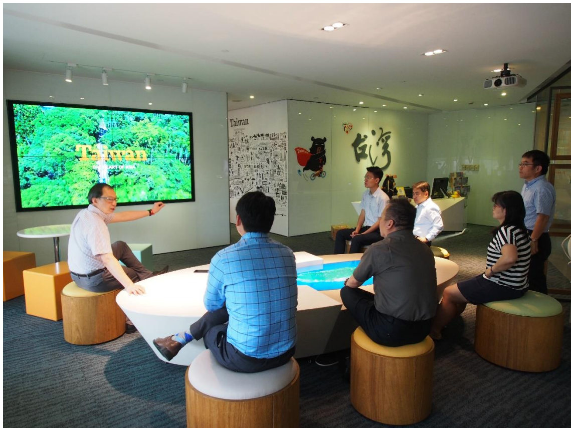
介紹上海辦事處接待民眾友善環境