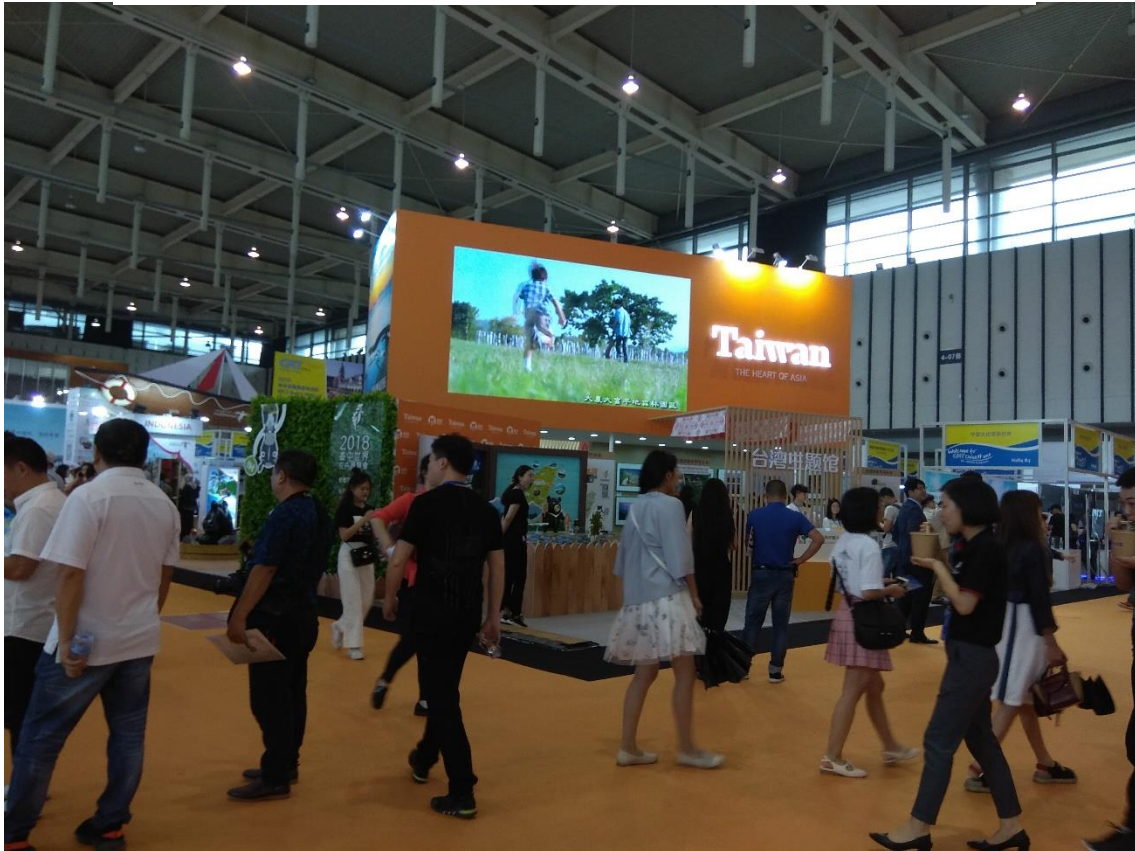
臺灣館 LED 大螢幕輪播觀光宣傳影片