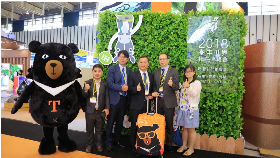
行銷 2018 臺中世界花卉博覽會