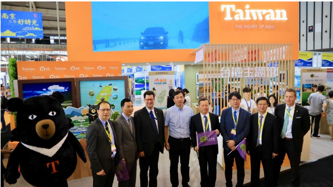
南京市副市長蒞臨參觀