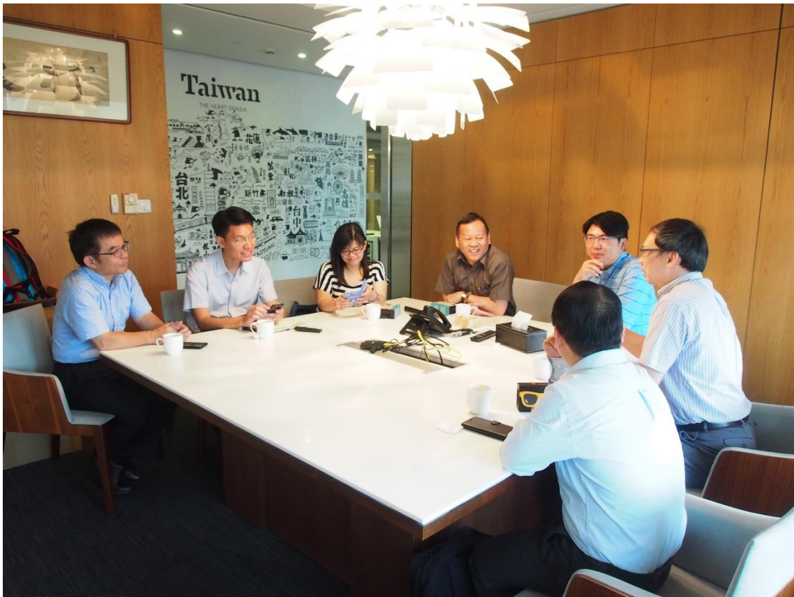
上海辦事處-大陸市場行銷推廣座談會