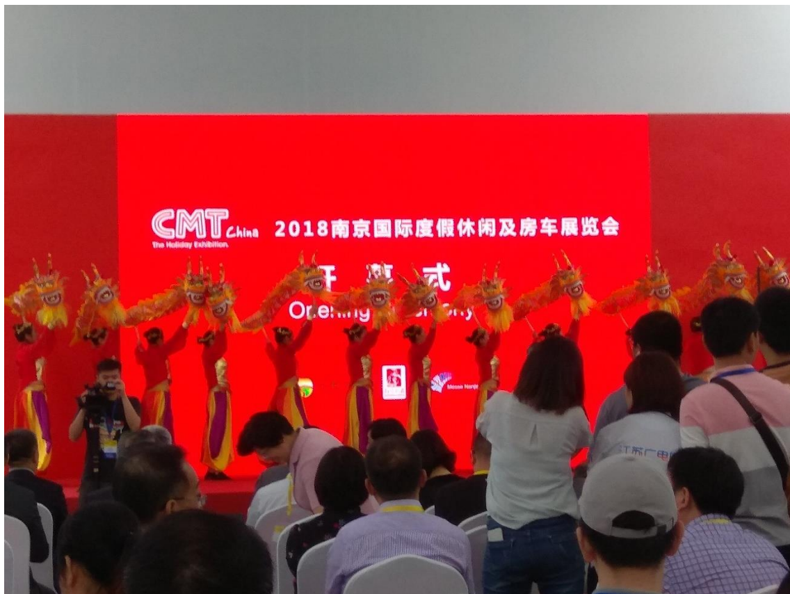
「2018年南京國際度假休閒及房車展覽會」開幕式