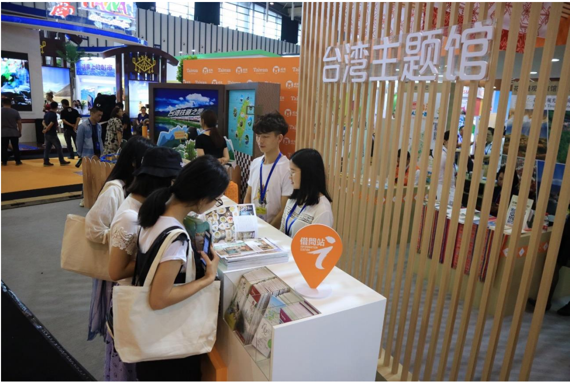
現場民眾詢問踴躍