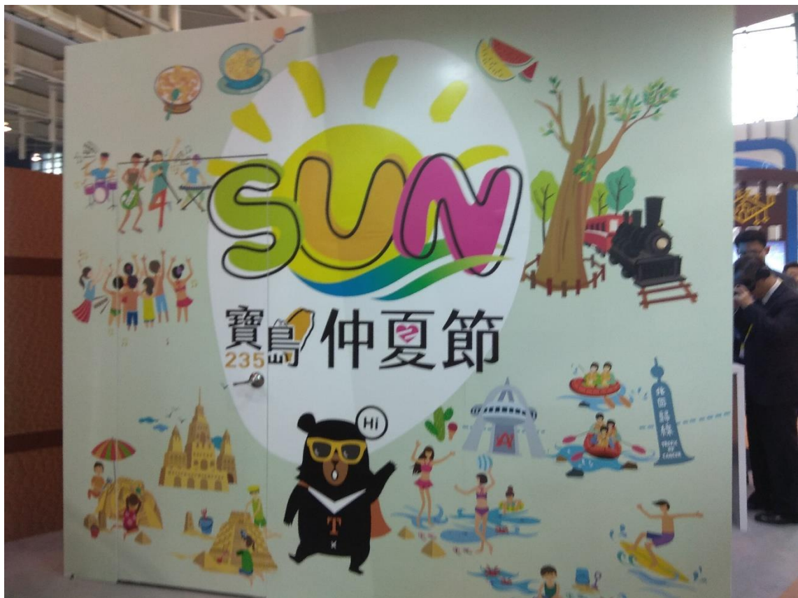
寶島仲夏節旅遊元素