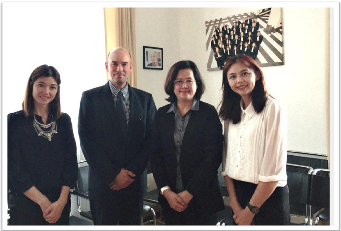
訪團與盧森堡地檢署 George OSWALD 副檢察長合影留念

官學院 (ENM) 或比利時司法官訓練中心 (IGO-IFJ) 上課，上課地點由檢察總長辦公室規劃，另外 6 個月在盧森堡法院或檢察署工作，通過職前訓練者才會被任命為法官、檢察官。盧森堡司法官也有律師轉任制度，前提是考試未能錄取足額的司法官，才會透過律師轉任的管道進用。律師透過書面申請之方式申請轉任，申請的資格條件如下：①要符合報考司法官考試之國籍、語言及心理及體檢條件②取得完成訓練的證明③5 年以上律師執業經驗。負責遴選司法官的 7 人委員會負責面試，委員會在遴選時也會參考盧森堡法律課程之訓練考試成績、專業經驗以及其他資格條件及文章發表。