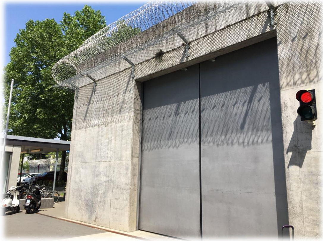
(上圖、下圖)法蘭克福 JVA 第四監獄門口一隅