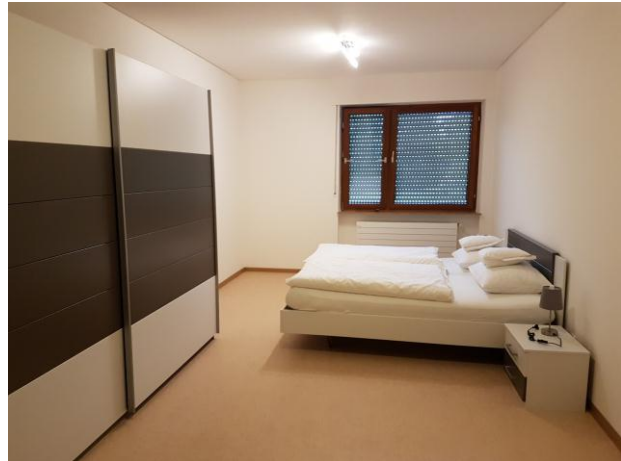
德國司法官學院的家庭宿舍

學院內分為教室區、宿舍區及休閒區，訪團先參訪宿舍區，德國司法官學院幾乎全部是單人房設計，房內乾淨舒適，設備齊全，唯有不裝設電視，其目的是要讓來受訓的法官、檢察官可以多利用這個寶貴的機會相互交流，除單人房以外亦提供少數雙人房讓配偶同為