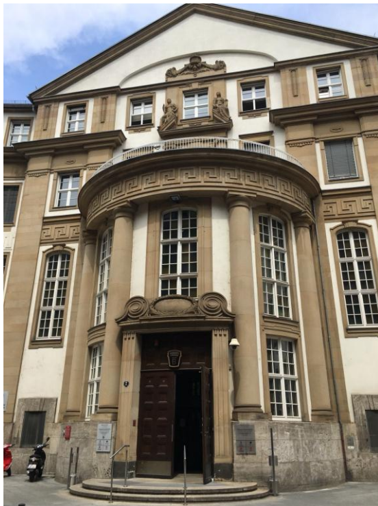
(左圖) 法蘭克福萊茵美因區法院 門口一隅