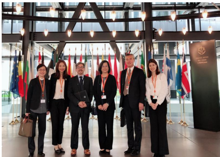
(左圖)訪團參觀歐盟法院建築 (下圖)歐盟法院法庭