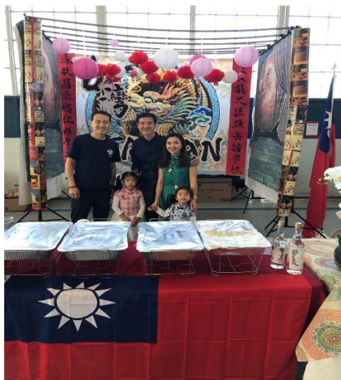
國際文化節活動花絮

為敦睦國際邦誼及增進學員間交流，由院方依節令及課程空檔，安排院內或院際社交活動。各項活動由學員自治幹部主導規劃，活動內容包括烤肉活動、各式球類競賽與路跑活動、國際文化節、聖誕節舞會等等，藉此增加學員及眷屬間互動頻率並舒緩課業壓力。