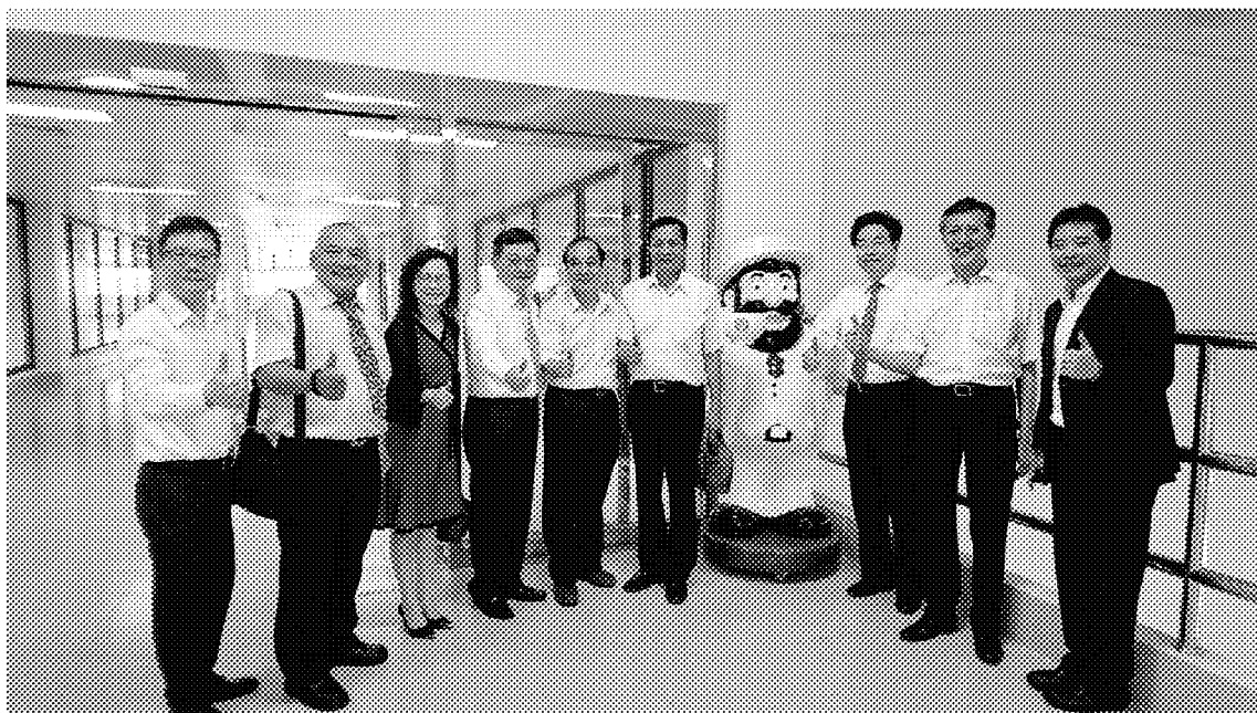
4月11日參訪越南同奈省金車伯朗公司