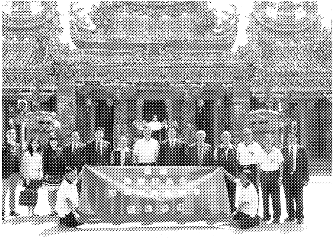
4月10日參訪泰國暹羅代天宮