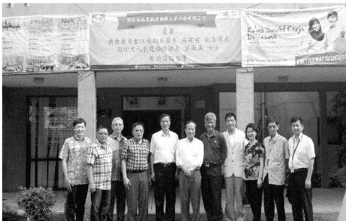
4月12日參訪凱達國際人才仲介公司外勞訓練中心及PT Budidaya Bahari Caksana 水產養殖公司軟殼蟹養殖場