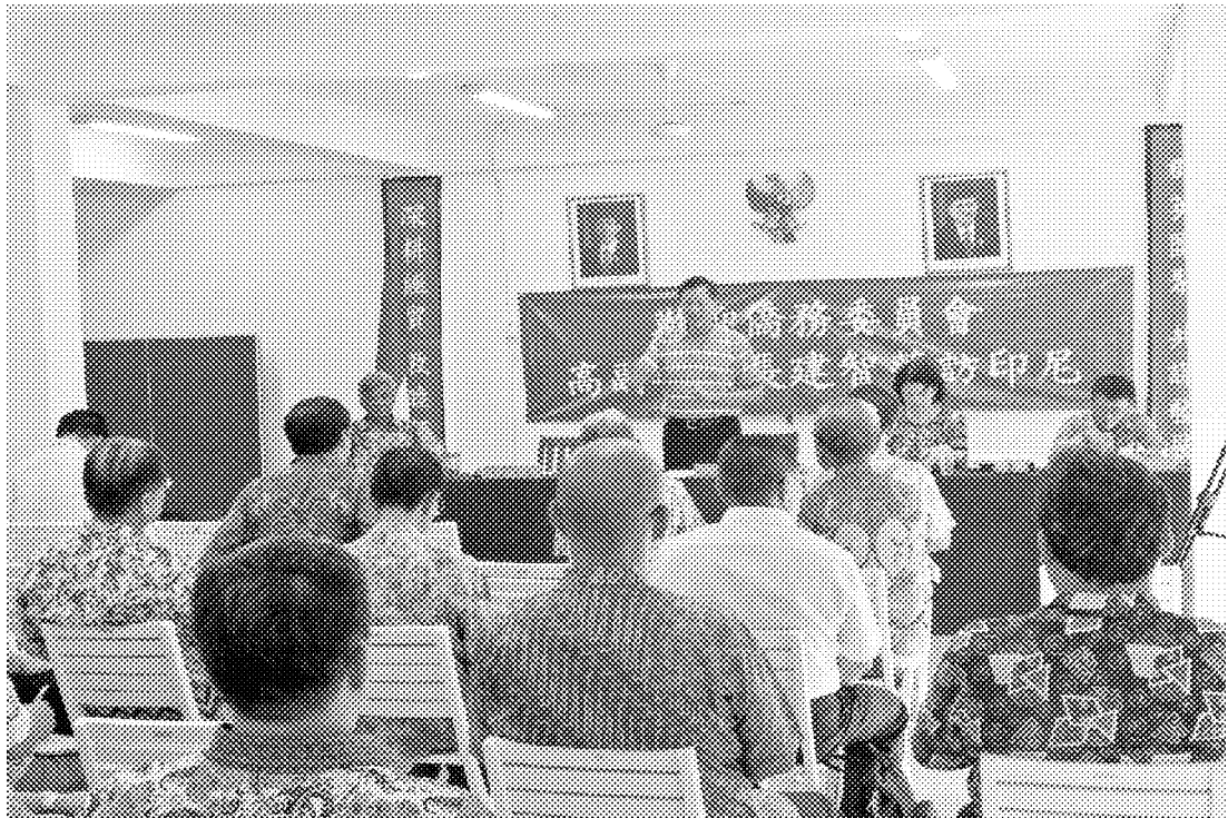
4月13日拜會印尼臺灣工商聯誼會聯合總會並與僑臺商座談