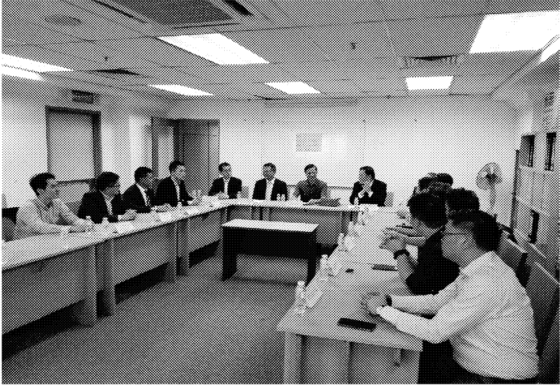
4月15日拜會馬來西亞臺灣商會聯合總會並座談