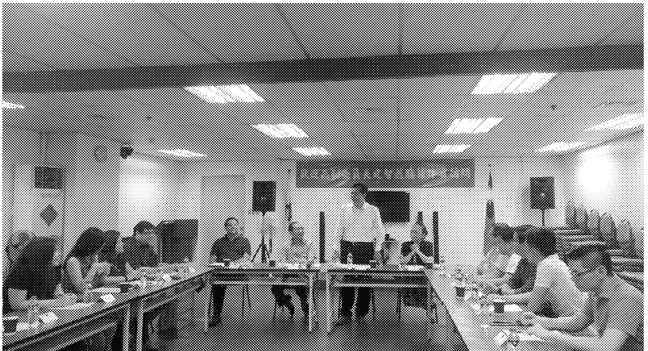
4月19日訪視菲華僑教中心並與青年服務團成員座談