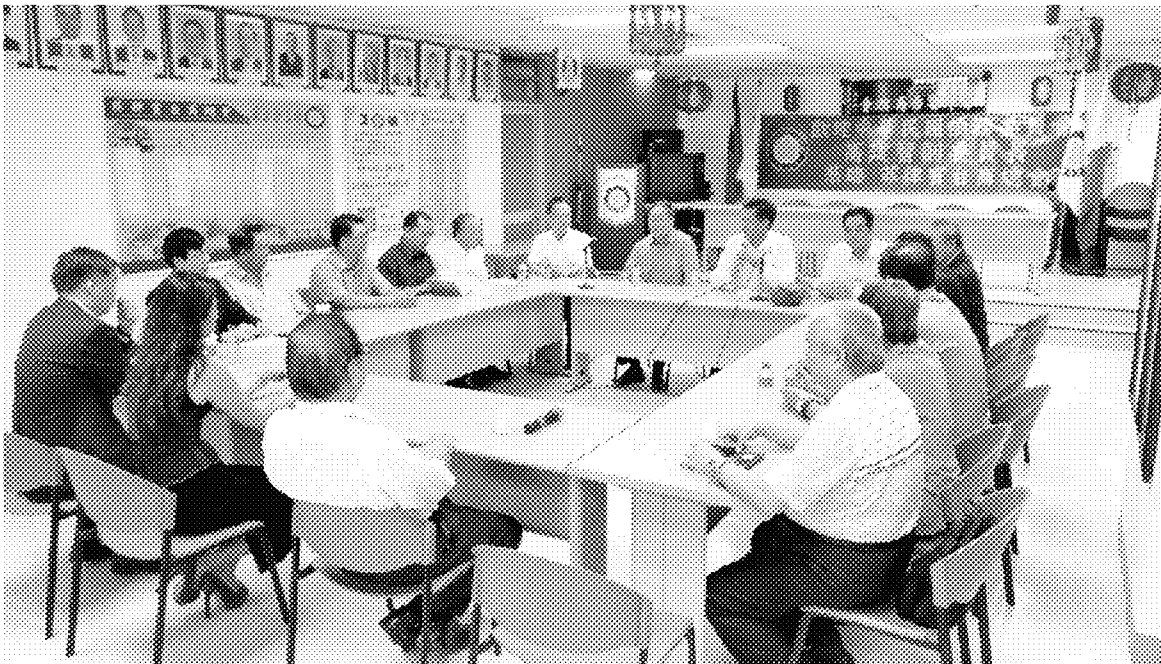
4月18日拜會菲律賓臺商總會並與臺商座談聽取建言