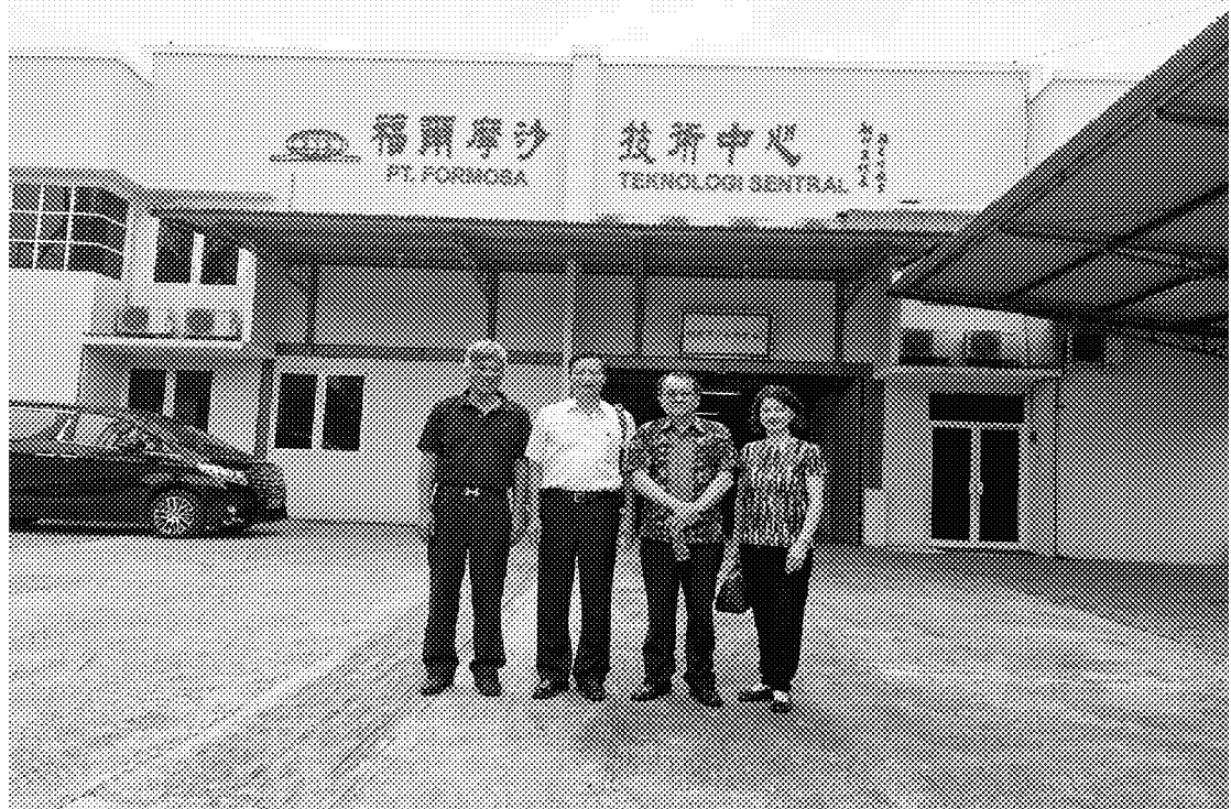
4月14日參訪福爾摩沙技術訓練中心