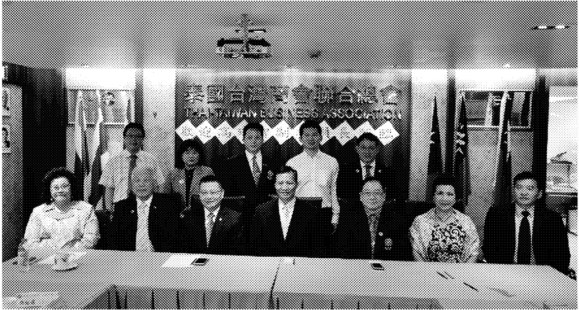
4月9日拜會泰國臺灣商會聯合總會宣導返國投資新創事業及僑胞卡