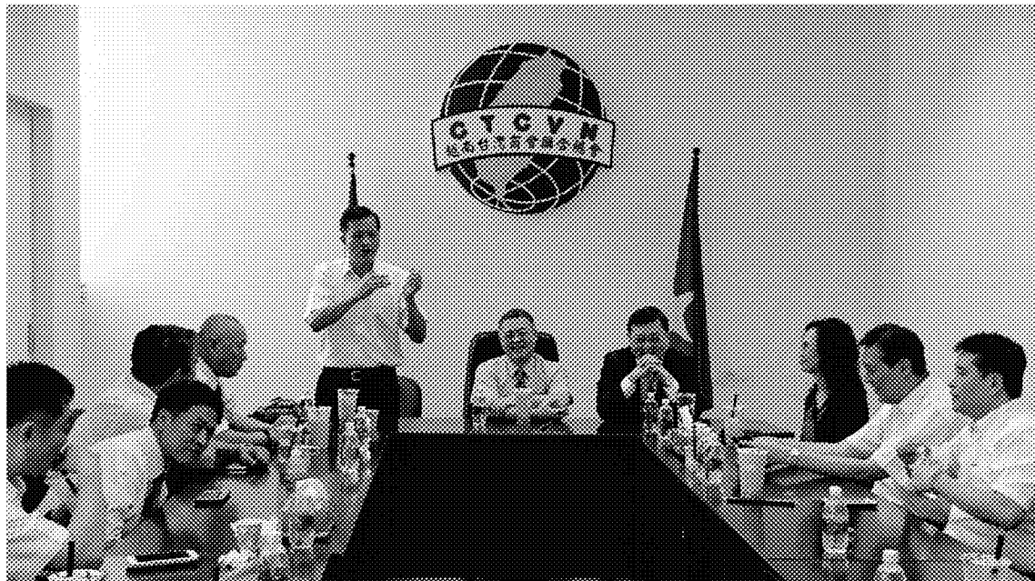
4月11日拜會越南臺灣商會聯合總會並座談