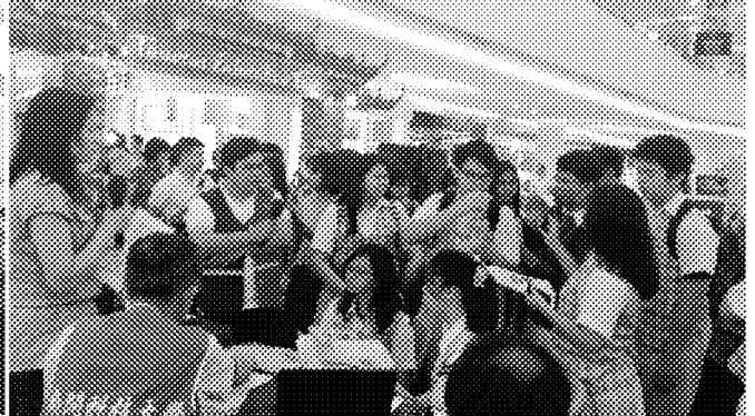
海青班教育展 辦理實況