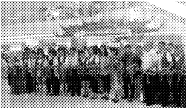
海青班教育展 辦理實況