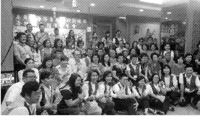
招生宣導座談會 辦理實況