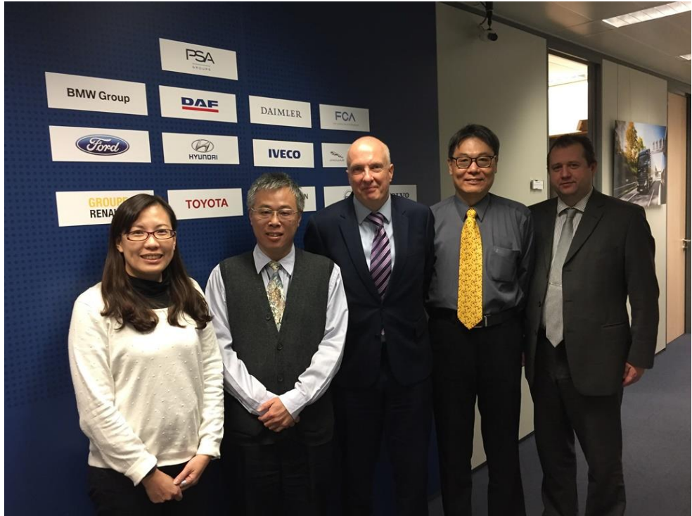
圖一、ACEA代表與本次考察團員合影