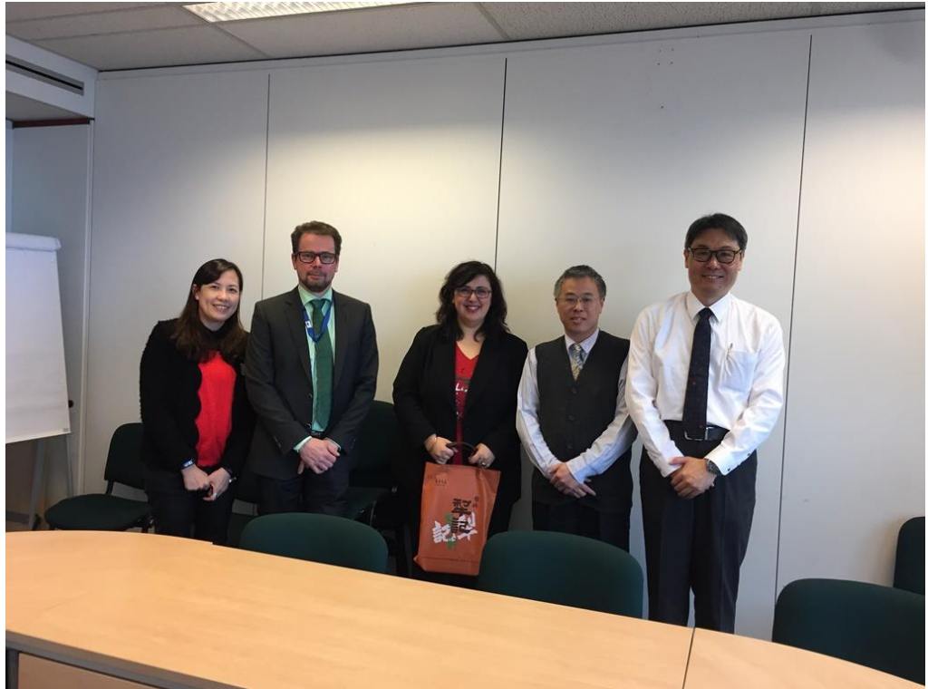
圖三、EU COMISSION代表與本次考察團員合影