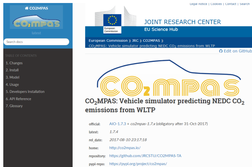
圖二、NEDC與WLTP轉換計算工具(CO2MPAS)

歐盟針對WLTP及NEDC兩種測試程序所產生的車輛CO 2 排放值，也提供了由歐盟的JRC(JOINT RESEARCH CENTER)所開發的CO 2 MPAS(Vehicle simulator predicting NEDC CO 2 emissions from WLTP)的轉換工具(如圖二)，作為指引。網址為 https://co2mpas.io/ 。另外針對Correlation procedure及Target translation也公布相關指令可供參考。