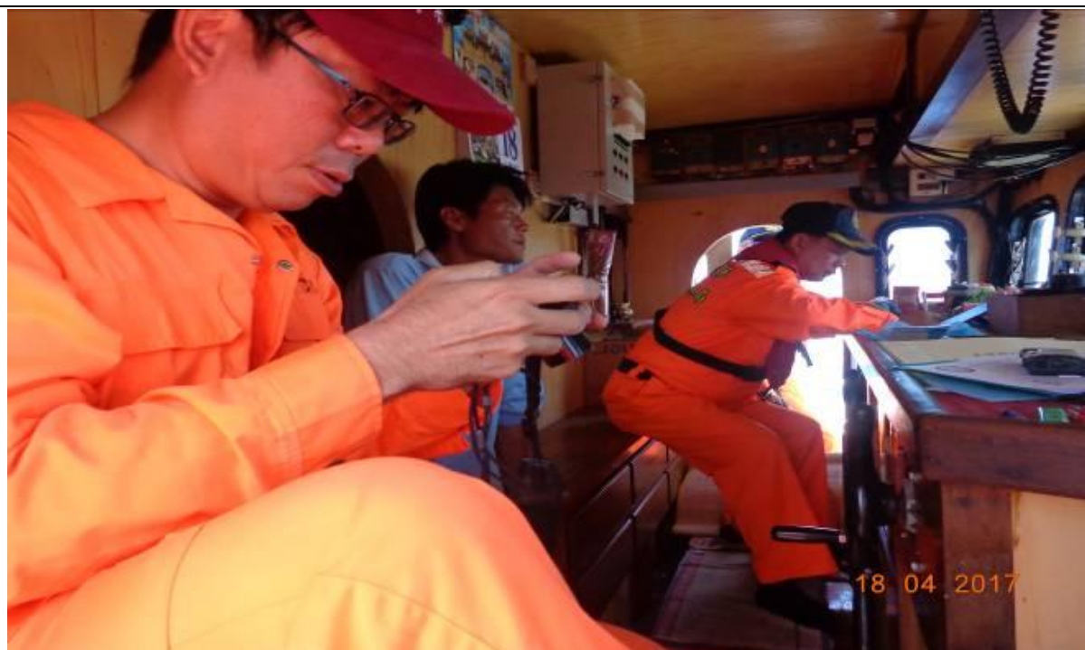
說明：漁業署檢察員及海巡署人員填寫登檢紀錄。