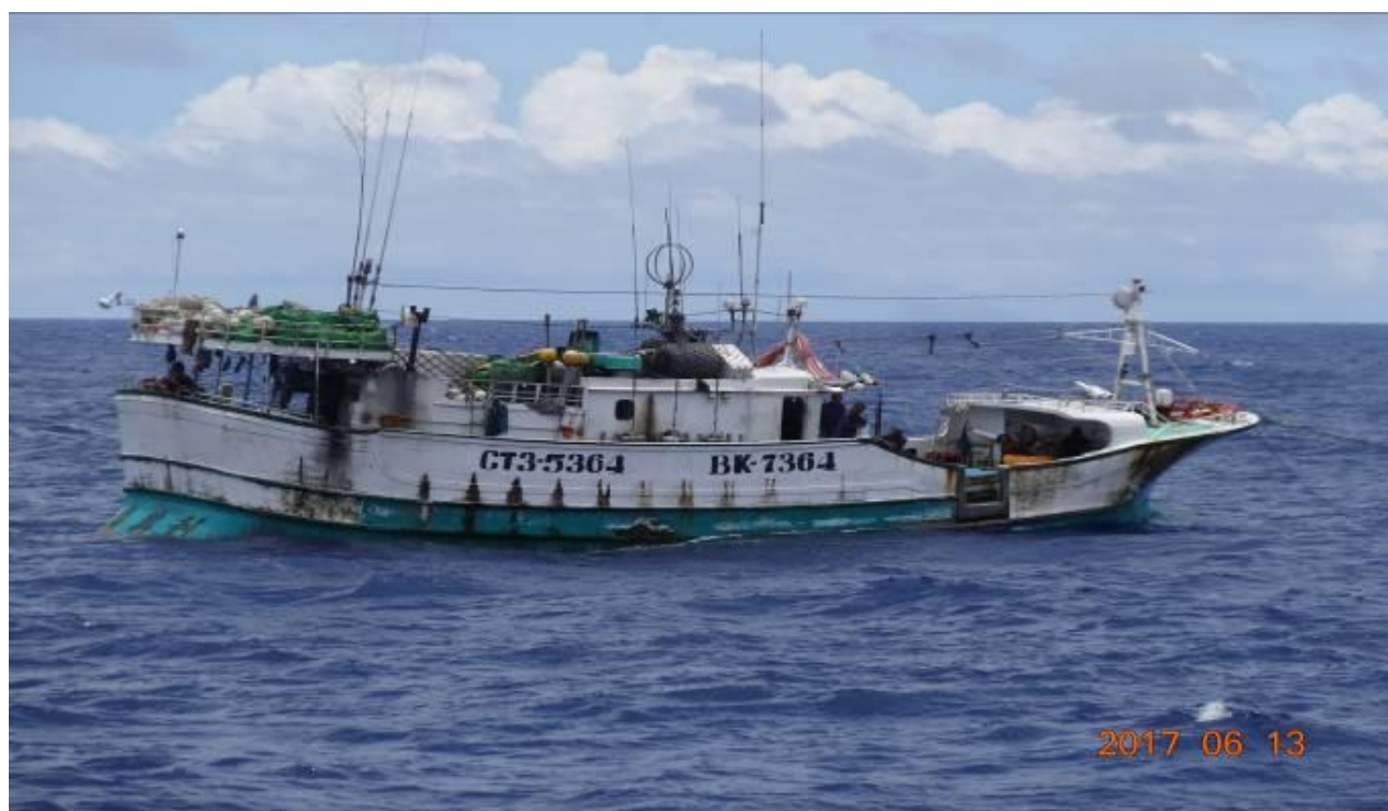
說明：106年6月13日慰問「廣興利號漁船 CT3-5364」、國際呼號：BK7364。