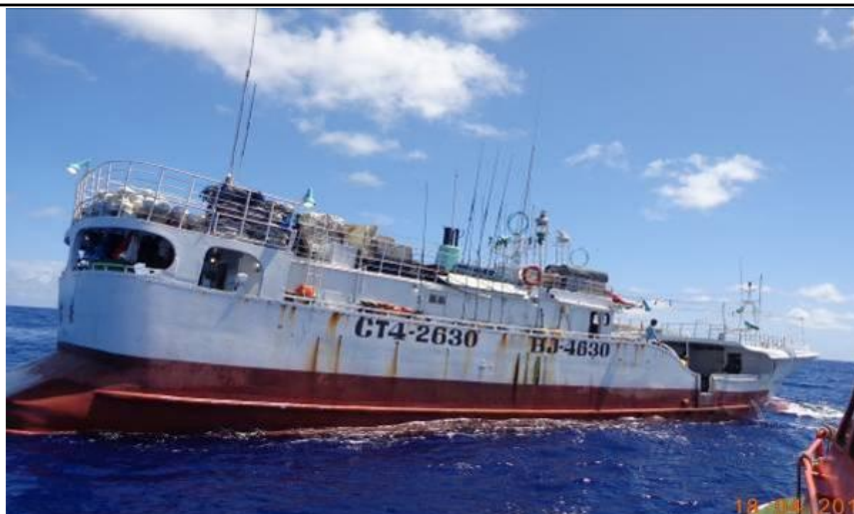
說明：106年4月18日慰問「富安16號漁船CT4-2630」、國際呼號：BJ4630。