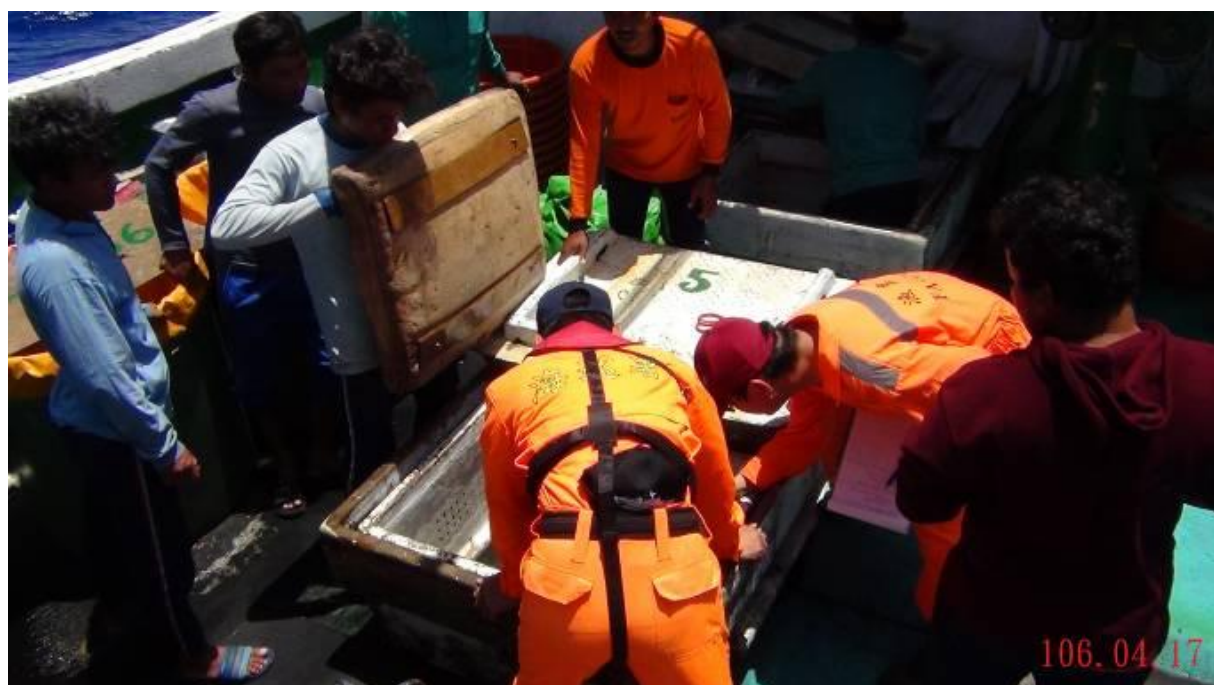
說明：漁業署檢察員及海巡署人員檢查漁船。