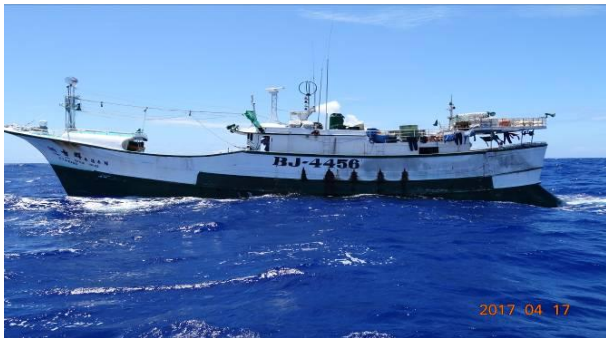
說明：106 年 4 月 17 日慰問「新吉祥 33 號漁船 CT4-2456」、國際呼號：BJ4456。