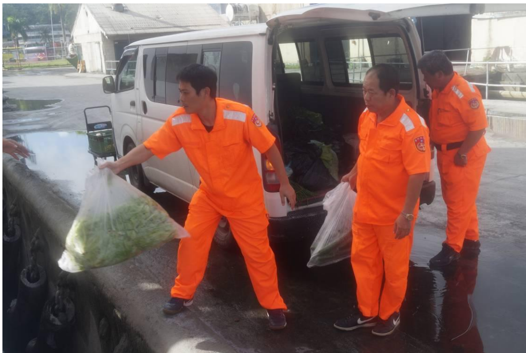
說明：106年5月11~17日整補。(伙食)