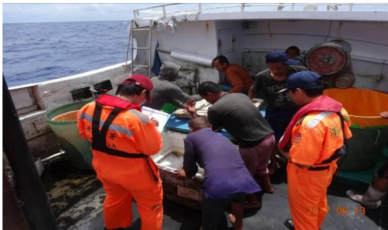
說明：漁業署檢察員及海巡署人員檢查漁船。