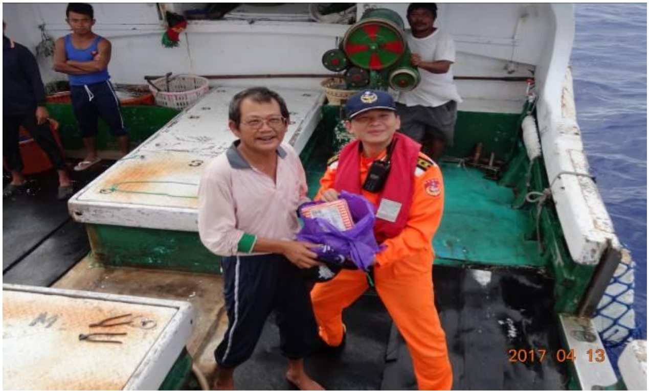
說明：帶隊官致贈慰問品。