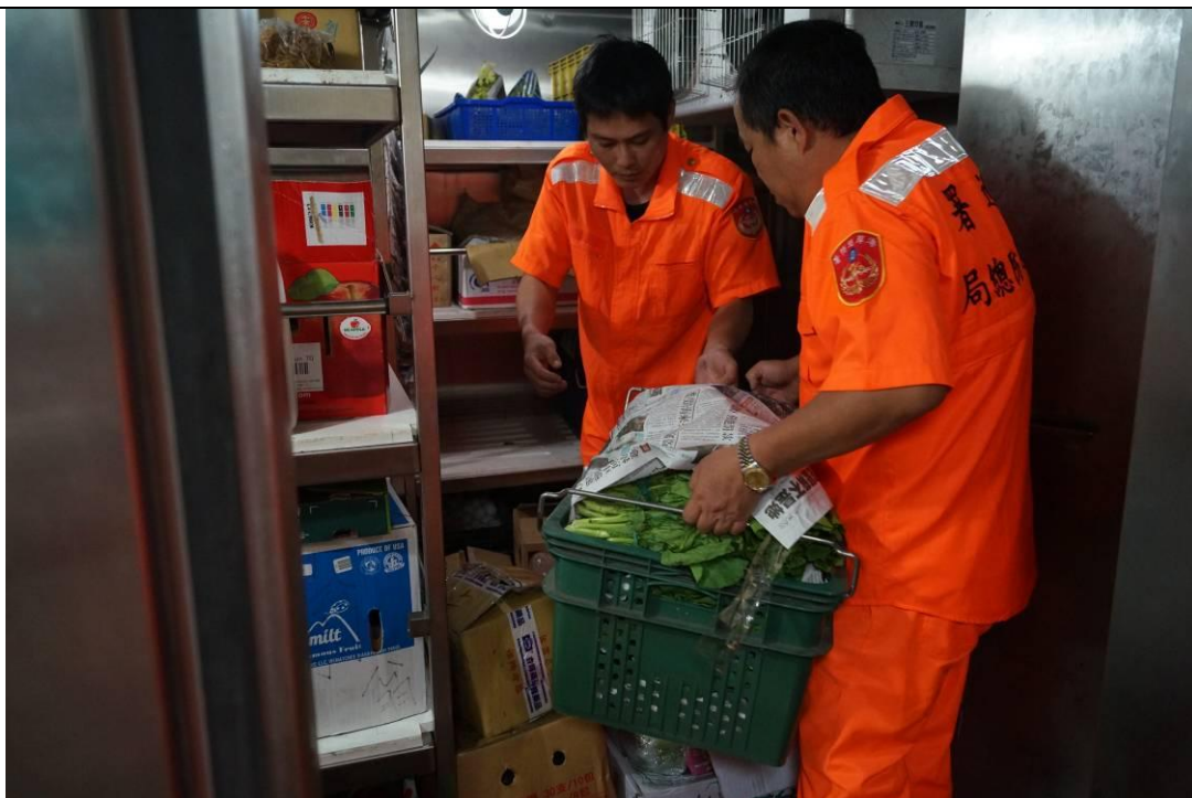
說明：106年5月11~17日整補。(伙食)