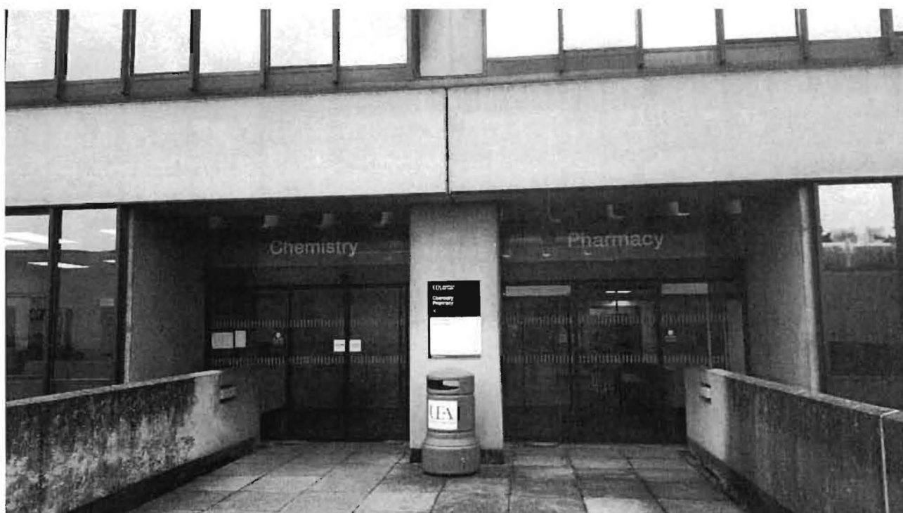
英國諾李奇UEA大學藥理學院

個人於此研習期間，獲得學校與國防部軍醫局的協助，以及英方研究夥伴的指導與幫忙，讓我們的雙方研究交流計畫順里完成，期望未來除在慢性腎臟病之疾病之成因及相關致病機制有所進階的貢獻外，亦希望能有機會朝向藥物開發的研究前進。