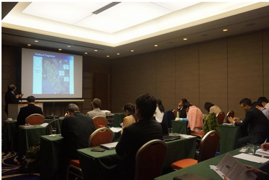
圖 9 2017 第二屆亞洲環境及永續發展研討會（ACESD 2017）