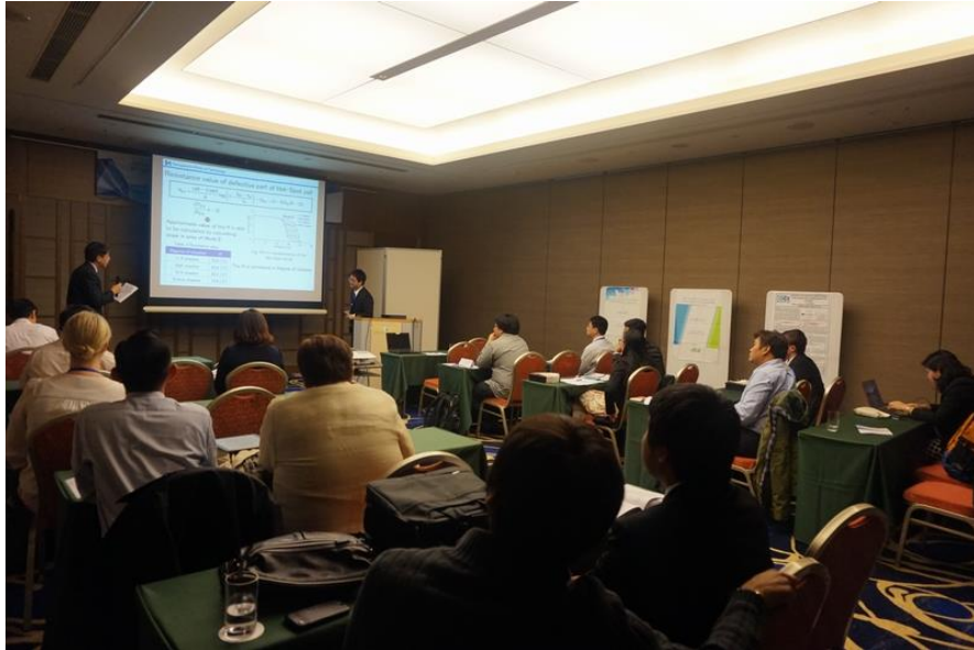
圖 8 2017 第二屆新能源及應用國際研討會（ICNEA 2017）

本次論文發表分為環境永續發展及能源兩大主軸，各自分為三大主題，為了盡可能聽到六大主題的論文發表，故由營建組張家明技正參與能源相關論文發表會議，會場如圖 8 所示；環安組鄭敦仁技士參與環境永續發展論文發表會議，會場如圖 9 所示。