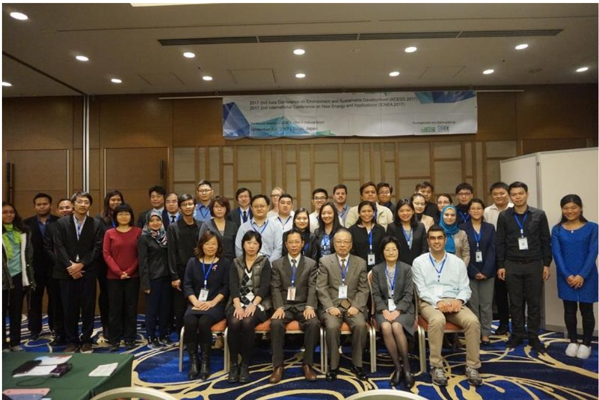
圖 5 研討會與會人員合照