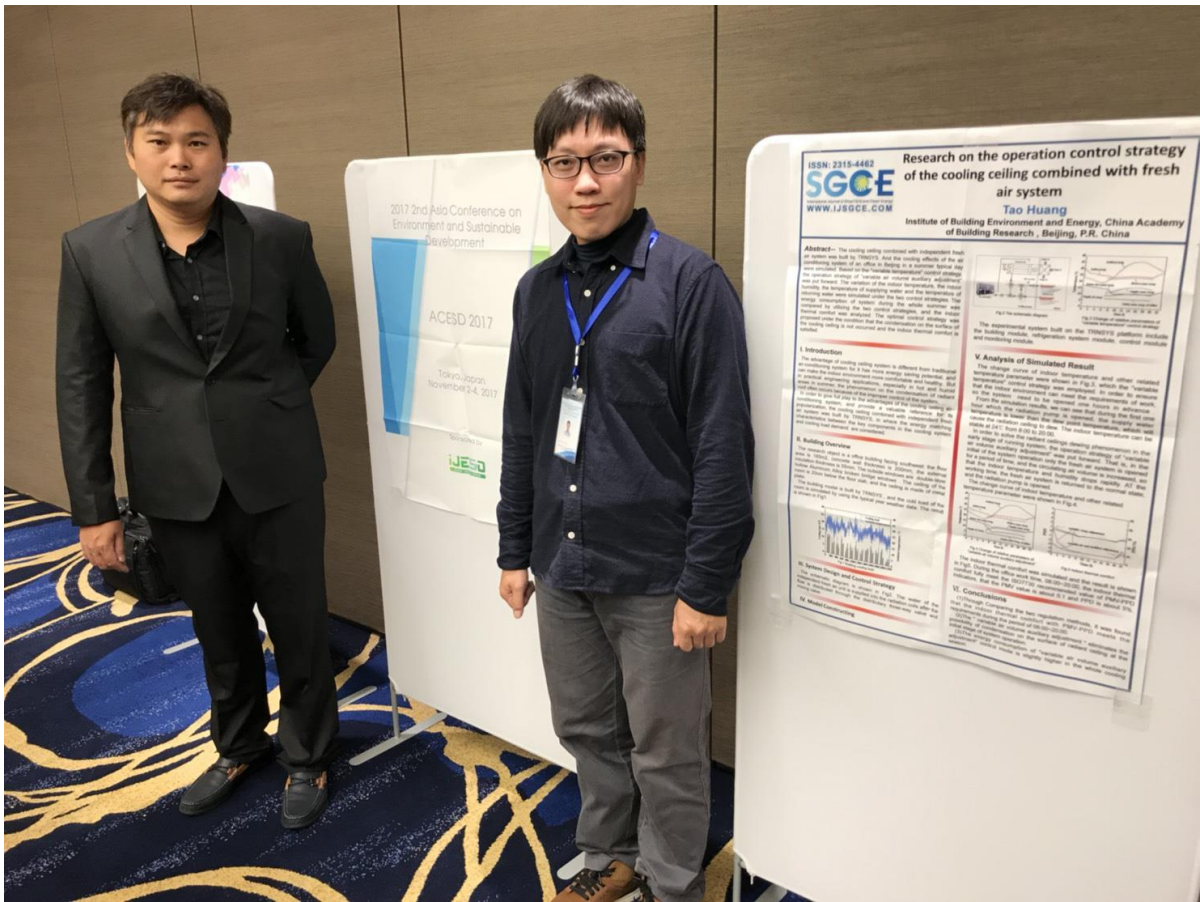
圖 4 參與研討會成員