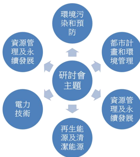
圖 3 研討會論文發表主題