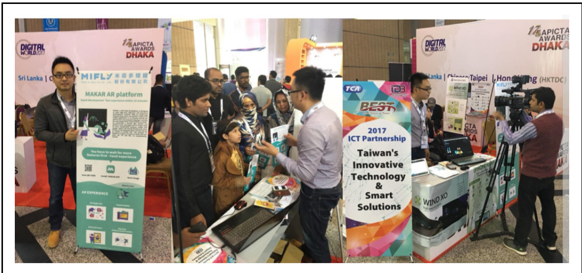
▲台灣廠商專區展況熱絡