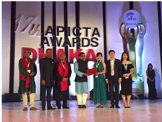
▲數位學習組(e-Learning)銀牌-宥瑜股份有限公司