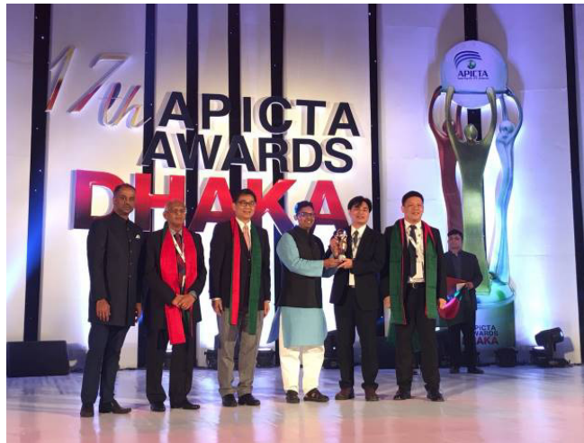
▲健康保健組(Health & Wellbeing)金牌-太暘科技國際股份有限公司