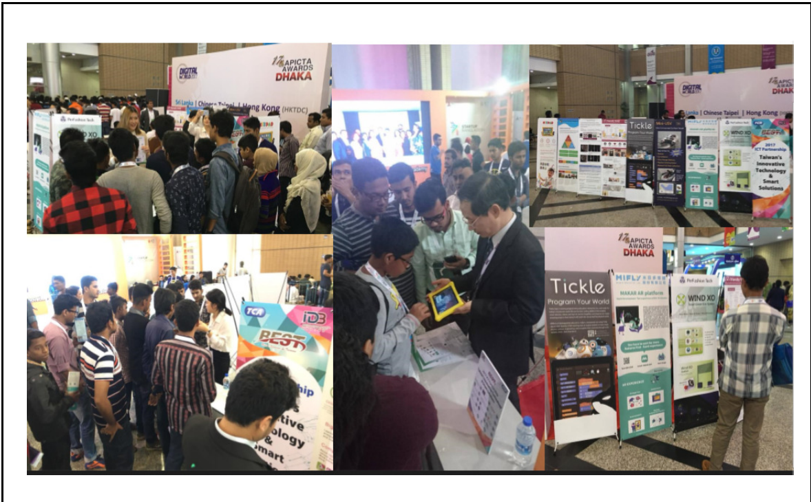
▲台灣廠商專區展況熱絡-1