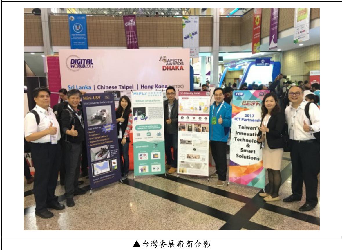
▲台灣參展廠商合影