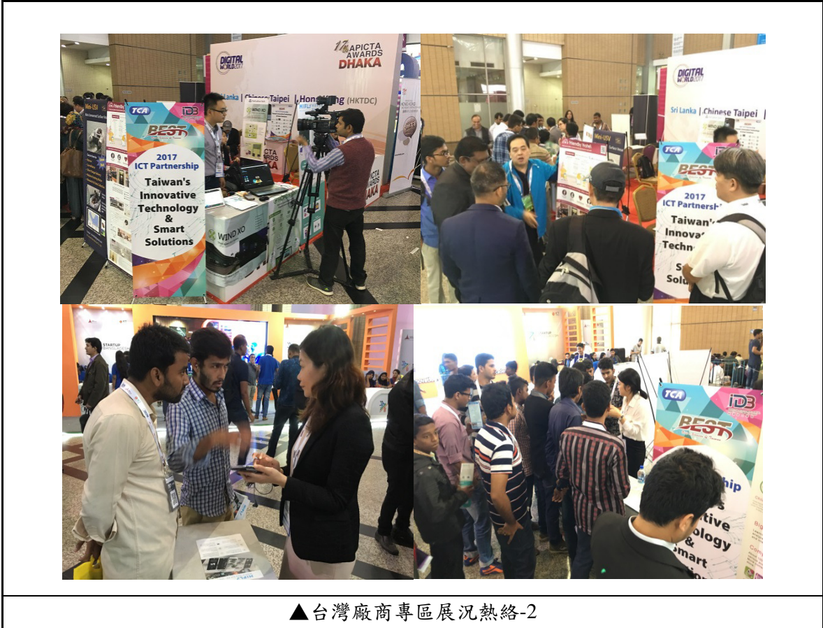
▲台灣廠商專區展況熱絡-2