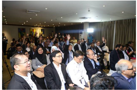
▲2017 APICTA Awards 評審委員共識會議