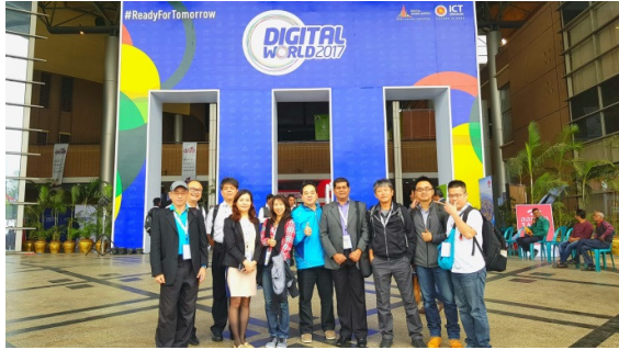
▲Digital World 2017 展會入口-團員合影