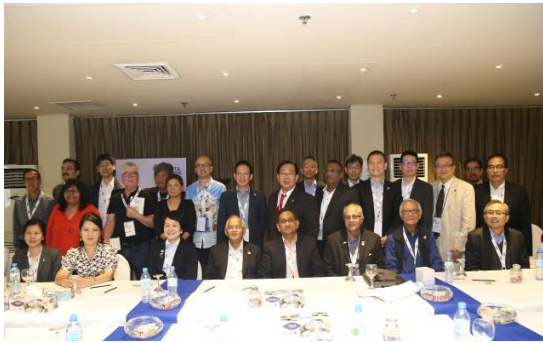
▲APICTA 第 56 次執行委員會議-執委合影