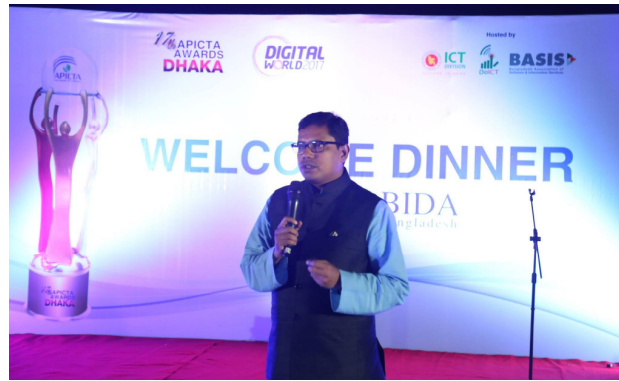
▲孟加拉通訊部部長