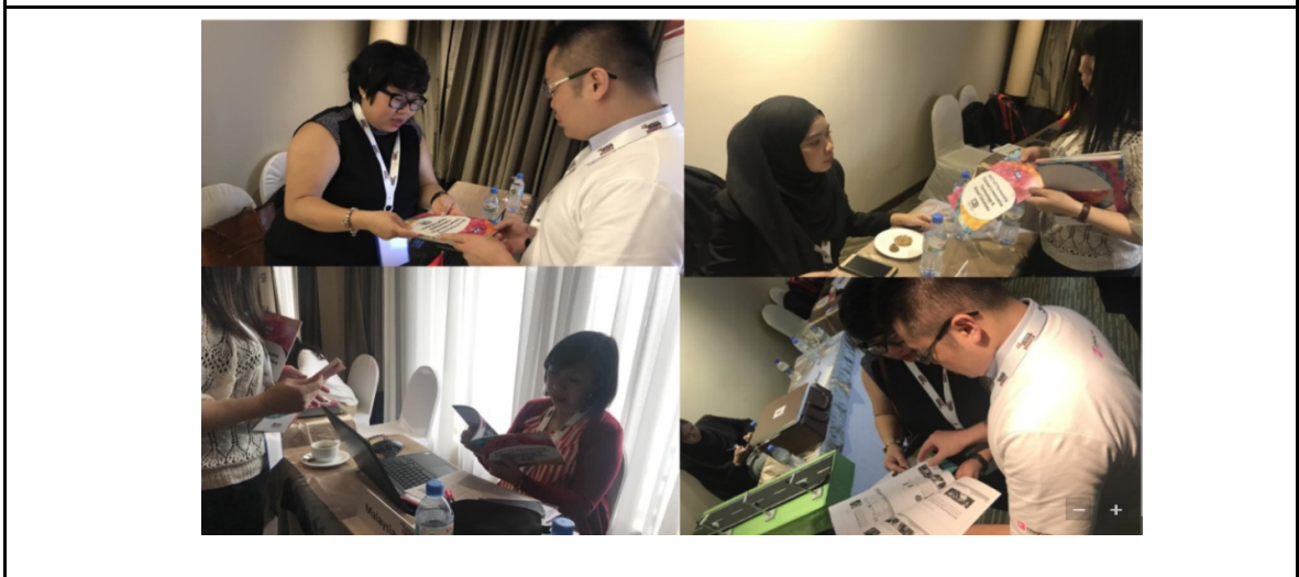
▲執行團隊工作同仁主動向各經濟體秘書辦公室提供台灣廠商之廣宣文件