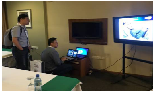
▲ 台灣代表隊參賽團隊設備測試