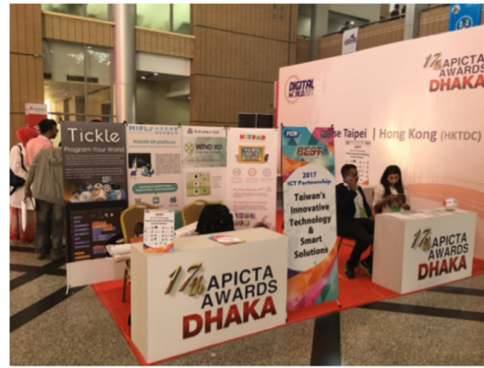
▲「臺灣資訊應用解決方案專區」