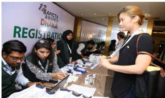
▲ 台灣代表隊報到領取證件與資料