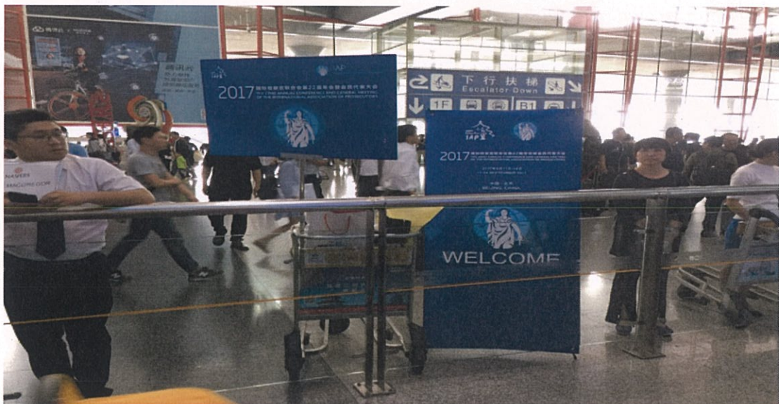
圖 9：北京機場內設置的 IAP 看板

為舉辦本次年會，北京市檢察機構幾乎是全體總動員：從事前的入口網站架設、填寫報名資訊及代訂旅館，到抵達機場後的指引、人員接待、車輛分派，乃至酒店的入住；事中的領取識別證及資料、車輛動線及引導人力的安排、聲光視覺的呈現、餐飲的規劃；事後的離境送別等，都可看出主辦單位的努力與用心。