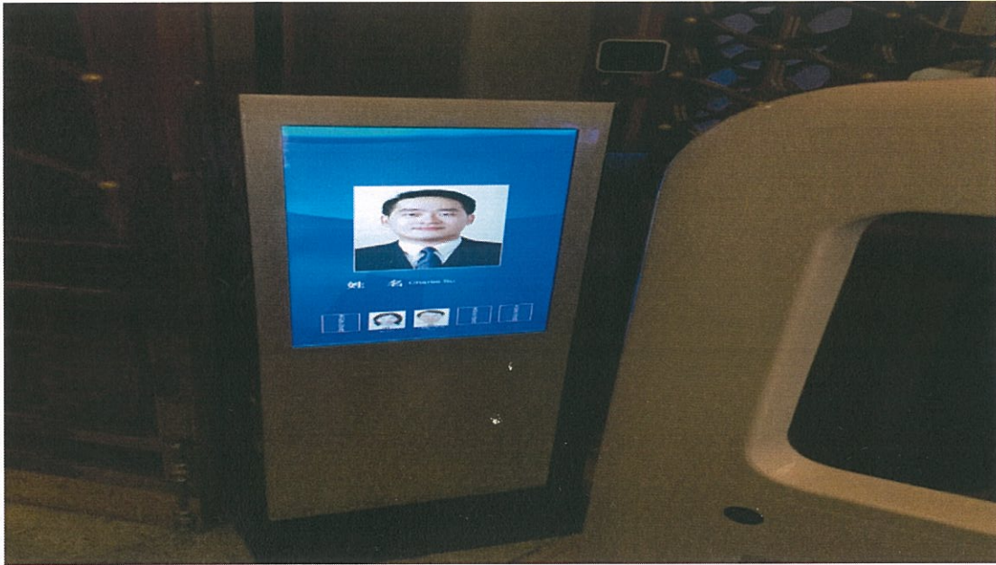
圖 10：識別證通過感應器後，螢幕上即會顯示佩帶人之資料照片，再由安全人員進行核對

過程中讓人印象最深的，莫過於維安的嚴謹。本次現場的安全檢查相當嚴格。除了比照機場的 X 光機、探測儀對手提行李及全身的安檢，進入各會議場地均須隨身配帶識別證，並有機器感應識別證，由安全人員就本人及顯示於安檢設備上之資料照片進行比對。而只要進出北京飯店，都要經過安檢，一旁則有荷槍實彈的武警站崗保護，看得出主辦單位對維安的重視。