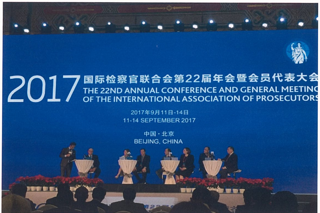
圖 6：司法互助諮商室成員於臺上進行綜合座談

在會議的最後一日，大會安排諮商室成員進行綜合座談，將會議期間彙整的爭議，自各個不同的面向，作比較完整的論述。如果此一諮商室賡續辦理，建議與會者前去走動走動，一方面經營人脈，另一方面也可獲取第一手的司法互助資料，或洽談相互合作的可能。