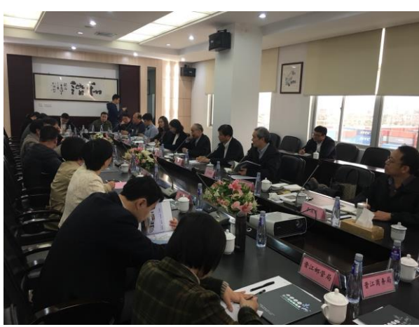
泉州晉江陸地港座談(106/12/13)