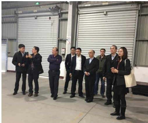
泉州晉江陸地港監管中心(106/12/13)