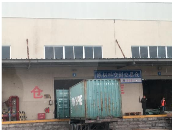
泉州晉江陸地港監管中心(106/12/13)