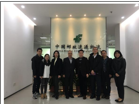
與中國郵政速遞公司合影(106/12/14)