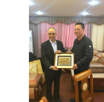
致贈泉州晉江陸地港紀念品 (106/12/13)