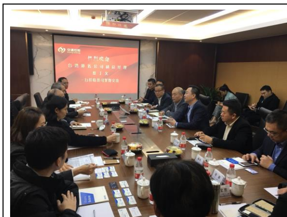
安通控股集團公司座談(106/12/13)

安通控股公司目前已申請兩岸直航航權，惟尚未獲得相關單位批准；該公司亦有海運快遞貨源，預計 106 年底先試幾票貨物，並再逐步爭取新航線，自行操作兩岸快件及跨境電商貨物。