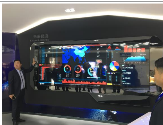
安通控股集團公司參訪 (106/12/13)