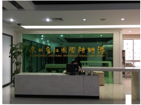
泉州晉江陸地港接待處(106/12/13)