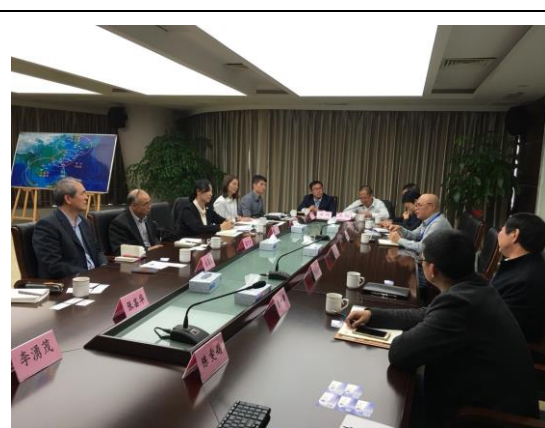
廈港集團和平旅運公司座談 (106/12/11)