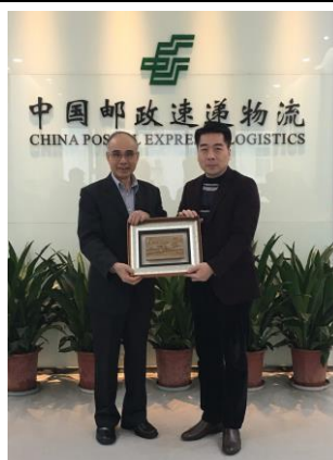
致贈中國郵政速遞紀念品(106/12/14)