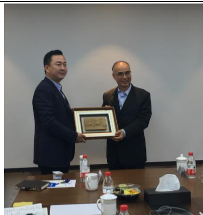
致贈安通控股集團公司紀念品 (106/12/13)