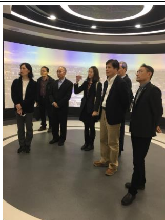
安通控股集團公司參訪 (106/12/13)