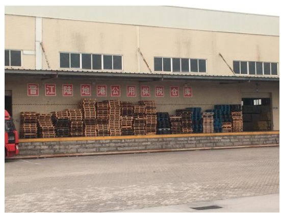
泉州晉江陸地港監管中心(106/12/13)