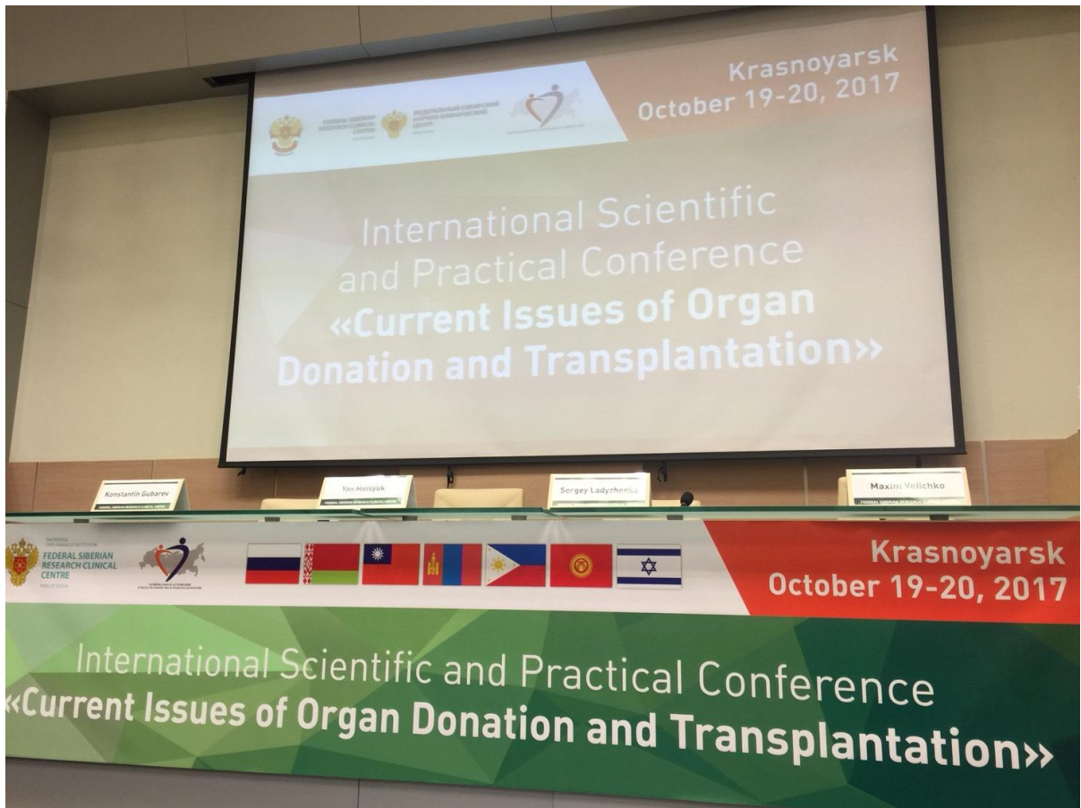
台灣與俄羅斯雖沒有外交關係，但在會議現場展示呈現我國國旗。