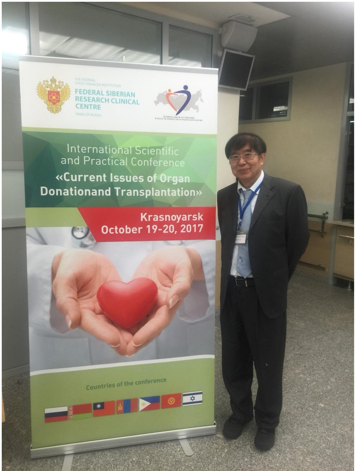
研討會外之海報布置，同樣有中華民國國旗。