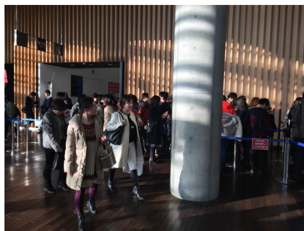
新美術館內參觀人潮