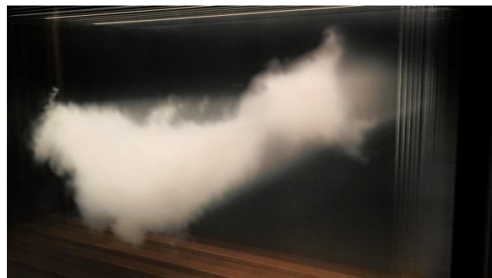
將數片玻璃疊成一朵雲

Leandro Erlich 擅長以空間設計玩弄人的視覺錯視，他曾創作過許多聞名世界的作品，例如日本金澤 21 世紀美術館的鎮館之寶〈泳池〉，以及以鏡子反射建築物外牆的大型裝置〈建物〉。本次在森美術館的個展中，多組作品均巧妙的建構出源自現實生活，但又不可能存在的空間；觀眾的視覺被欺騙，仿如置身夢境卻又如此真實。由於作品充滿巧思，且需要觀眾的積極介