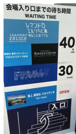
森美術館入口處等待時間公告版