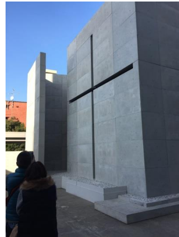
戶外光之教會展示作品