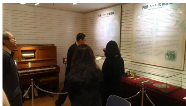
自動彈奏樂器音樂匣的展覽解說與實際操作