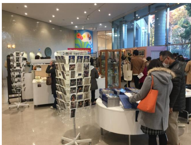
東京富士美術館精品店陳設

美術館內部還有知名的米其林三星餐廳、咖啡廳，以及品質高級的設計商店，因此觀眾可以來這邊同時享受用餐、購物與欣賞展覽的樂趣。而森美術館本身即位於商業大樓頂樓，樓下有百貨商場，樓上還有眺望台可一覽無遺欣賞東京市區風景，因此觀眾在六本木觀光時，往往將森美術館排入必訪景點之一。可見文化藝術結合商業、觀光，以多功能的方式維運，往往能有效提高觀眾興趣，吸引觀眾接觸藝術。