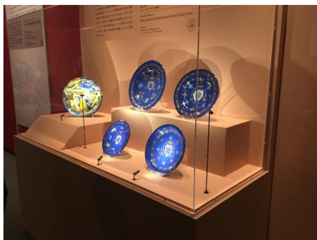
富士美術館器物作品陳列方式