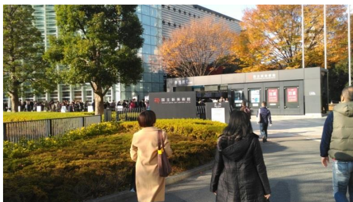
國立新美術館入口