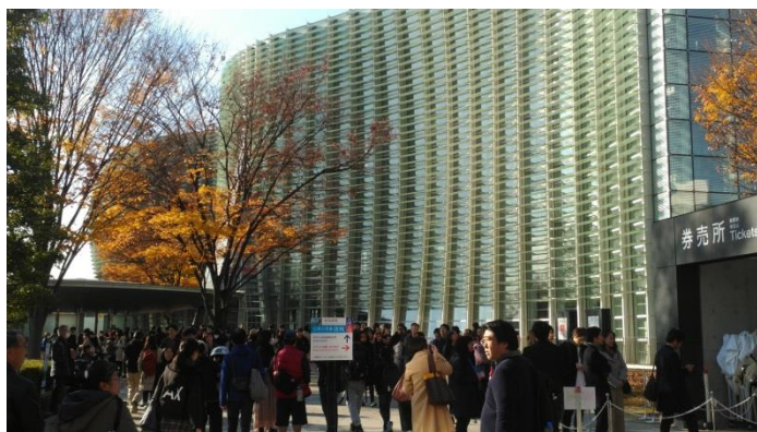
國立新美術館售票窗口人潮