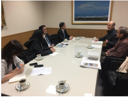
與富士美術館開會情形