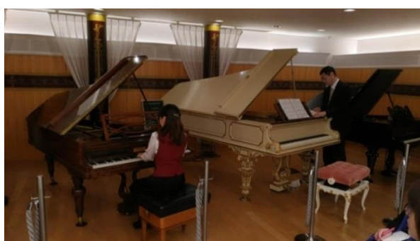
現場展覽鋼琴的演奏表演

民音館並非大型博物館，所以展覽與教育推廣的結合非常緊密。例如古典鋼琴展覽區，在現場排滿座椅，密集安排音樂同仁介紹並彈奏各式古典鋼琴。音樂匣區的展覽設計也如同古典鋼琴曲，讓參觀的民眾不但可以了解樂器的典故，同時享受一場音樂盛宴。