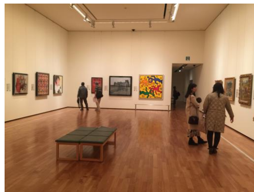
富士美術館展廳繪畫作品陳列方式