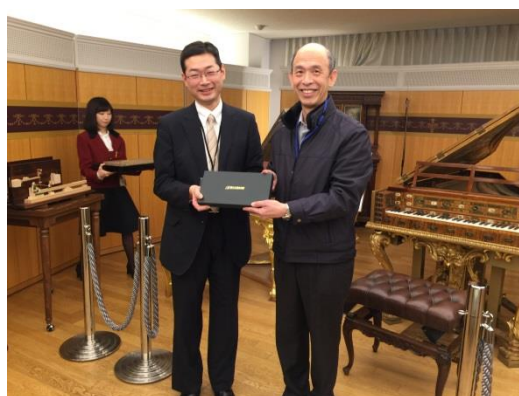
陳副館長致贈民音博物館國美館文創品