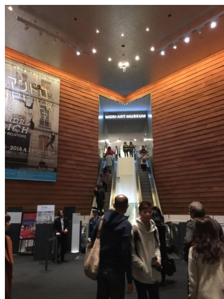
位於商業大樓樓上的森美術館入口