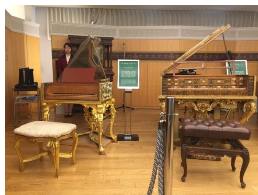
民音博物館鋼琴室，展示多架珍貴古典鋼琴