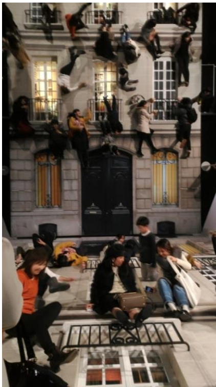
充滿創意之作品〈建物〉

入，因此這項展覽吸引相當多的參觀民眾，每組作品前幾乎都大排長龍，此外展場也開放拍照，可以想見展示維護需要投入許多人力與心力。森美術館因此安排多位工作人員，在排隊人龍較長的作品前，適時引導觀眾先參觀別的作品，以節省觀眾時間並疏散動線。不過，展場工作人員並未對觀眾與作品的互動進行干預，現場也未見博物館中常見的護欄或警示文字，或許一方面是因為本展作品原本即需要觀眾的參與，另一方面也是日本民眾的參觀習慣與禮儀，使展場雖人潮眾多仍能保持良好的秩序。