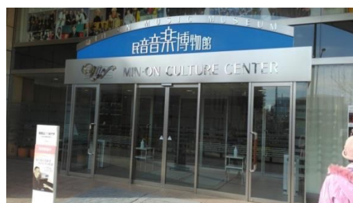
民音音樂博物館入口

Nozawa 接待並親自介紹，該館隸屬民主音樂協會，在 1963 年由國際創價學會（SGI）會長池田大作創辦，目的在於透過文化交流，推進民眾之間的相互理解。自 1965 年 1 月正式成為財團法人以來，民音逐漸發展為日本最具代表性的音樂文化團體之一。 11 1997 年 9 月成立「民音文化中心」，後於 2004 年 5 月改名「民音音樂博物館」（以下簡稱民音）。