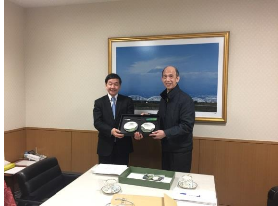
陳副館長致贈五木田館長國美館文創紀念品