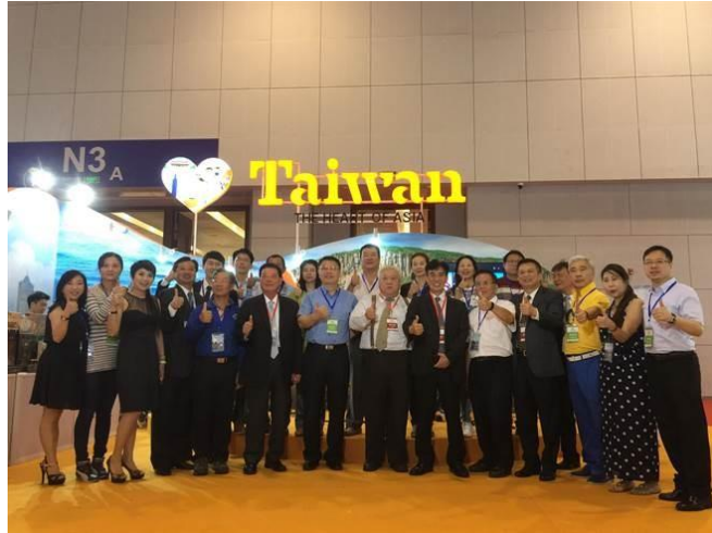
臺旅會北京辦事處 1 日參加「中國北方旅遊交易會」，推廣臺灣好山好水。

「2017 中國北方旅遊交易會」9 月 1 日至 4 日在天津市梅江會展中心舉辦，臺旅會北京辦事處為深耕此一重要客源地區，特結合中華兩岸旅行協會所組織的臺灣業界推廣團，再次參加此一年度盛會。