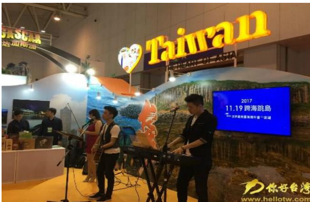
9月1日舉辦“臺灣旅遊推介會暨臺灣之夜晚宴”。