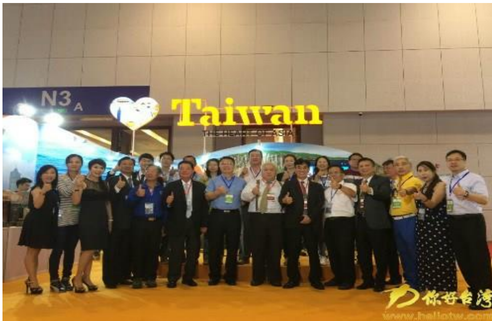
臺旅會持續參加一年一度的盛會。