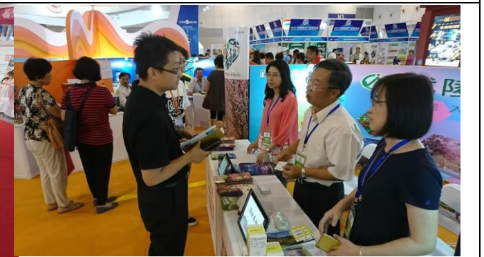
與當地旅行社業務交流