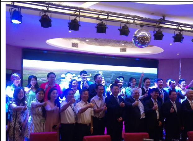
臺灣代表團於臺灣之夜合影