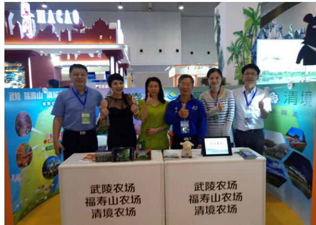
本會與三高山農場展位