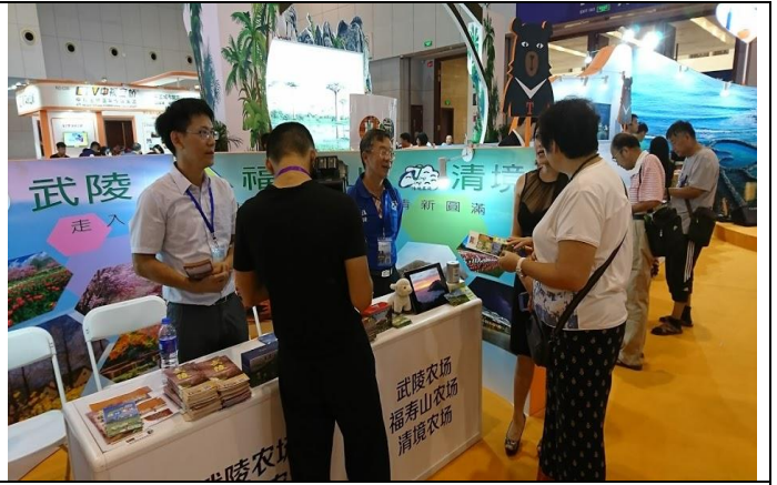
天津民眾詢問三高山農場旅遊資訊情形