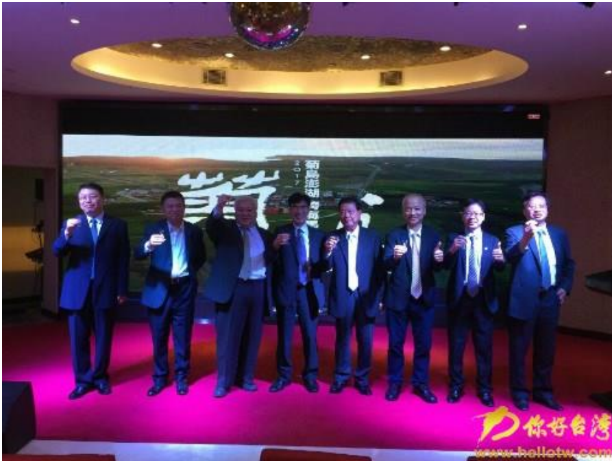
歡迎大陸遊客體驗“秋冬遊澎湖”和“菊島澎湖 跨海跳島馬拉松活動”。

你好臺灣網報導，9月1日-4日，“2017 中國大陸北方旅遊交易會”在天津市梅江會展中心舉辦，臺旅會北京辦事處攜“臺灣中華兩岸旅行協會”所組織的臺灣業界推廣團，再次參加一年一度的盛會。