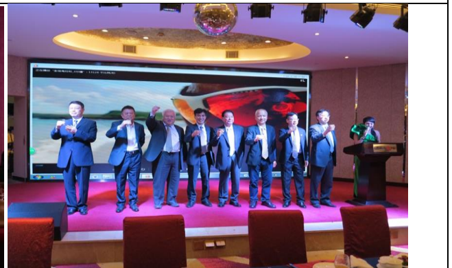
出席臺灣旅遊推介會暨臺灣之夜晚宴