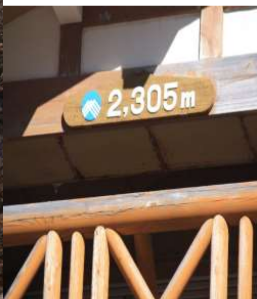
富士山五合目(五)標高 2305 公尺