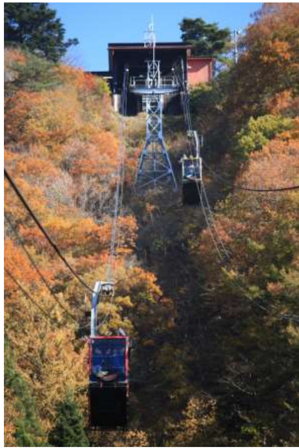
富士山河口湖登山纜車(一)