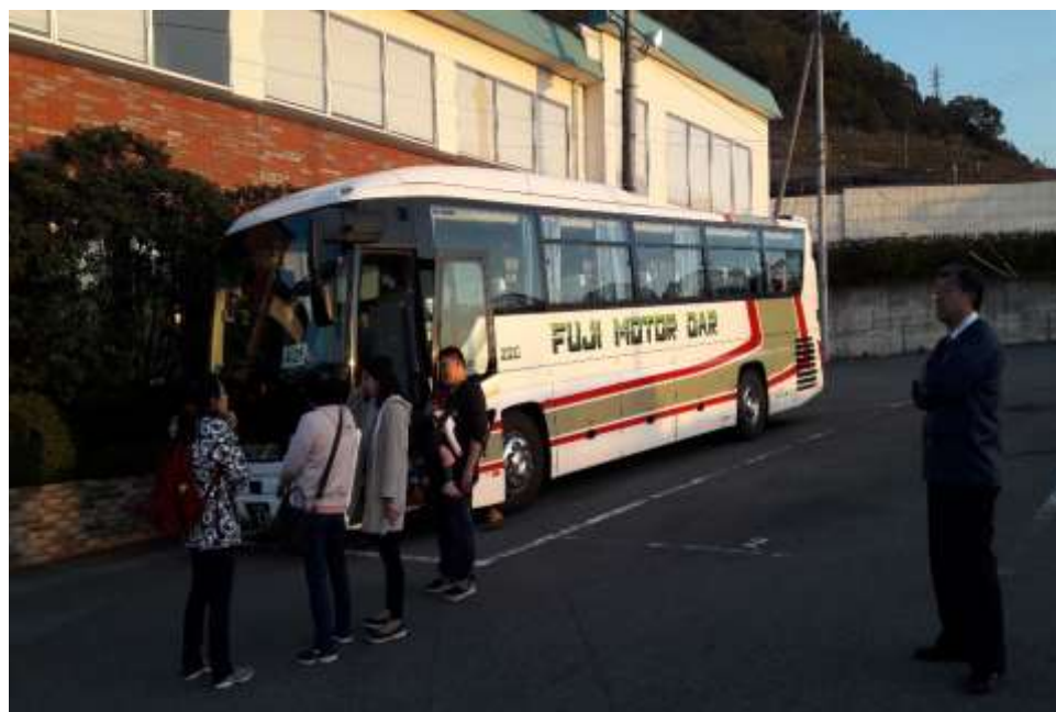
遊覽車車窗可動開啟 右立者為遊覽車駕駛