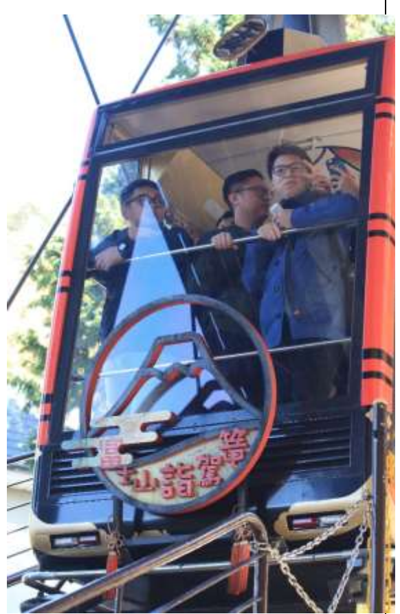
富士山河口湖登山纜車(二)