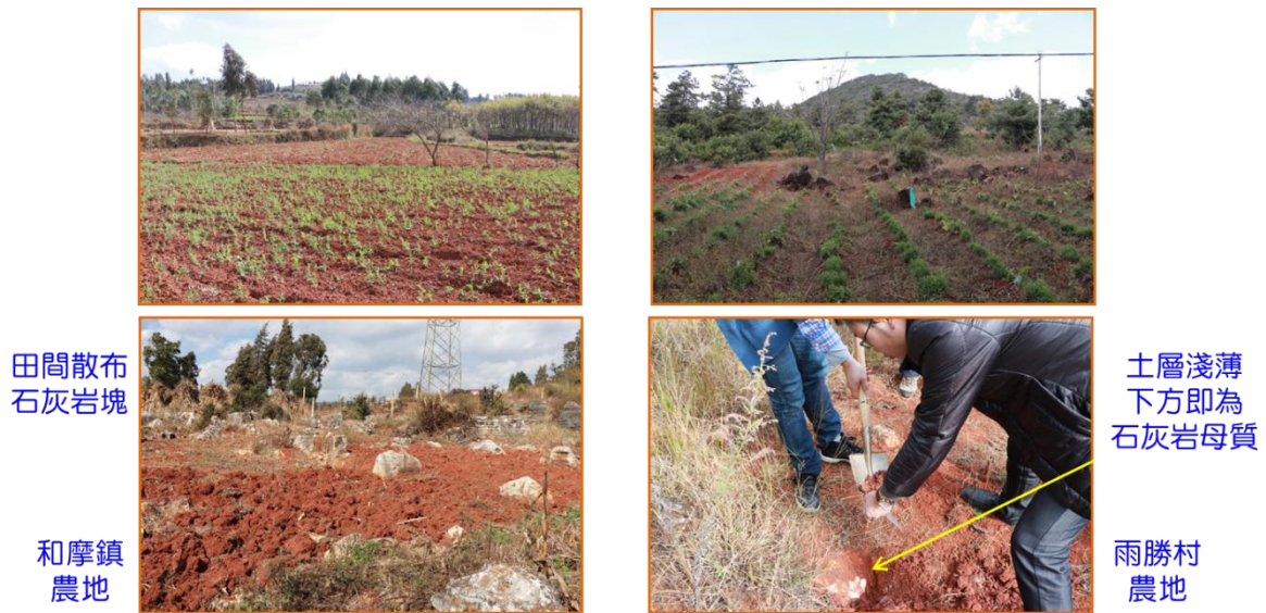
圖 11 林口鋪鉛鋅礦區現場環境與礦石土壤重金屬濃度

註：雲南省環境科學研究院提供，礦石樣品2樣品因濃度較高，XRF外推數據僅供參考；土壤樣品委託ALS澳實分析檢測（上海）有限公司採USEPA方法分析。