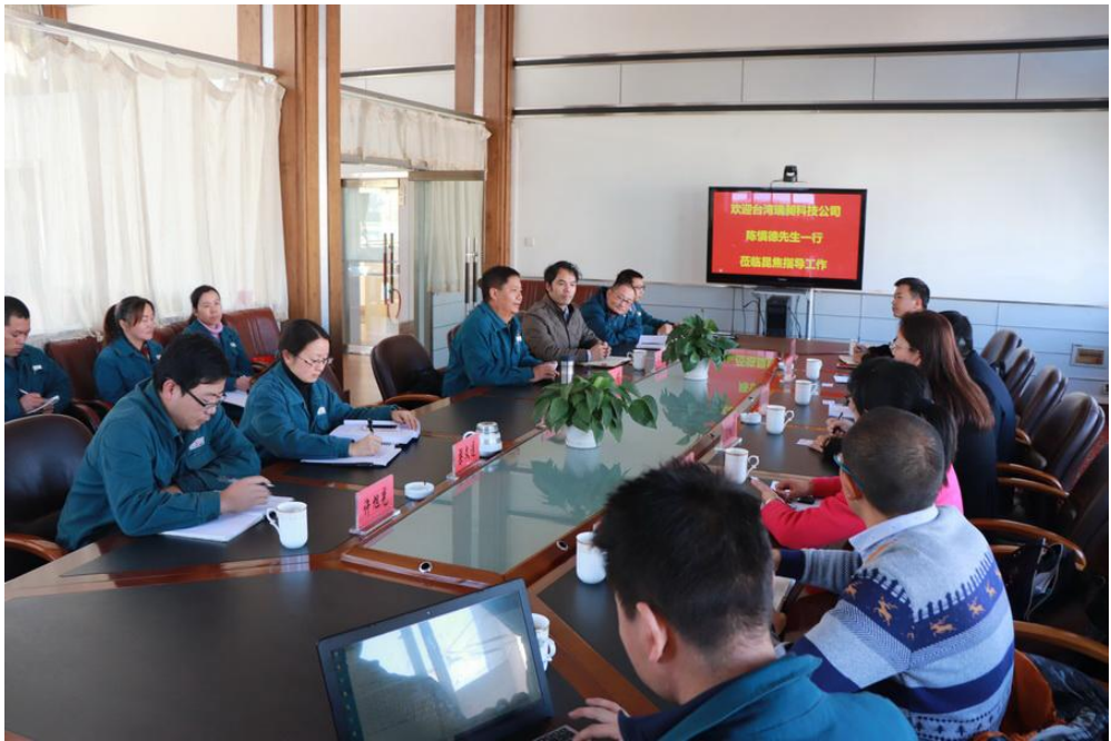
圖 4 昆明焦化製氣有限公司污染治理方式座談會