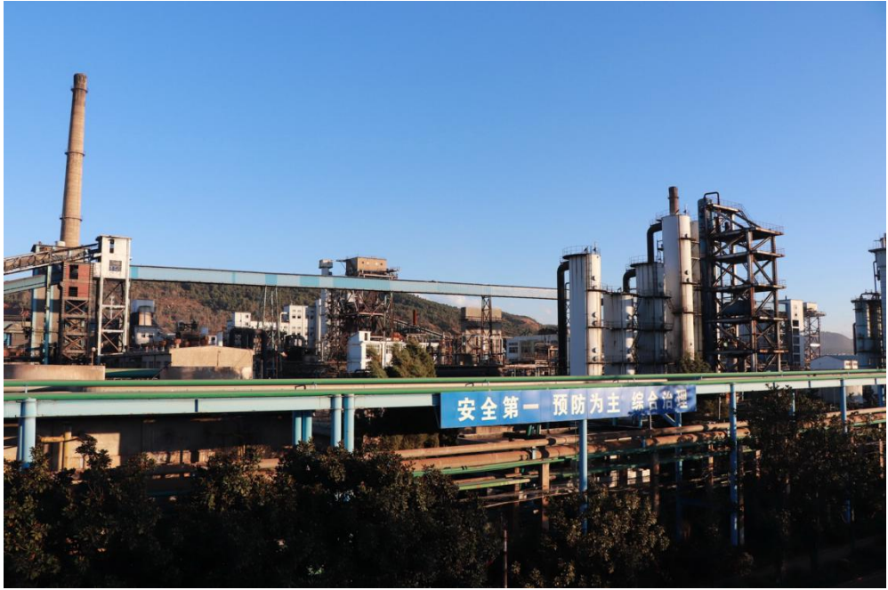
圖 3 昆明焦化製氣有限公司