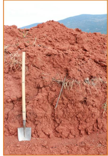
土壤剖面，下層土質黏重