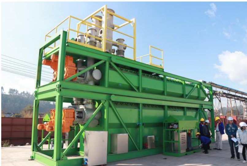
圖 6 雲南紅雲氣鹼公司汞污染物熱脫附處理設備