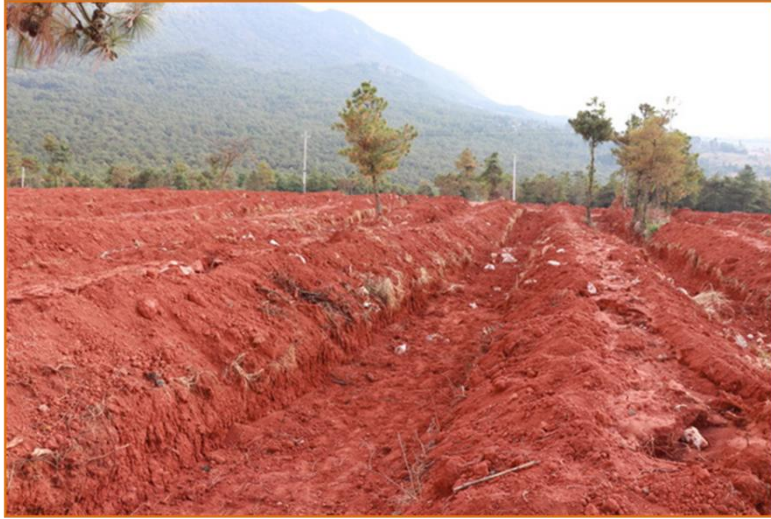
農民深開挖準備種植蘋果樹，土中散布石灰質母岩