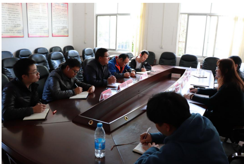
圖 9 石林-圭山高背景地區調查方式座談討論

本日下午石林縣環保局李副局長並親自帶隊前往研判土壤具較高背景濃度分布區域之林口鋪鉛鋅礦、和摩鎮農地、長湖鎮雨勝村農地、圭山蘋果園、圭山煤礦周邊農地等五處自然高背景土壤分布地點現勘及採樣，路程約 100 公里。