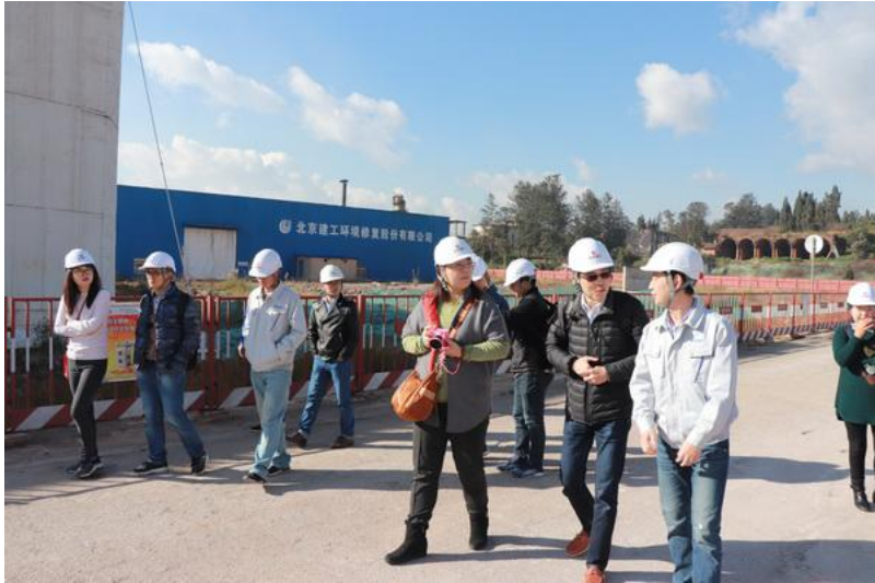
圖 5 雲南紅雲氣鹼有限公司污染場址參訪