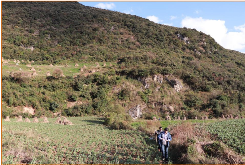
圖 13 圭山西側農地環境與土壤重金屬濃度

註：雲南省環境科學研究院提供，土壤樣品委託ALS澳實分析檢測（上海）有限公司分析，除汞以USEPA 7470A(Rev 1):1994(T)分析外，其他元素均以EPA 6020B Rev.2(2014)分析。