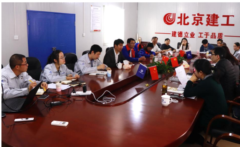
圖 7 雲南紅雲氣鹼公司污染治理座談會