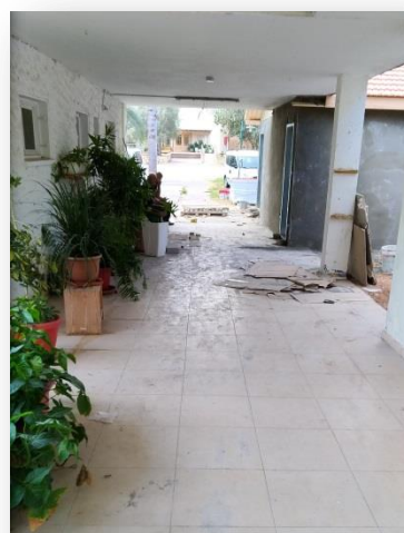
隨團導師宿舍廊道常可見散落一地的施工材料

本次會議過程所安排之食宿皆在 Hakfar HaYarok 校區，各國隨團導師都非常友善，交流過程愉快，也彼此交換了許多與會心得想法。在交談中過程中，可發現多數導師對於校方所安排的住宿並不甚滿意，主因係隨團導師們所居住的宿舍位於地下室，且建築本身正在整建當中，所以在廊道上常會見到施工塵土與廢棄的鐵釘等工具，早上施工人員的煙味更會飄入房間，加上夜間廊道常是全暗的狀態，造成女性隨團導師們常會感到憂心，由此可知硬體設備是參與活動的基本印象，容易影響與會人員之觀感，值得做為日後辦理相關活動參考。