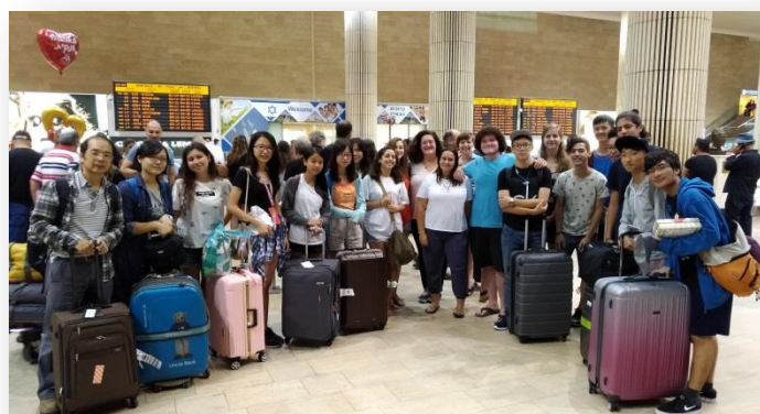
我國青年團與以色列寄宿家庭在機場相見歡

針對隨團導師部分，當日下榻於 Hakfar HaYarok 學校宿舍，晚上則由主辦校方安排各國的隨團導師共進晚餐、彼此熟識。今年赴