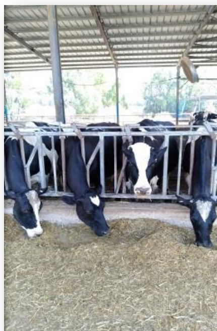
Hakfar Hayarok 校區內的乳牛飼養區