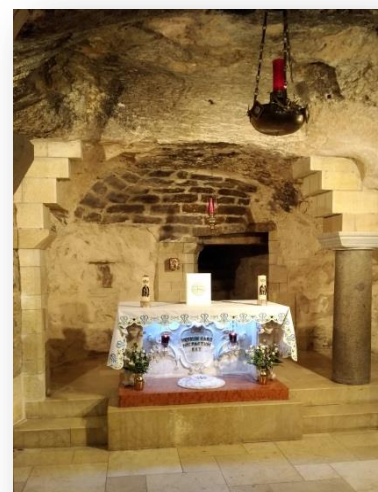
聖母瑪麗亞獲知喜訊時所居住的山洞

隔日參訪位於以色列北方的阿拉伯城市-那撒勒(Nazareth)，那撒勒本身即為一個著名的朝聖景點，目前約有七成的居民為伊斯蘭教徒，相傳耶穌基督誕生於伯利恆，青少年時期則於那撒勒度過，當地最著名的景點為「天使報喜教堂(Basilica of the Annunciation)」，意指聖母瑪莉亞獲知自己受孕的所在處。