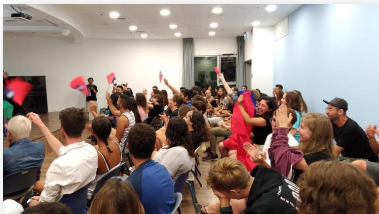
我國青年國情報告現場氣氛熱烈

在國情報告時段同時發生一段小插曲，雖然主辦單位在事前的通知信中註明國情報告不能超過 7 分鐘、8 張投影片，但各國報告幾乎都長達 20 分鐘以上，許多簡報都著重在國家介紹而未涉及水資源危機議題，保加利亞更另外撥放學校招生影片，相較下我國青年準備的報告則是剛好符合規定在 7 分鐘內，為了不要讓報告時間與其他國家相比過短，青年們在開場時即興用英文向各國說明了臺灣目前的國際地位及退出聯合國的歷史，無論是英文能力或對臺灣歷史的熟悉，都讓我感到十分佩服，而現場的確有許多外國青年都未曾聽聞臺灣，或不懂兩岸議題，荷蘭隨團導師也在會後向我表示，她一直到今天才知道兩岸間的差異，青年們的表現無疑是為我國做了最好的國際發聲。