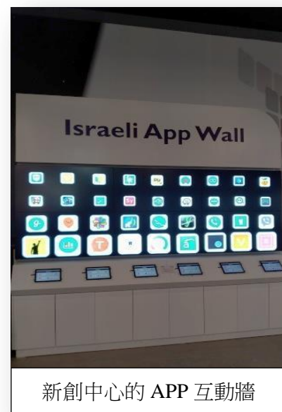
新創中心的 APP 互動牆

第二段參訪則是陳列出由以色列研發的著名應用程式(APP)，以色列技術在全球居領先地位，科技創新能力高，其發表的 APP 範疇除健康、交通、人際、遊戲等基本功能之外，更包括 3D 列印、醫療服務、空氣品質即時監測、臉部辨識科技等創新技術，現場並透過遊戲互動方式供大眾體驗，透過現代人人手一隻智慧型手機的情境，將科技與生活做出完美的結合，各國青年們都玩得不亦樂乎。