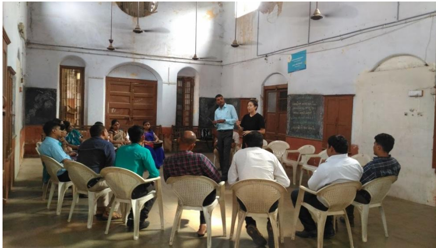
(Godhra 小學教師培力工作坊)

到了周末，台灣實習生們其實並不得閒，為了連結更多台灣與印度的教育合作可能性與中小學校網絡，透過河濱學校以及雅美達巴德市友人的介紹，我們前往市郊資源匱乏的 Godhra 小學進行參訪、並因應對方的要求，提供該校教師培力工作坊，與當地教學和行政團隊，透過體驗教育的課程設計與技巧，一同發想班級經營願景和實踐願景的具體方法。