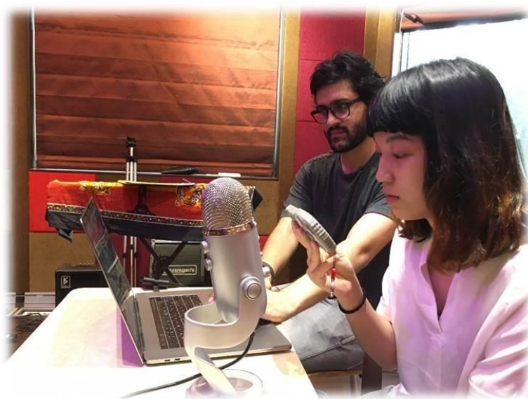
(台灣實習生們協助河濱學校的 Design for Change - DFC 計畫)