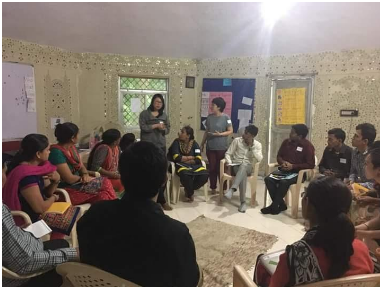
(報告者和台灣實習生們提供 Shanti Niketan English School 家長座談與教師增能活動)

最後一週對實習生們而言是豐收期、也是離情依依的時期。受到河濱學校的肯定，我們一方面持續參與校內外教學活動，另一方面台灣師生也獲邀至河濱學校的姊妹校，和印度當地教師們進行深入的教學分享。第一所學校是 Shanti Niketan English School-SNES，台灣師生團隊運用一整天時間在該校進行家長座談與教師增能活動。前者，我們分享了台灣的 107 課綱與世界教育改革浪潮；後者，我們運用體驗教育的課程設計與技巧，與該校創辦人、行政團隊、全校教師一同發想班級經營願景和實踐願景的具體方法。