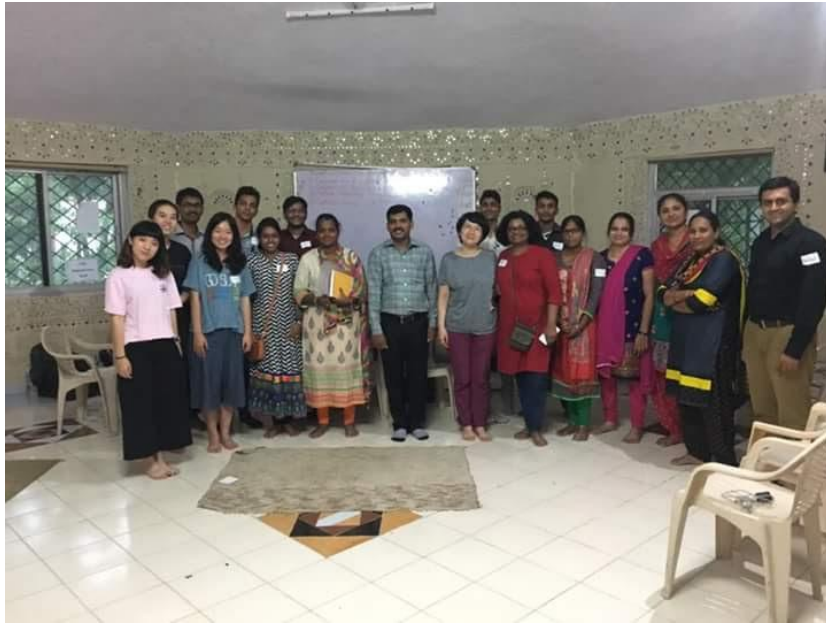
(報告者和台灣實習生們與 Shanti Niketan English School 全校教師合影)

在離開印度之前，我們來到河濱引薦的第二所學校 Kshitij Vidhya Kendra English Primary School。此次擬分享和運用設計思考的方法論與技巧，與該校創辦人和教師們一同解決學校經營的問題與願景擘劃。值得一提的是，Kshitij Vidhya Kendra 雖是小校，但教師們學習動機強烈；進行設計思考教師培訓工作坊期間，再度適逢暴雨，導致我們前往學校的道路中斷、受雨阻塞。台灣師生團隊臨危不亂，和該校創辦人取得聯繫後，緊急將培訓地點改至學校一位教師府上，環境雖然相對克難和出乎意外，但經此一事，可觀察台灣實習生們的彈性與堅持，令本人感動和欣慰。於此同時，也十分感謝實習單位河濱學校和雅美達巴德市友人的安排與協助，使台灣實習生們不僅有許多磨練教學實踐的功力和經驗，同時獲得服務弱勢與分享知識的機會，更在文化理解與跨文化溝通上累積更多的經驗、建立深厚的台印合作情誼。