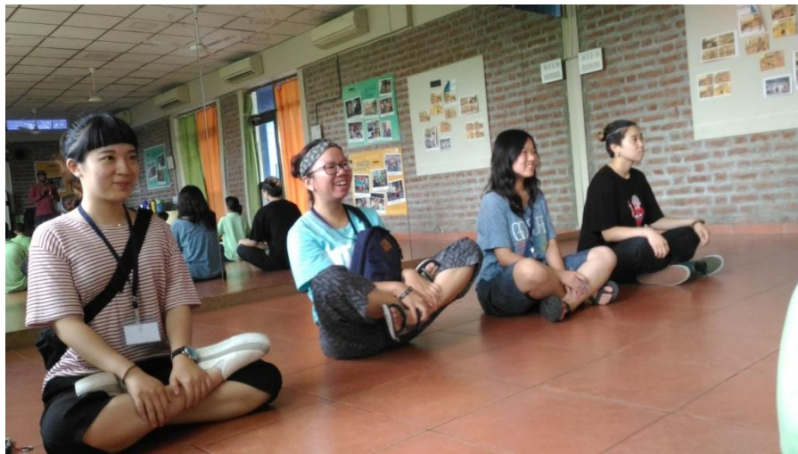
(台灣實習生們於河濱學校觀課)