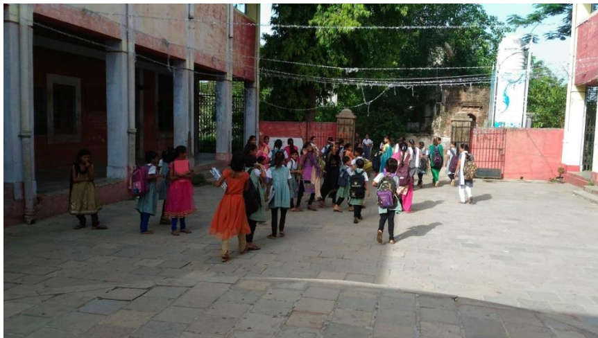
(Godhra 小學的學童們放學，離情依依揮手)