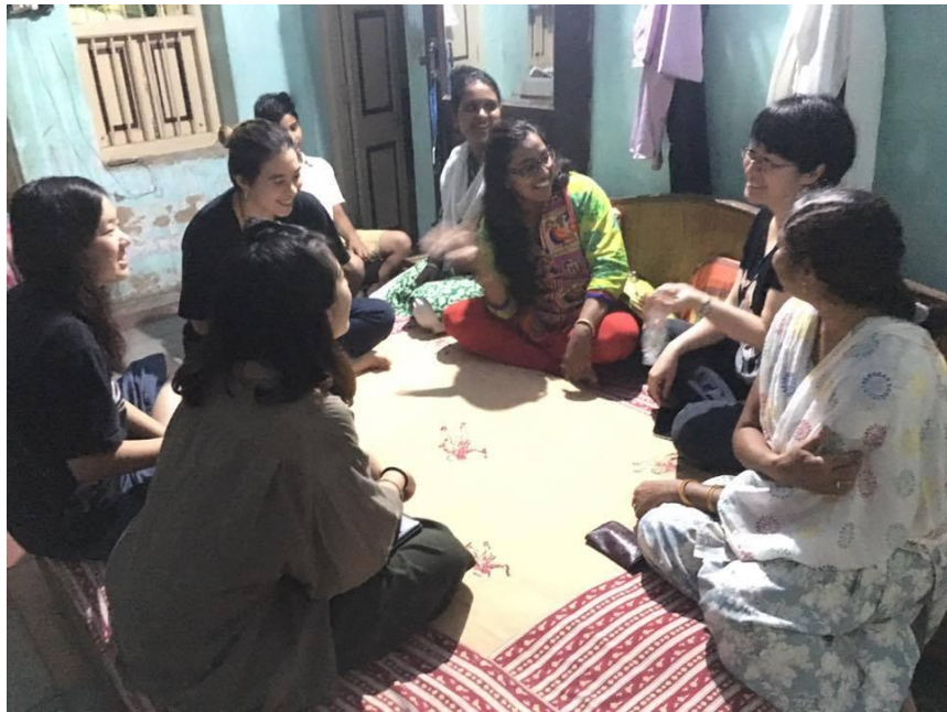
(Kshitij Vidhya Kendra 小學教師培力工作坊)