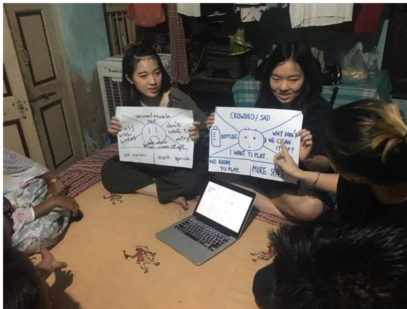
(報告者與台灣實習生們提供 Kshitij Vidhya Kendra 小學教師培力工作坊)