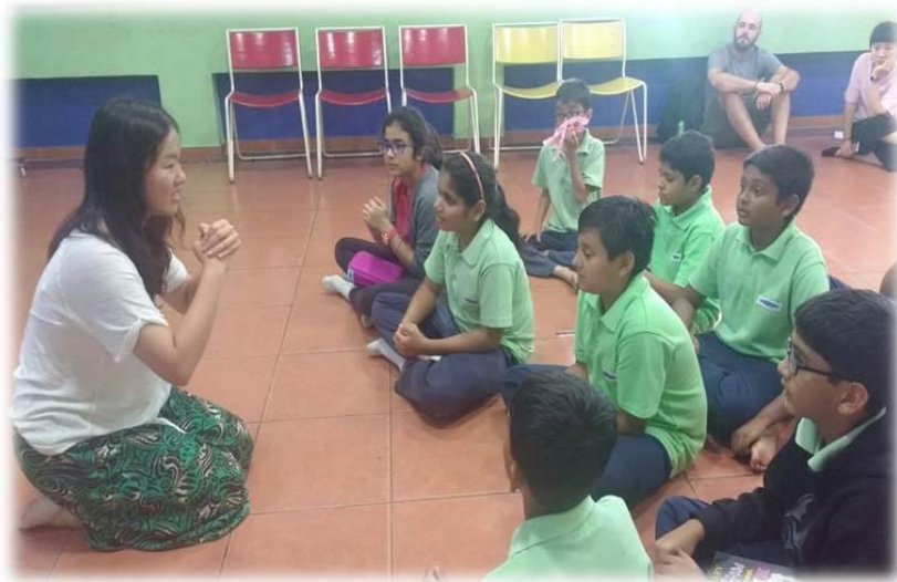
(台灣實習生在河濱學校進行教學)

實習生們這週已深入河濱學校的日常，除了參加河濱學校安排的大量教師增能工作坊，也開始和河濱學校的老師們進行課程共備、承擔部分的教學和班級經營責任。分別在河濱學校六年級和七年級的班級上進行教學演示。白天河濱學校老師給予回饋意見，讓台灣實習生們獲益許多；傍晚實習生們回到下榻旅館處，與本人進行反思會議，一同梳理教學實踐現場的行動策略與挑戰。