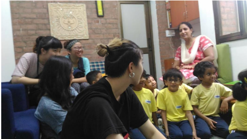
(台灣實習生們於河濱學校觀課)