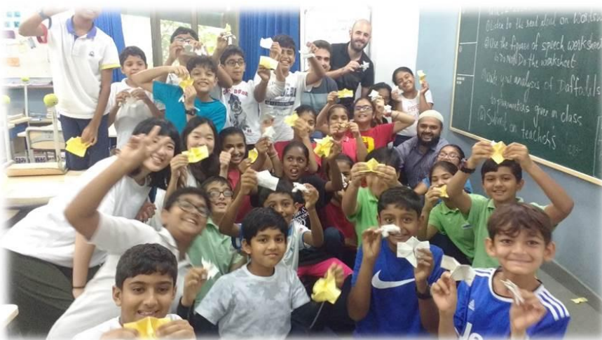
(台灣實習生在河濱學校進行教學)