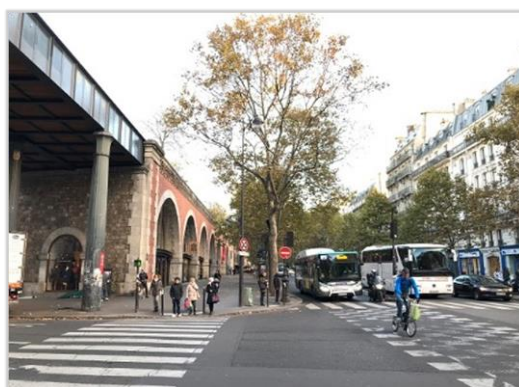
■ 鋼架橋上為民眾休憩的植栽步道，橋下則是文化藝術工作者的園地。

「藝術高架橋文創園區」（Le viaduc des arts）由「巴黎史特拉斯堡」私有鐵路公司於1853年所興建，是一鋼筋水泥多拱頂的鋼架橋建築體，用以通向巴士底廣場。1988年退役之後，由建築師Patrick Berger規劃設計，將橋上原屬於鐵路軌道部分改建為種植各類植物的散步走道，至於橋下的拱頂則開放給藝術家使用，1994年首度開放第一個整修後的拱頂，1997年最後一個拱頂整修也完