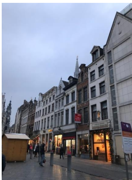
■比利時的法語區、荷語區、德語區有各有自主的文化政策。

比利時與其他國家一樣，也存在著經濟和環境及文化之間衝突，需要綜合考量各種因素，但在溝通過程中當也不乏有雙贏的案例。以法語文化體執行文化政策評估為例，很重要的是與人民及利害關係人之間的關係，因此充足的時間下的充份溝通及後續追蹤觀察是重要關鍵，尤其在溝通無共識時，則會利用由利害關係人身旁的人開始，逐漸促成大家共同討論的氛圍，除對個人外，整個遊說的過程，也會找各個相關領域的專家學者來參與對話。