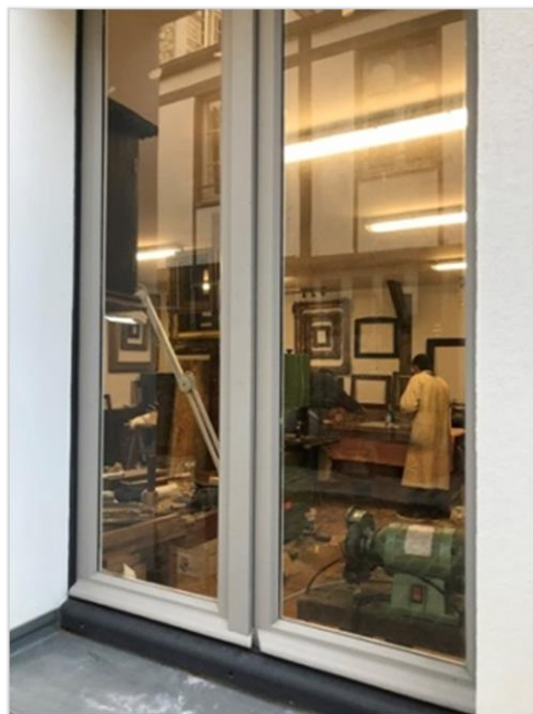
■ 巴黎市政府為藝術家及工藝師提供安心創作的空間。