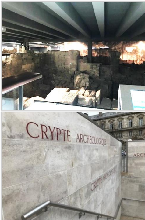
■ 遺址不僅受到完善的保存，而民眾也能透過數位投影回顧當時的樣貌。

位於巴黎聖母院前院正下方的地下考史室，自2013年後成為巴黎市博物館 (LES MUSÉES DE LA VILLE DE PARIS / CITY OF PARIS MUSEUMS 4 ) 第12個成員。目前遺址是在1965-1972年間挖掘出土，呈現了巴黎中心西提島上由羅馬高盧時代 (gallo-romaine) 至20世紀間演進的歷史。可看見盧泰西亞城鎮 5 碼頭的牆、公共澡堂；也可看到中世紀的遺址，比如成立於651年，巴黎最早的醫院 Hôtel-Dieu 的地下室、古道路旁房舍的基地；18世紀的遺跡則有孤兒院的基地，或是19世紀巴黎改造 6 的遺跡；現場以VR投影，搭配考古遺址，讓參觀者更能身歷其境，感受各個時代的不同樣貌。