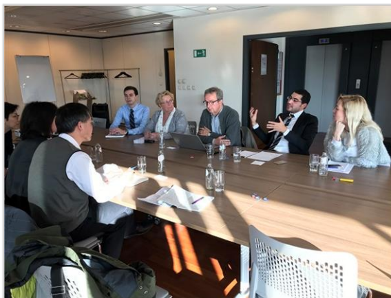
■比利時多元文化的社會更需要由下而上的溝通對話。

比利時是一個多元文化社會，從七零年代開始分為法語區、荷語區、德語區，各區各自有獨立的政策，並且有許多因應此類情況而設立的機構，每個語區有各自的政策和行政制度，同時聯邦下的機構都是各自獨立，因此，比利時每個語區各有自己的文化部門。