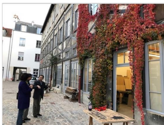
■文化資產活化利用，更需要有足夠時間審慎事前研究與作業。

Le cour de l'industrie位於位於巴黎市第11區Faubourg Saint-Antoine區域的心臟地帶，是19世紀第一批工業庭院之一，共有8棟建築物、3個庭院、總面積6000平方公尺，過去曾有數代與木材相關的工藝師（木工、木工藝家、漆匠）在此工作及住宿。2003年巴黎市政府將其買回，並在2008年與Semaest公司簽訂40年的協議書，請該公司進行再造工程及