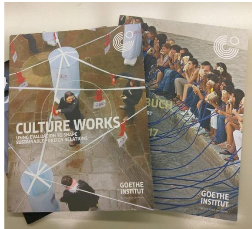
■歌德學院透過平等對話，與當地人民建立文化交流與互信關係，推廣德國文化。

歌德學院善於運用德國豐富的無形文化資產，藉由與駐在國文化關係的建構，來達成文化外交的目的。例如，該學院針對阿拉伯國家兒童推廣的德語童書翻譯，並非片面從德國文化觀點為標準選擇要翻譯的文本，而是由阿拉伯社會在地傳統文化視角，結合當地文化與心理學等各領域專家，針對兒童心理及當地文化進行評估後，才決定那些童書適合那些年齡的孩子，翻譯成當地語言後發送出去。另一方面，歌德學院亦結合密集的海外據點優勢，在網路世界透過官網、臉書、推特，運用多達六十餘種在地語言的網路社群，推廣德國文化。