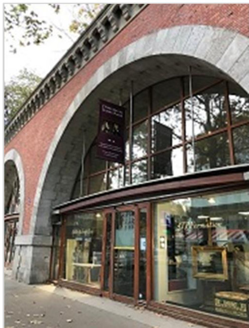
■拱頂下租給藝術家、工藝師及設計者作為工坊、展示及販售的空間。

工。目前64個拱頂全數開放給52個藝術家、工藝師及設計者等租用作為工坊、展示及販售的空間，其中11個被認證為Entreprise du Patrimoine Vivant（EPV認證） 3 ，甚至有1個是青年創作者租用的。