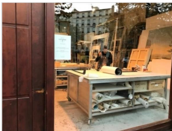
■文化藝術工作者能以合理價格承租工作室，開放的櫥窗讓民眾有親近藝術的機會。