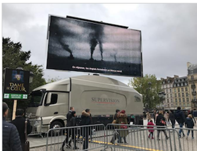
■法國藉由徵稅投入電影創作與產業發展。

法國於1948年開徵電影稅，重建法國電影院，針對美國強勢的電影片，法國政府補助片商拍攝同類型電影，讓法國民眾有多元的作品可選擇，在電視尚未普及的1950年，法國平均每人每年看10部電影。隨電視產業發展，1980年代法國課徵電視節目稅，並要求電視頻道商投資電影製作，電視稅除用於充實電視內容外，亦用於