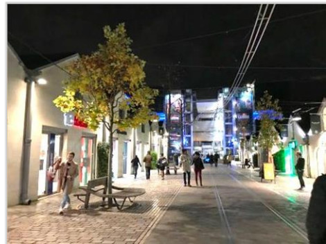
■ 貝西村為修復舊建築，並引進文創及娛樂的園區。

貝西地區於17世紀時就已經是巴黎最重要的紅酒市場，在18世紀成為世界最大的紅酒集散中心，隨著鐵路和公路發展，依靠塞納河船運的貝西村地位逐漸改變，直到80年代，透過貝西體育場 (POBP)、公園和圖書館改造計畫而重新活化。