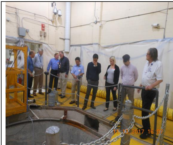
圖 7. TRIGA 研究用反應器除役現場

本次參訪該公司 TRIGA 第一代研究用反應器模廠的除役場址，該場址已將用過核燃料運走，反應器設施移除，但因為反應器下方的地下窖尚未完成除污及拆除工作，故陸續仍有少量除役作業進行施作(圖 7)，因為原場址規劃會再做為其他核能設施研究使用，故其完成除役後之輻射劑量限值為每年 1 毫西弗。參訪結束後，全體人員在 TRIGA 模廠除役廠房外部合影(圖 8)。