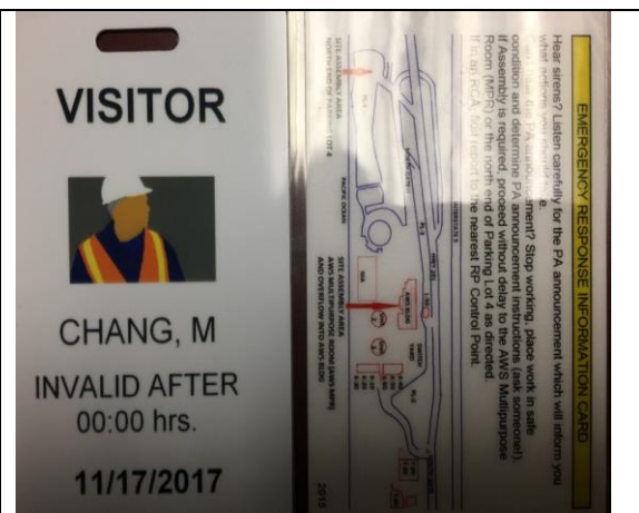
圖 16. SONGS 核電廠訪客通行證