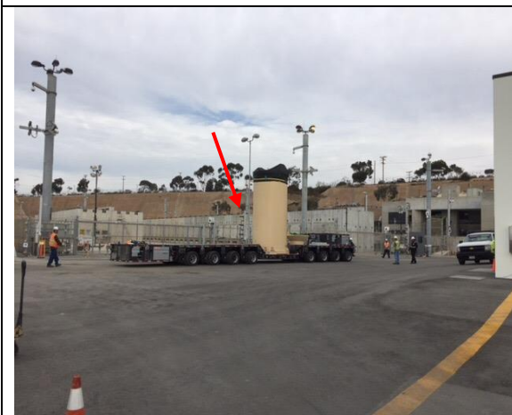
圖 13.垂直式 ISFSI 進行運輸模擬演練