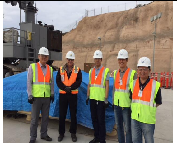
圖 12.作者與模擬操作機(後排)、SONGS 核電廠人員及 KINS 人員合影