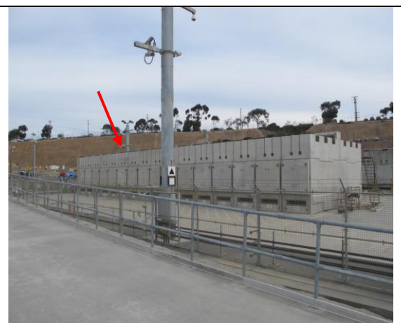
圖 10.水平放置式 ISFSI