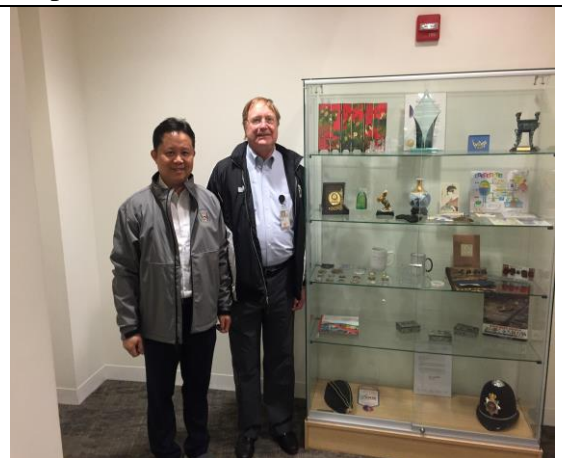
圖 6.作者、Watson 科長在營運中心入口國際來賓紀念品櫃前合影