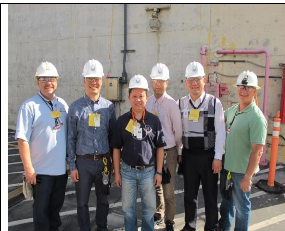
圖 17.作者與 SONGS 核電廠人員、KINS 人員合影

由於 SONGS 核電廠已永久停止運轉，但 2 號機組與 3 號機組用過核燃料尚未移至乾式貯存設施(ISFSI)貯存，廠區目前由 SCE 電力公司與 SDS 除役公司進行除役業務交接中，整個 SONGS 核電廠處於除役期的暗黑階段(Cold and Dark)，即反應器冷卻，除維護需要外其餘的廠房及設備的電力與機械系統及照明均停止供應動力，尚未執行廠區拆除作業等，除役計畫處於除役過渡階段(Transition Phase)，所以本次除役檢查管制重點為：