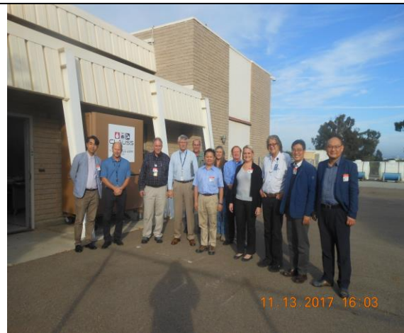
圖 8.作者與 NRC 官員及 GA 除役人員於 TRIGA 模廠除役廠房外部