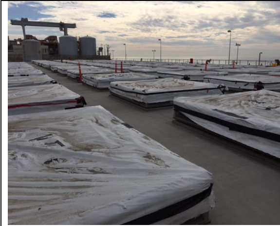
圖 11.半徑式垂直放置式 ISFSI