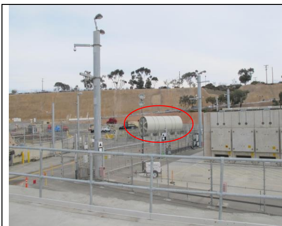
圖 9.壓力槽切割後存於運輸包件中

垂直放置式乾式貯存設施現場裝置有模擬操作機(圖 12)，可以供工作人員模擬操作練習使用，以提昇現場操作熟練度及安全性；檢查當天因垂直式乾式貯存設施正在進行運輸模擬演練 (圖 13)，現場可以看到載運貯存桶的運輸板車有高達 48 個輪胎，工作人員都很認真在操演。而因 SONGS 核電廠比臨太平洋，且當地有許多海鳥，廠方人員表示為防止附近海鳥到乾式貯存區聚集、排放鳥屎造成地面髒亂、環境污染，所以在乾貯場內放置仿真猛獸假偶像(Kayode，圖 14)，以驅趕海鳥在此聚集污染乾貯區地面。