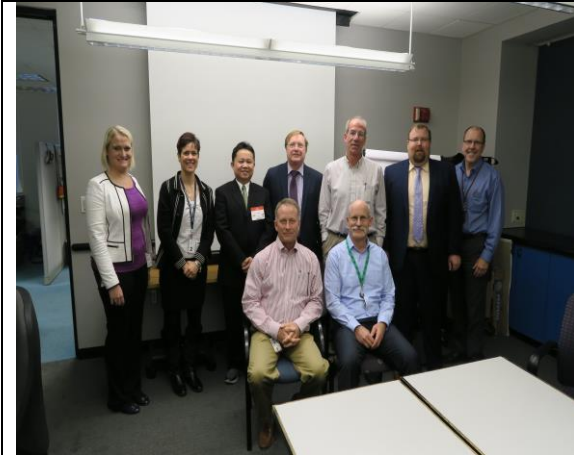
圖 1. NRC 反應器除役科業務會議後與 DUWP 副處長(後排左 2)及除役科合影