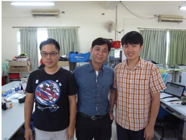
與役男個別訪談後合影