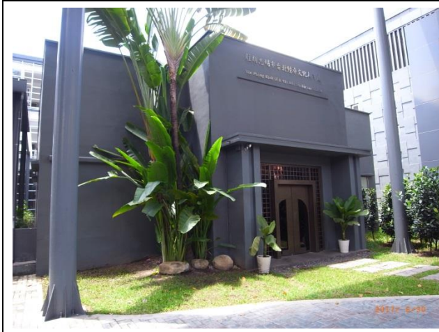
拜會駐胡志明市臺北經濟文化辦事處(教育組)