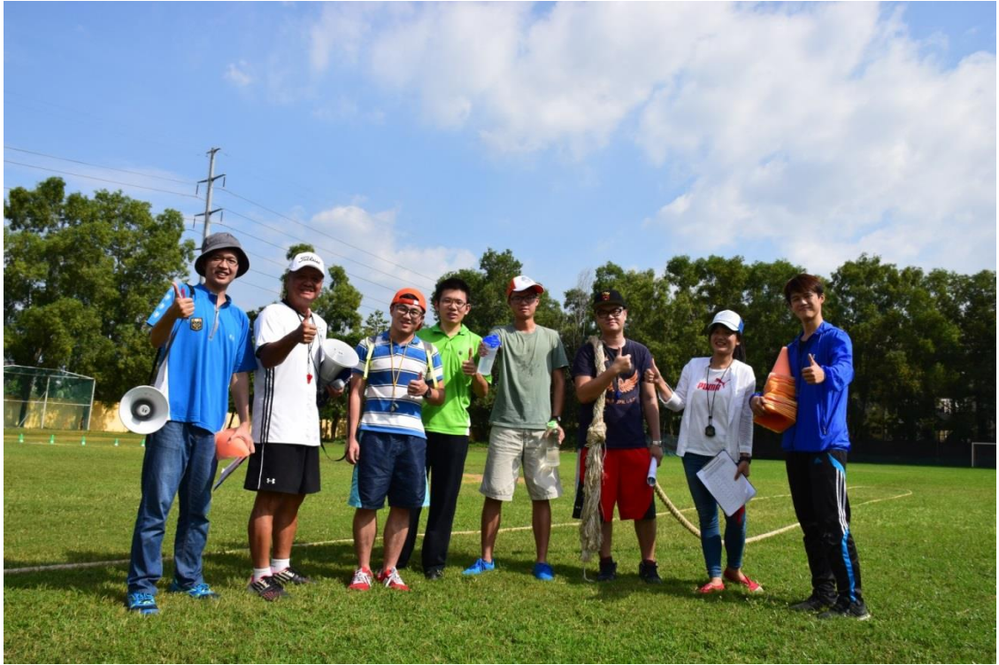
協助辦理學校運動會工作