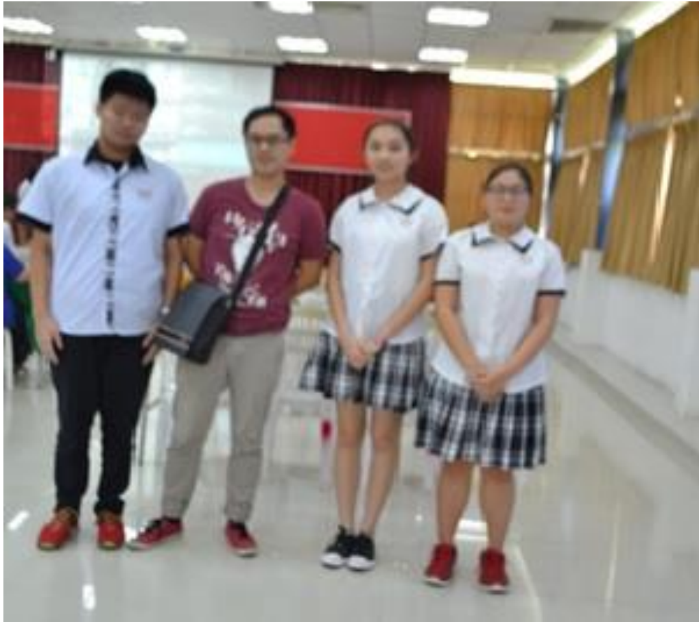
帶領學生參加演講比賽