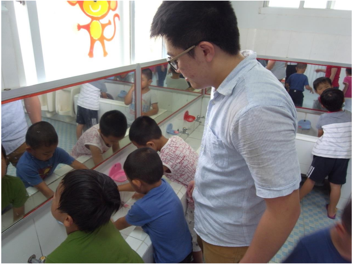
教導幼兒園小朋友洗手