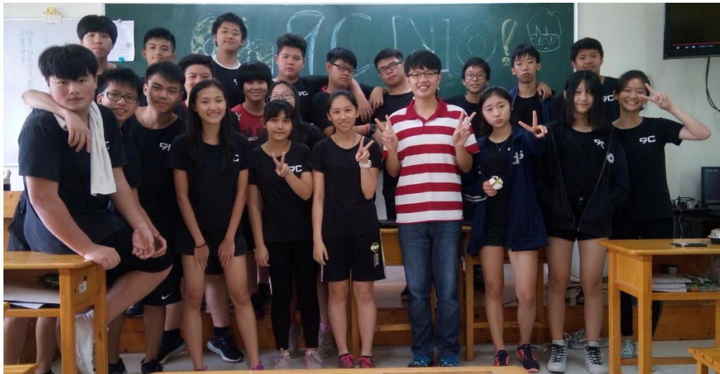
役男上課與學生合影