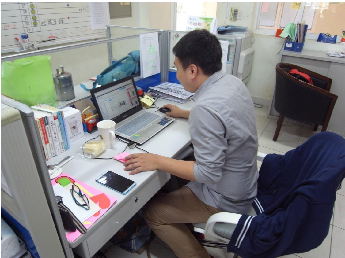
協助輔導室建立輔導個案