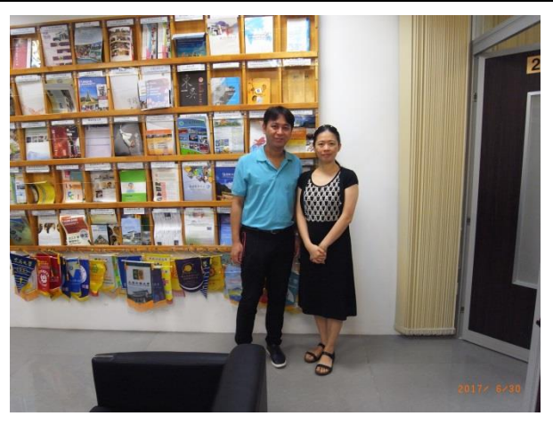
拜會駐胡志明市臺北經濟文化辦事處(教育組)