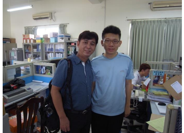
與役男個別訪談後合影