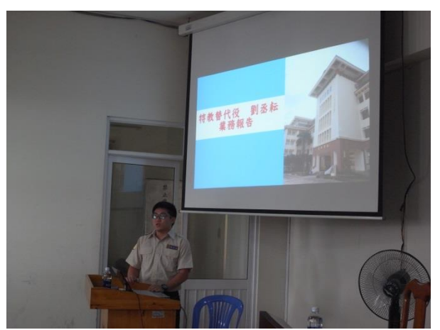
聽取學校及役男服役生涯簡報