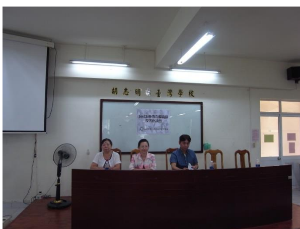
校長、主任親臨共同主持綜合座談會