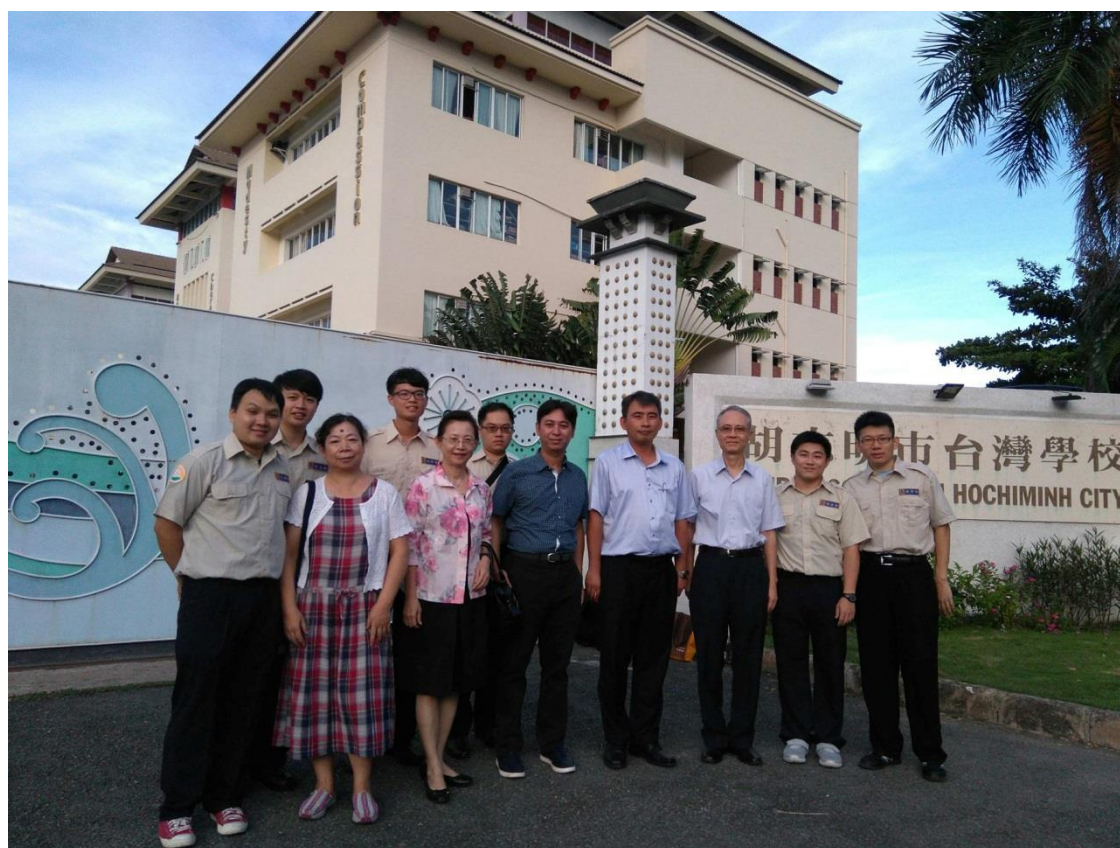
校長、教職人員、家長會長及全體役男共同合照