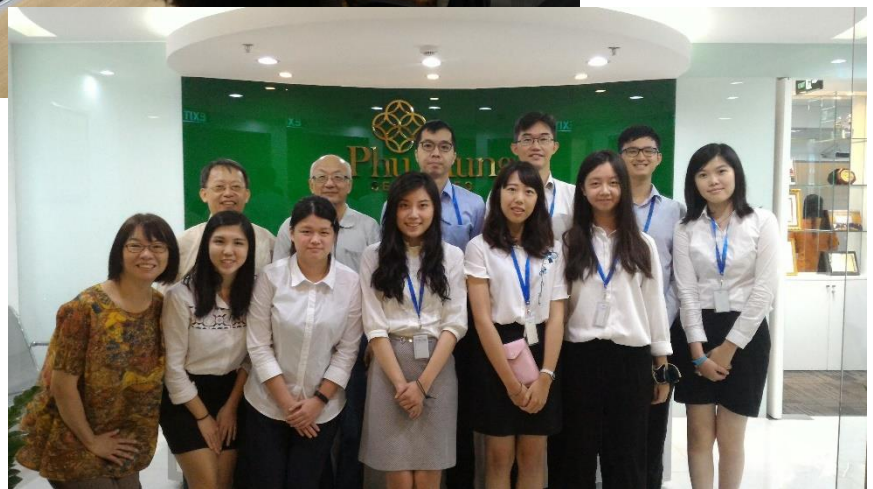
圖七&圖八、與富鑫證券主管座談情形及實習學生合影