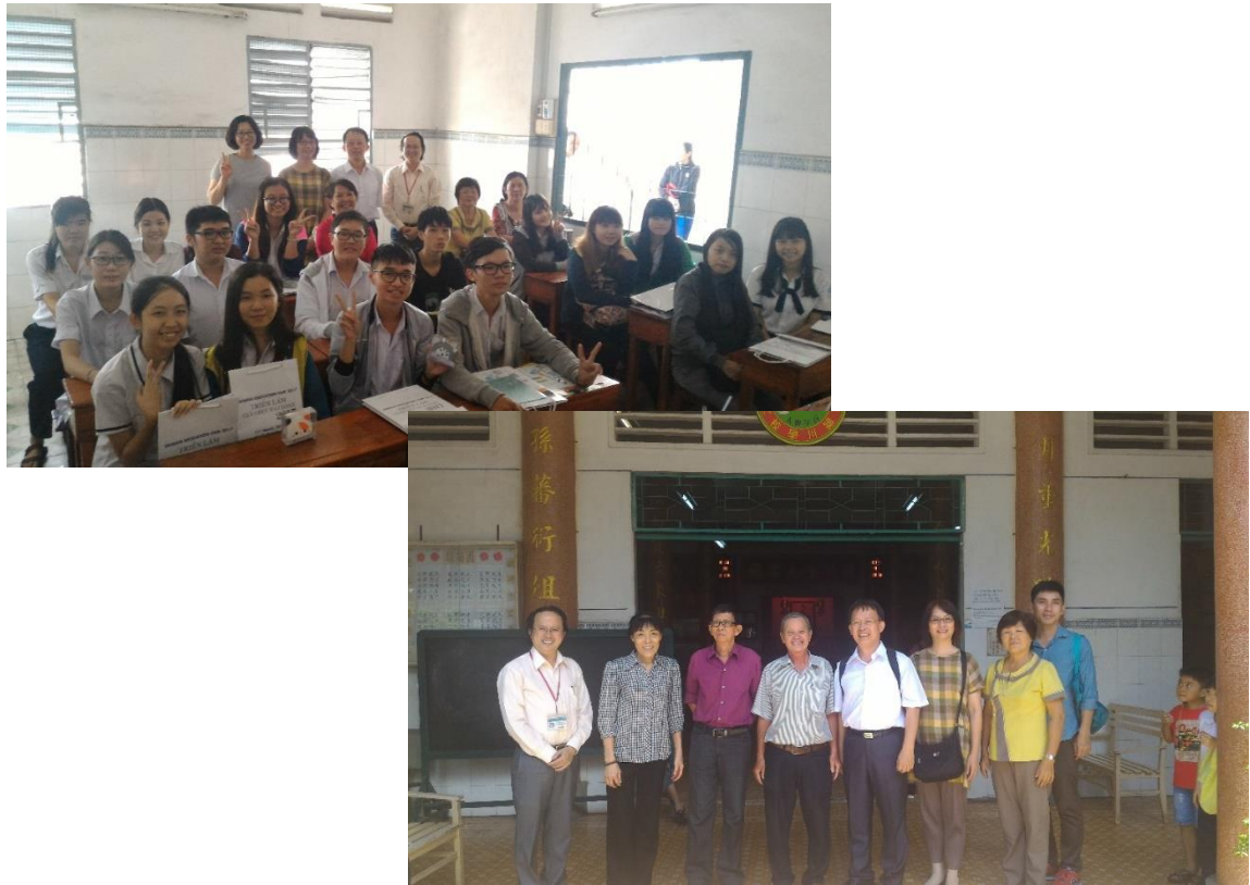
圖十一&圖十二、穎川中學參與宣導說明會學生及師長合影

臺灣教育中心胡明光主任主持，為該校師生解說臺灣大學教育優勢，以及赴臺升學相關管道及申請流程，使各位同學及師長對於臺灣高等教育理念及升學方式有更深入的了解。同學反應熱絡，並積極詢問赴臺升學相關問題。