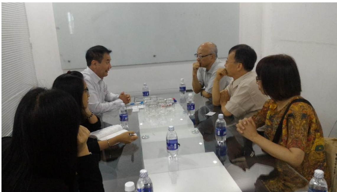
圖九、與 FBNC 電視台主編座談情形

接著宣導團前往越南 FBNC 電視台辦公室，洽談本會未來辦理高等教育展及招生宣導活動與當地電視台之宣傳合作方案，與電視台主編相談甚歡，並初步確定未來合作意向。