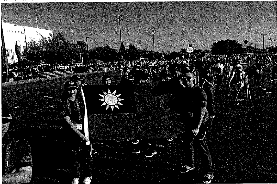
本署代表團成員於開幕典禮進場，於會場接受觀眾熱烈歡迎