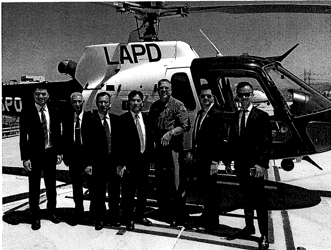
團本部成員前往拜會洛杉磯警察局