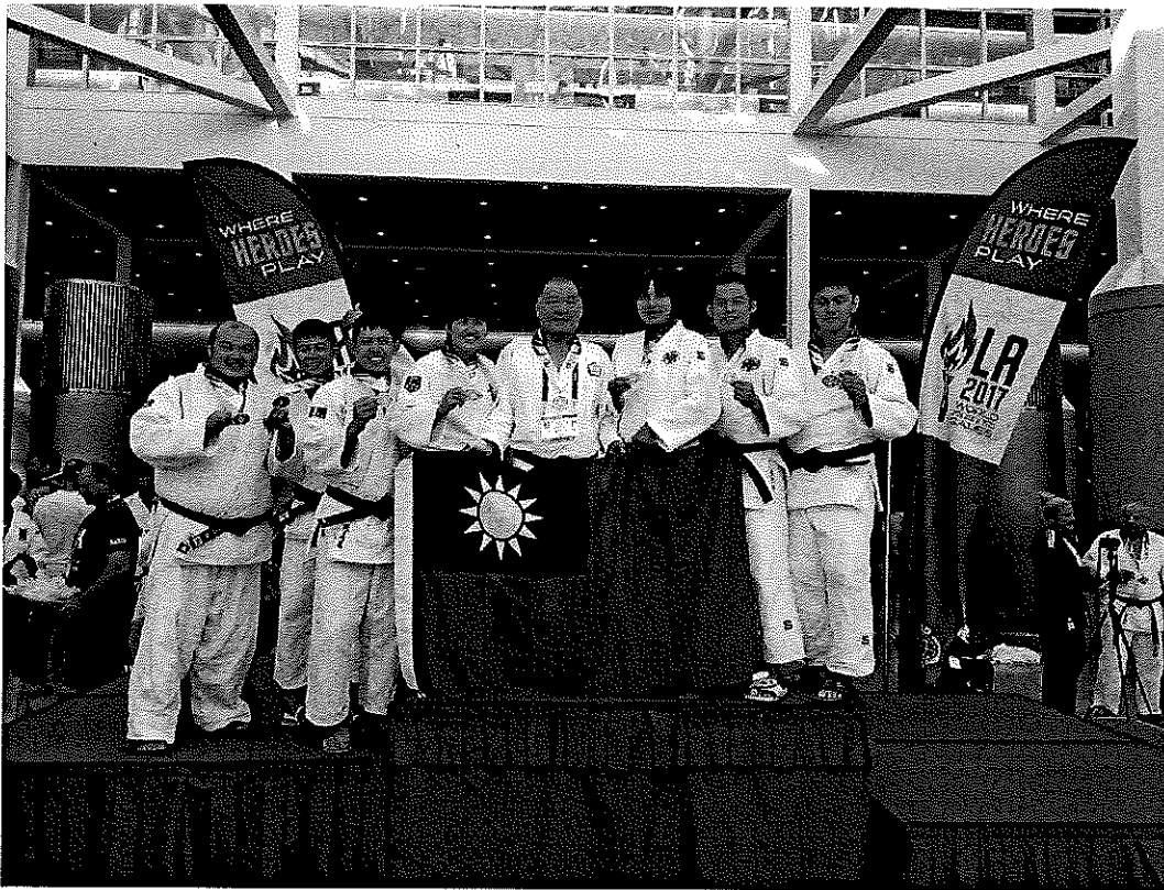
柔道選手於本次賽會奪下多面獎牌