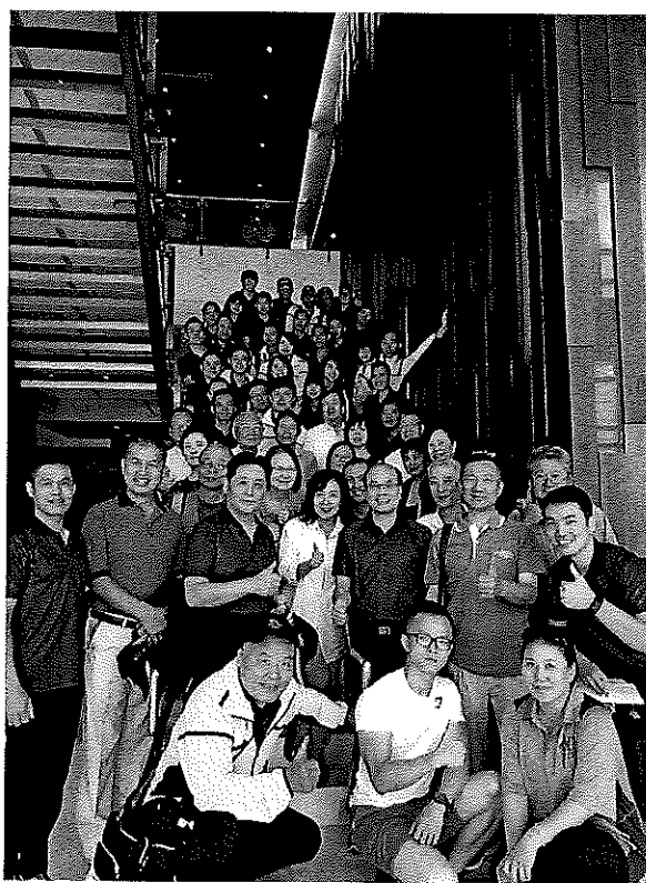
僑胞與團員一同合影留念