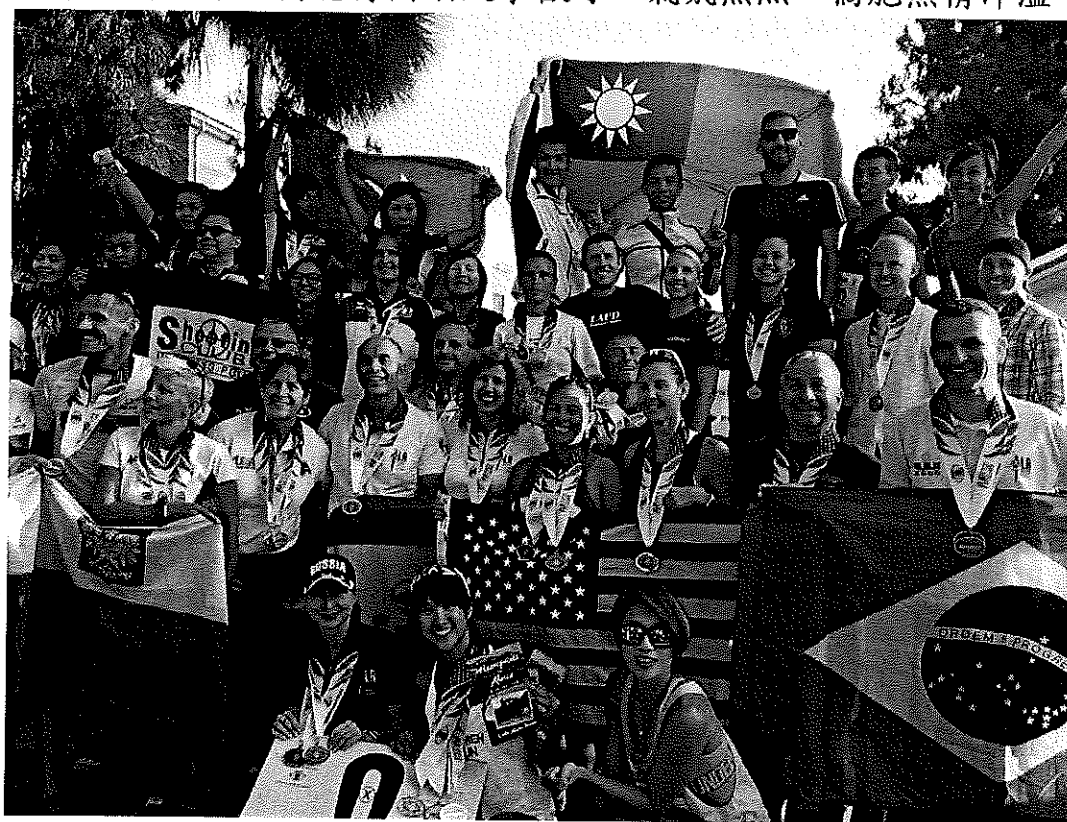
我國選手與世界各國選手合影