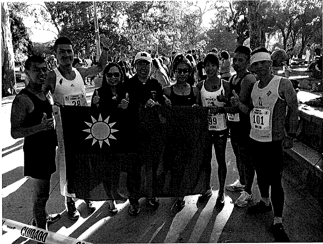
田徑隊奪牌後與同行僑胞合影