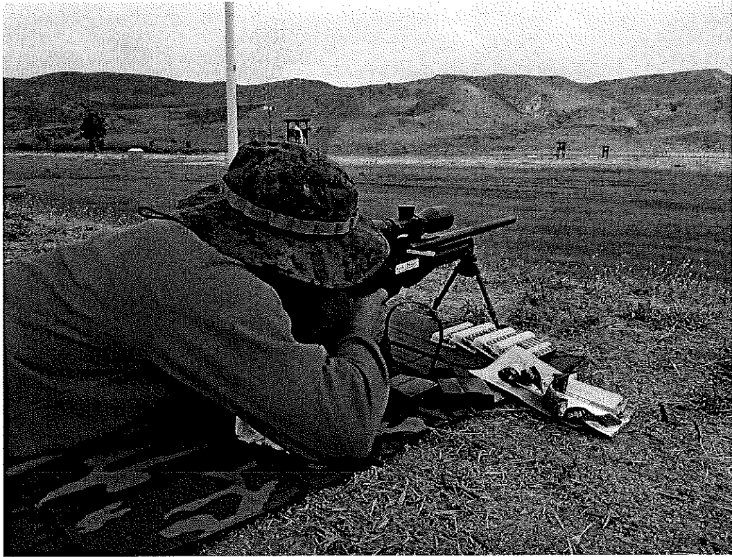
步槍射擊比賽與各國選手同場競技