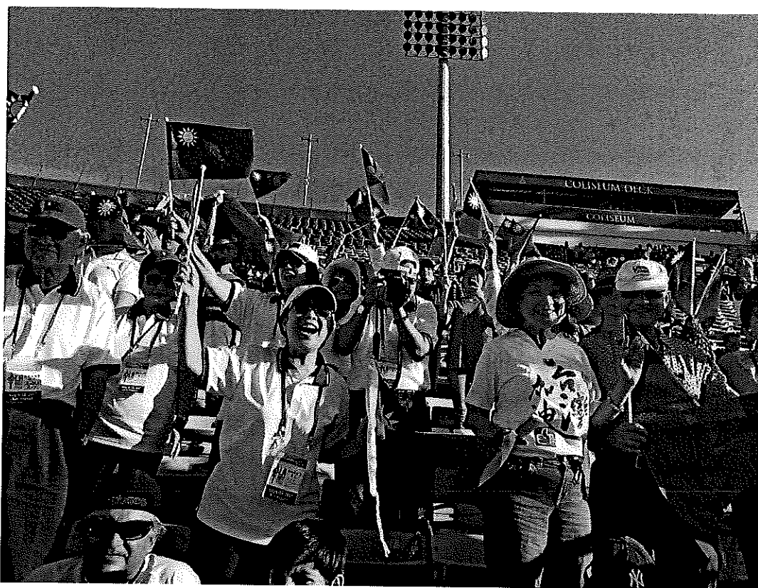
開幕現場觀眾及僑胞持國旗鼓掌歡呼，氣氛熱烈，僑胞熱情洋溢