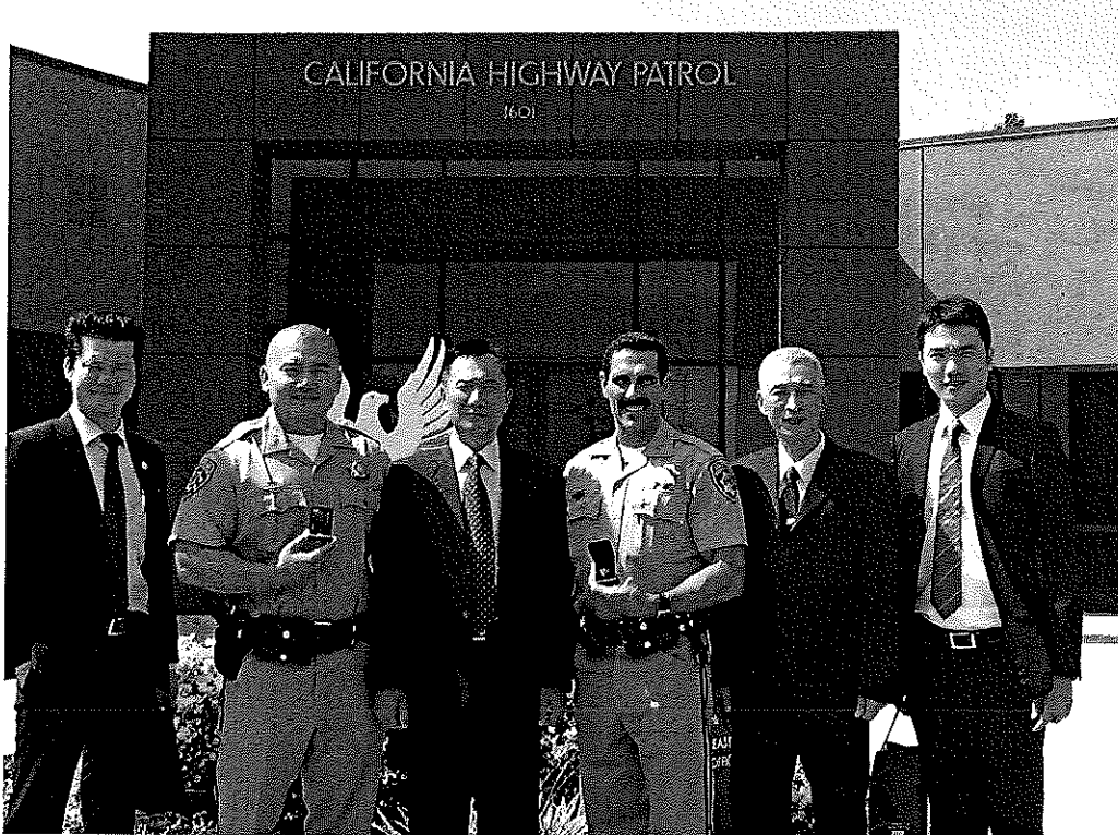
團本部成員前往拜會加州公路警察局