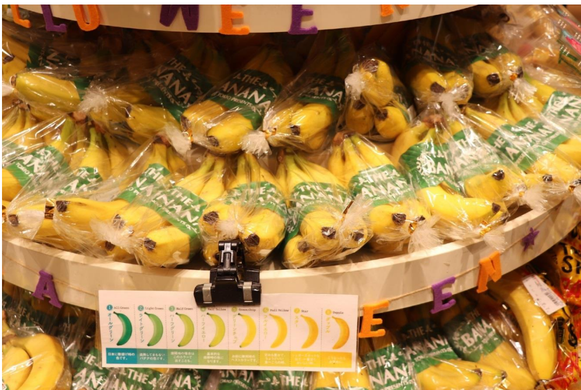
圖 22：南國水果株式會社位於岩田屋本館的水果專櫃 TOKIO 展售的菲律賓香蕉。