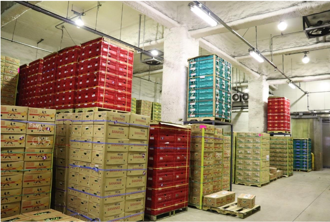
圖 5：上組株式會社東京多目的物流中心內的進口香蕉儲存情形，採棧板作業。