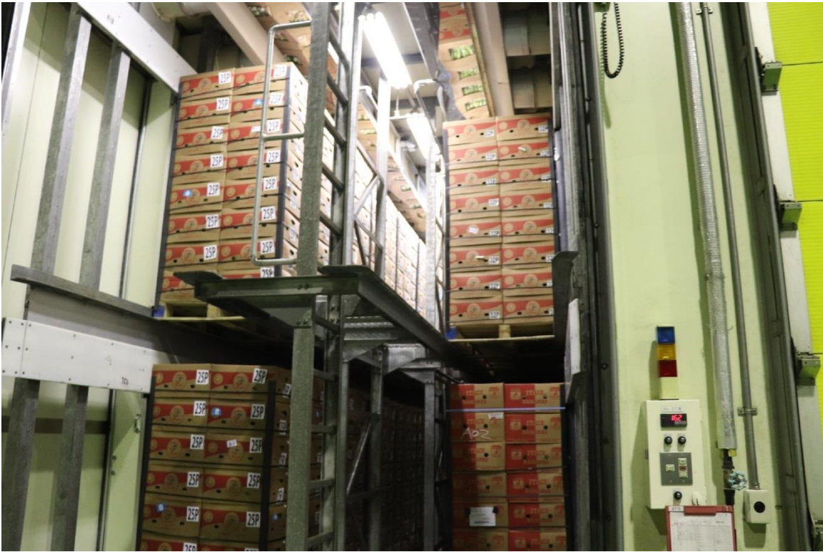
圖 7：Farmind 株式會社青海水果加工處理中心內的香蕉催熟庫。