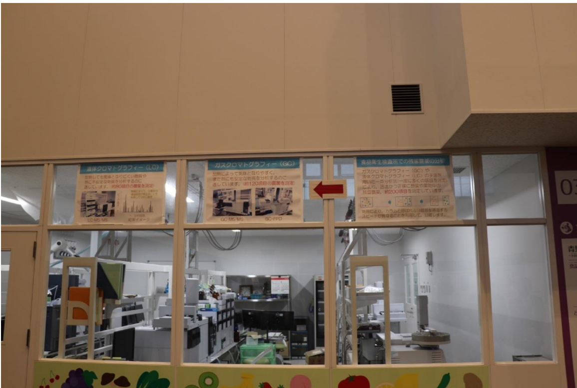
圖 14：福岡大同青果株式會社批發市場內設置的農藥殘留檢驗室。