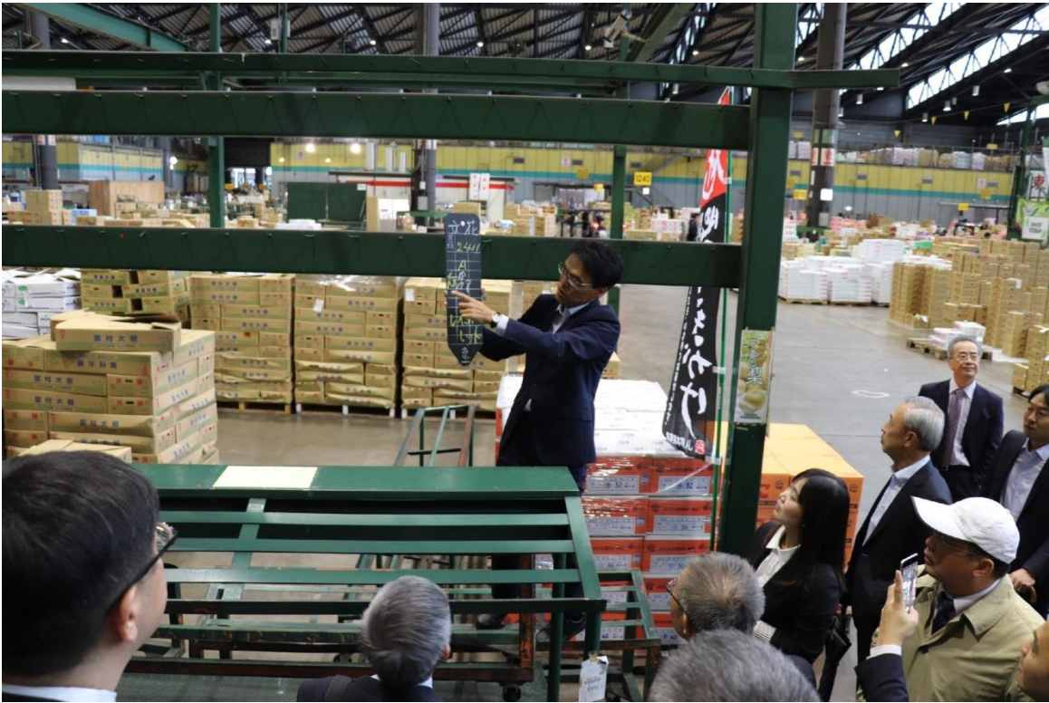
圖 3：東京青果株式會社人員解說如何進行拍賣。