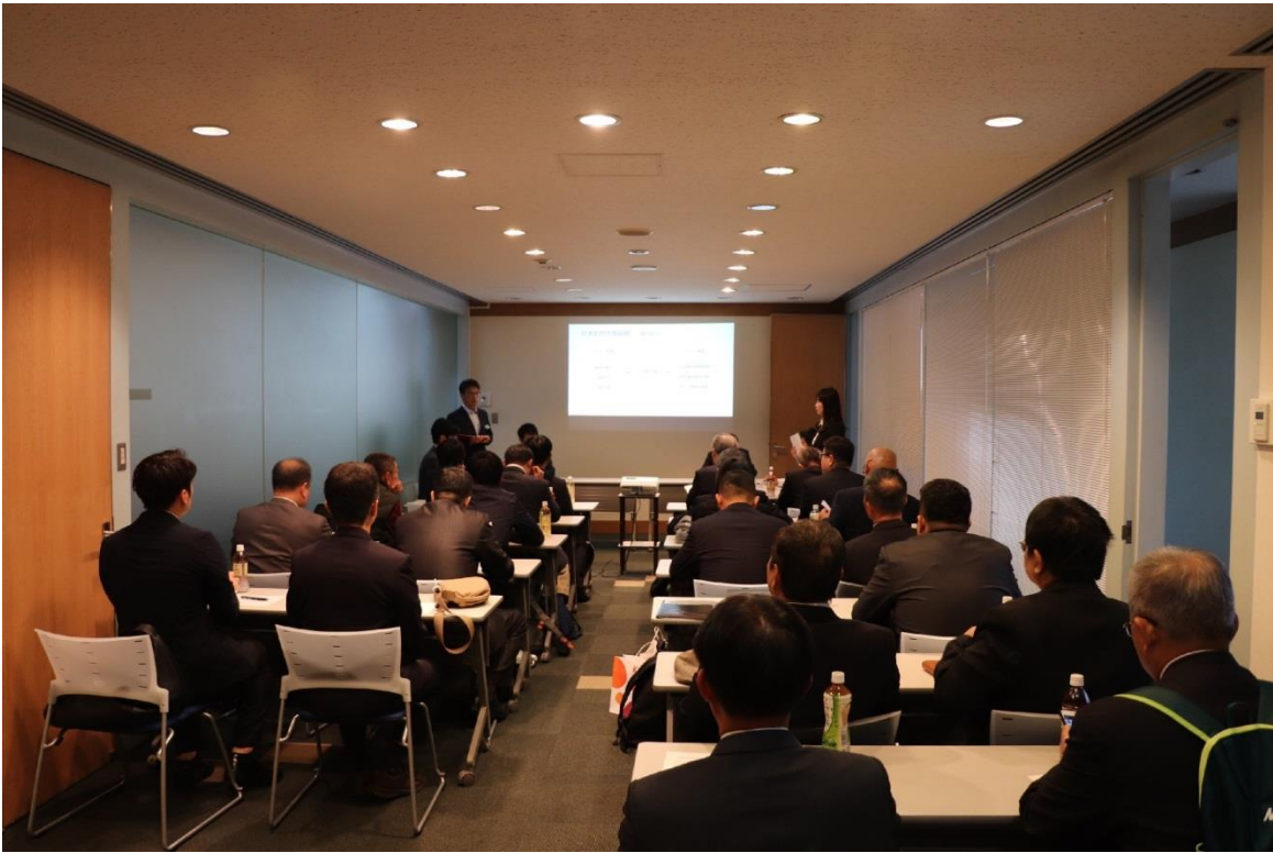
圖 1：東京青果株式會社進行簡報。