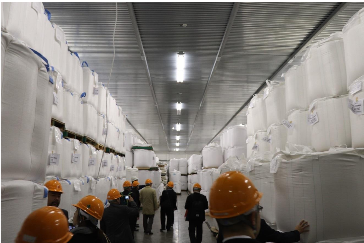
圖 4：上組株式會社東京多目的物流中心內的稻米儲存情形。