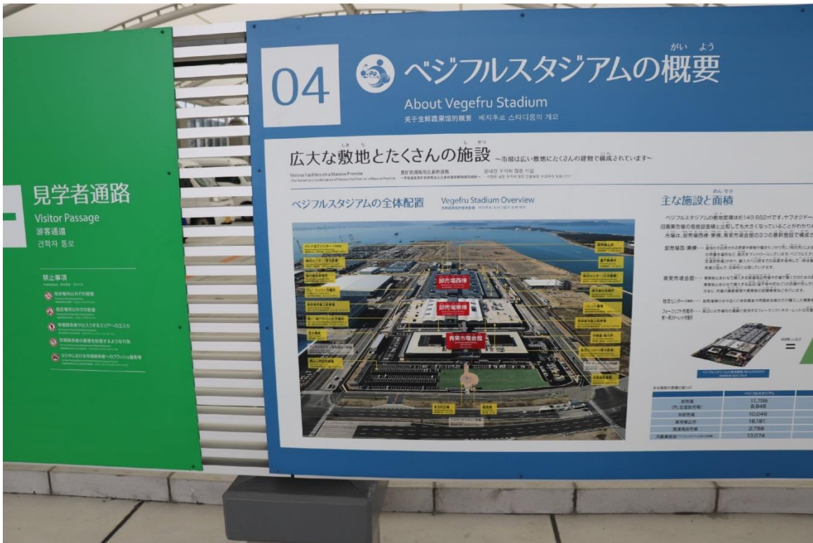
圖 15：福岡大同青果株式會社批發市場配置圖。