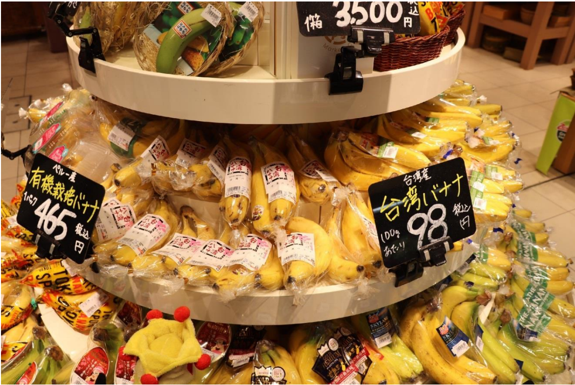
圖 19：南國水果株式會社位於岩田屋本館的水果專櫃 TOKIO 展售的臺灣香蕉。