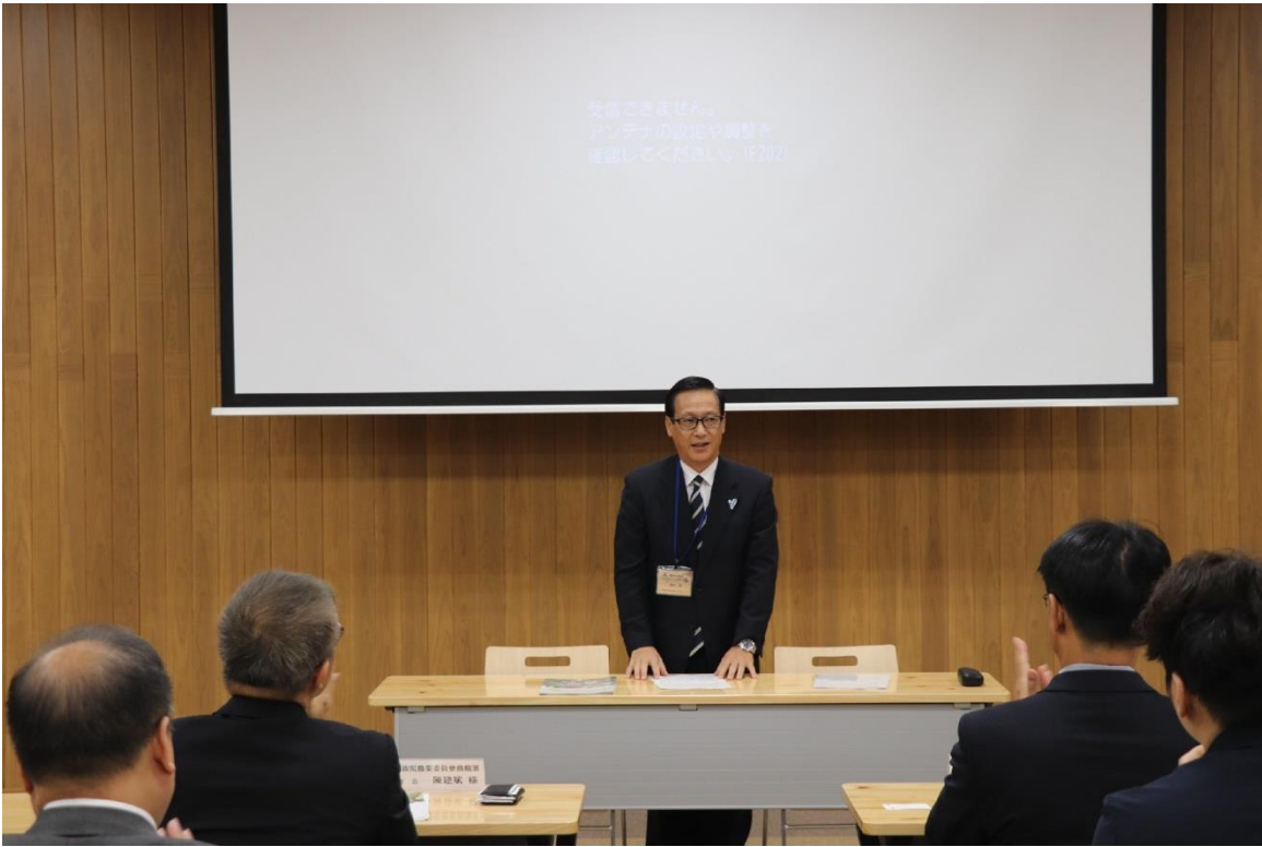
圖 13：福岡大同青果株式會社人員進行簡報。