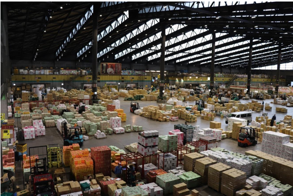
圖 2：大田市場內情形。場內搬運車輛動力使用天然氣。