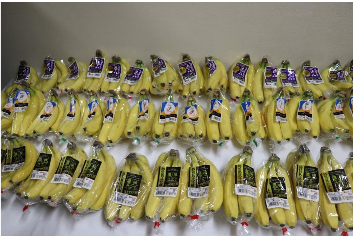
圖 8：Farmind 株式會社青海水果加工處理中心處理完成的部分香蕉商品。