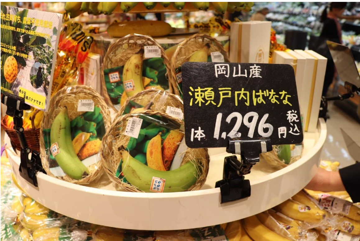
圖 20：南國水果株式會社位於岩田屋本館的水果專櫃 TOKIO 展售的日本岡山縣產香蕉。