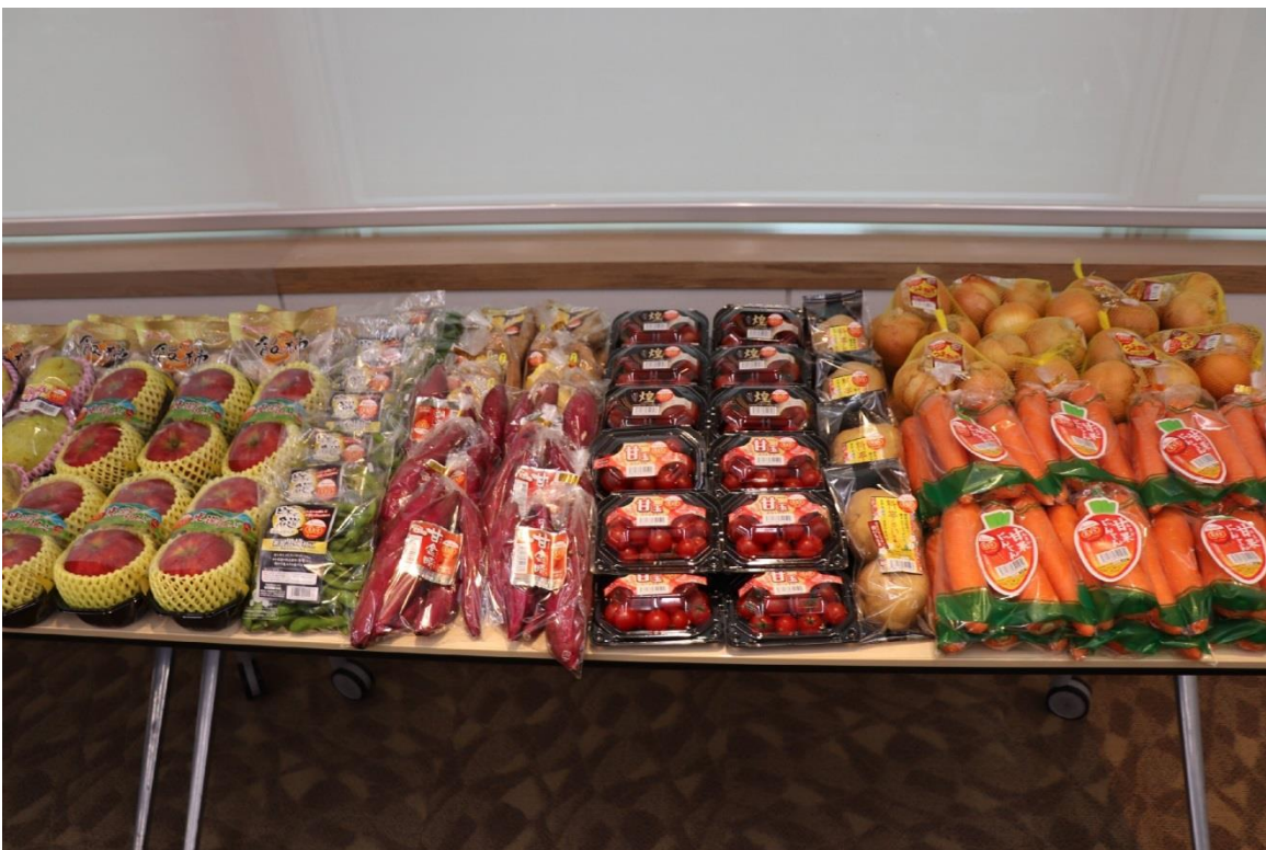
圖 10：簽署儀式現場展示的部分 Farmind 株式會社自有品牌蔬果產品。