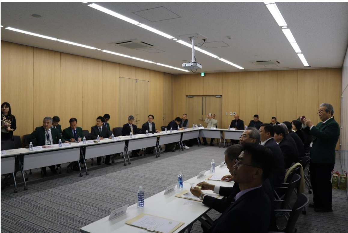
圖 12：京都青果株式會社人員進行簡報。