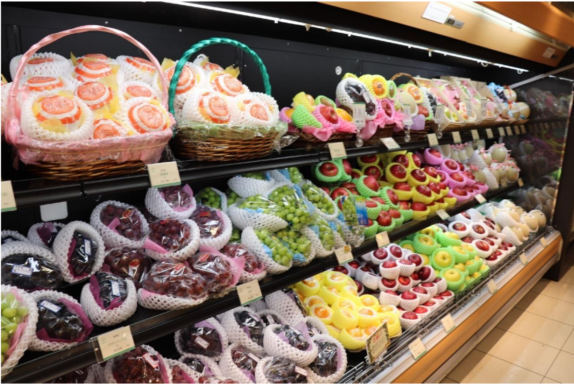
圖 23：南國水果株式會社位於岩田屋本館的水果專櫃 TOKIO 展售的各式水果。