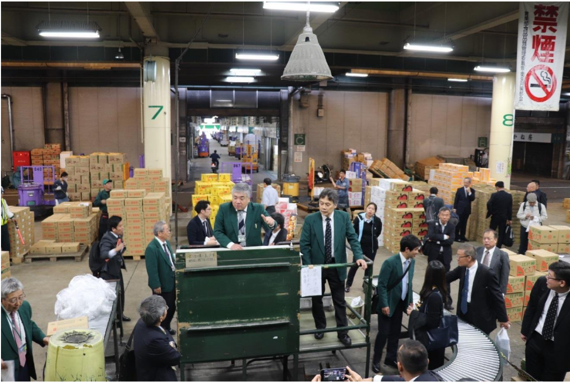
圖 11：京都青果株式會社人員解說如何進行水果拍賣。