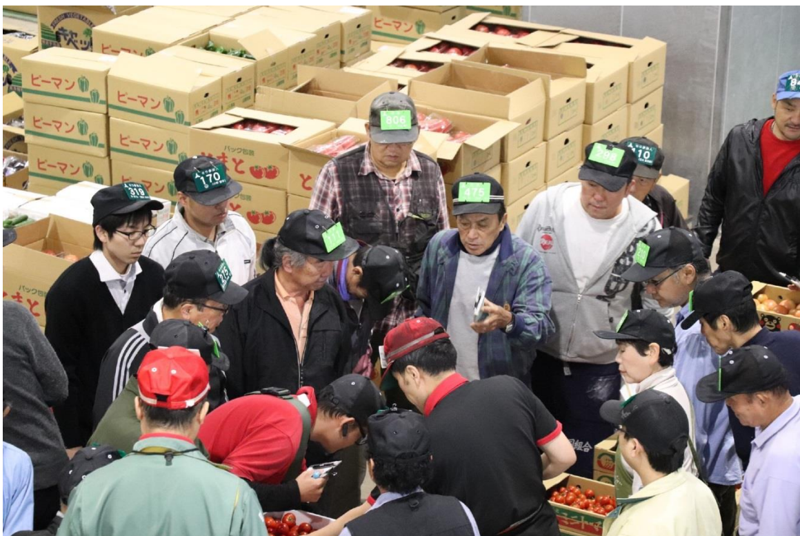
圖 16：福岡大同青果株式會社批發市場內番茄拍賣情形。