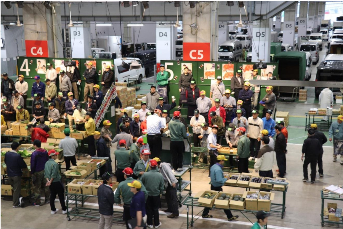
圖 17：福岡大同青果株式會社批發市場內蔬菜拍賣情形。