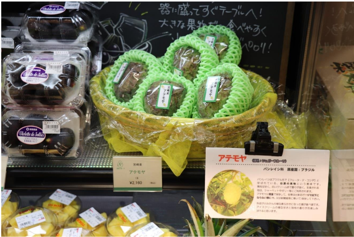
圖 21：南國水果株式會社位於岩田屋本館的水果專櫃 TOKIO 展售的日本宮崎縣產釋迦。