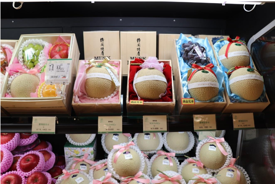
圖 24：南國水果株式會社位於岩田屋本館的水果專櫃 TOKIO 展售的靜岡縣產哈密瓜。