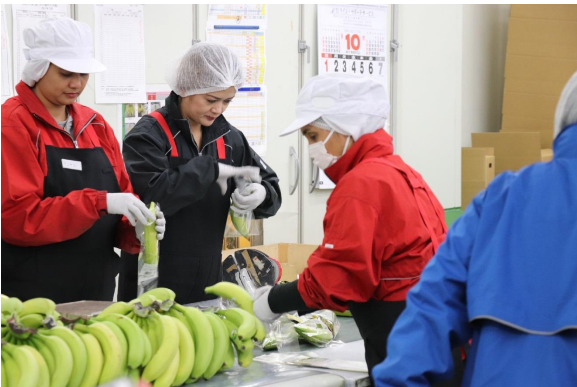
圖 6：Farmind 株式會社青海水果加工處理中心內的單支包裝香蕉作業線情形。