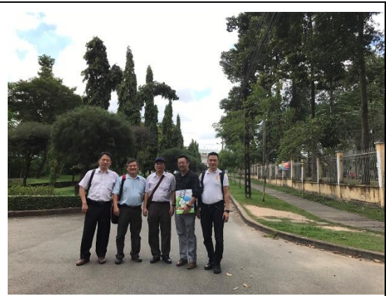
參訪胡志明農林大學