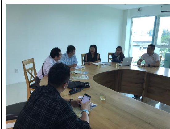
與胡志明農林大學育成中心主任會談