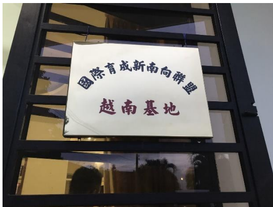
國際育成新南向聯盟越南聯絡基地掛牌