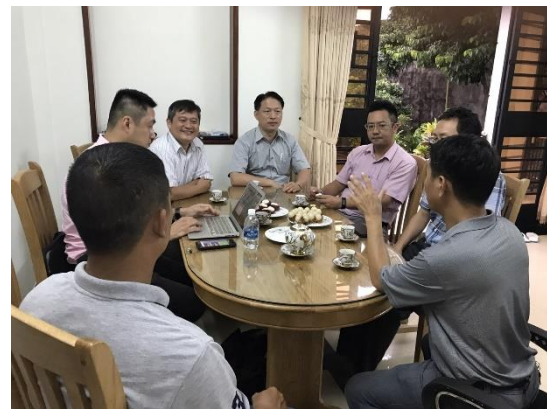
參訪宜興國際責任有限公司