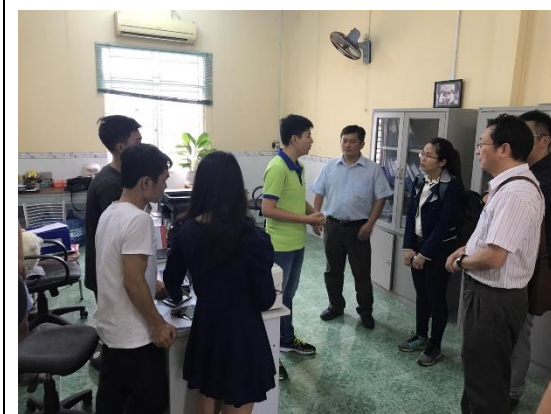
拜會胡志明農林大學青年孵化中心青年創業團隊