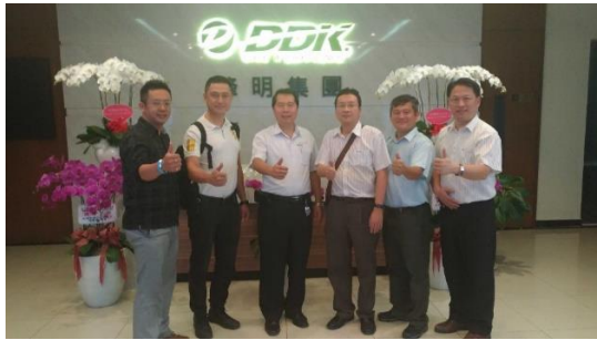
參訪越南鋒明集團