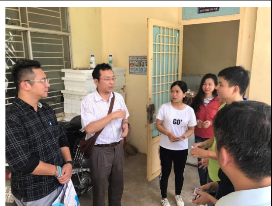
拜會胡志明農林大學青年孵化中心青年創業團隊