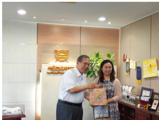
致贈紀念品給國立首爾教育大學