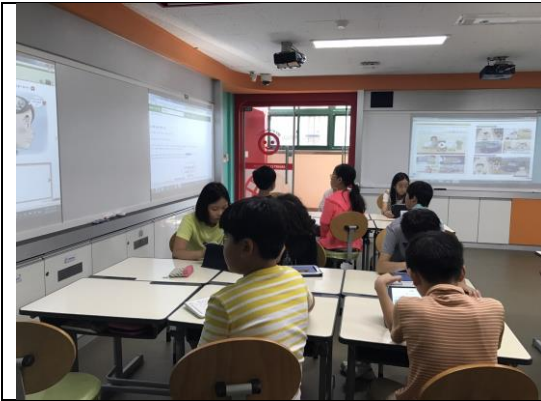
小朋友正在上網找尋未來適合的職業