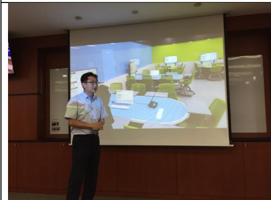
成均館大學數位教室設備先進