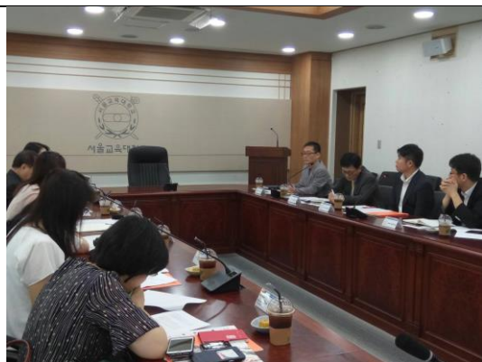
研修院院長說明小學校長研習制度