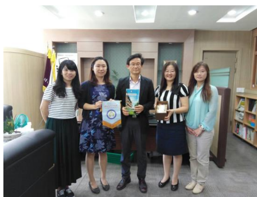
致贈紀念品給黎泰院小學