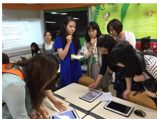
實際操作黎泰院小學數位教材