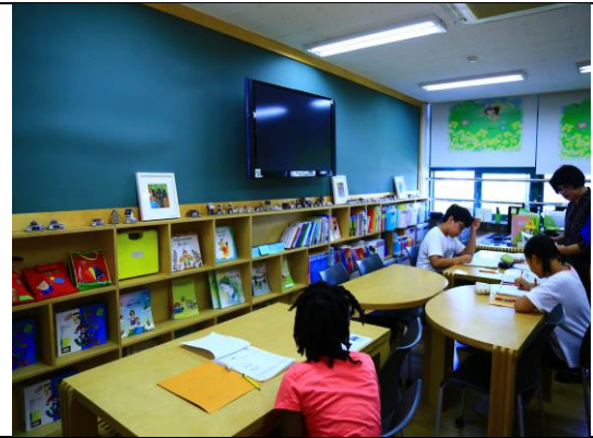
多元文教室進行數學科補救教學