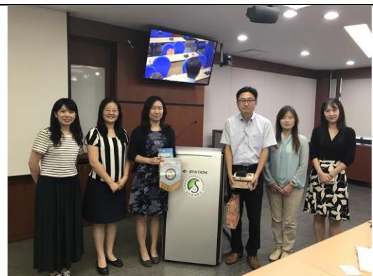
致贈紀念品給成均館大學