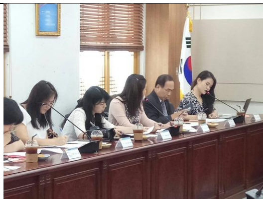
駐韓台北代表陪同拜會首爾教育大學