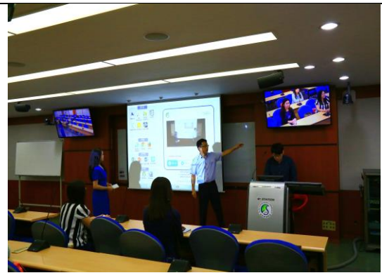
成均館大學展示錄影設備