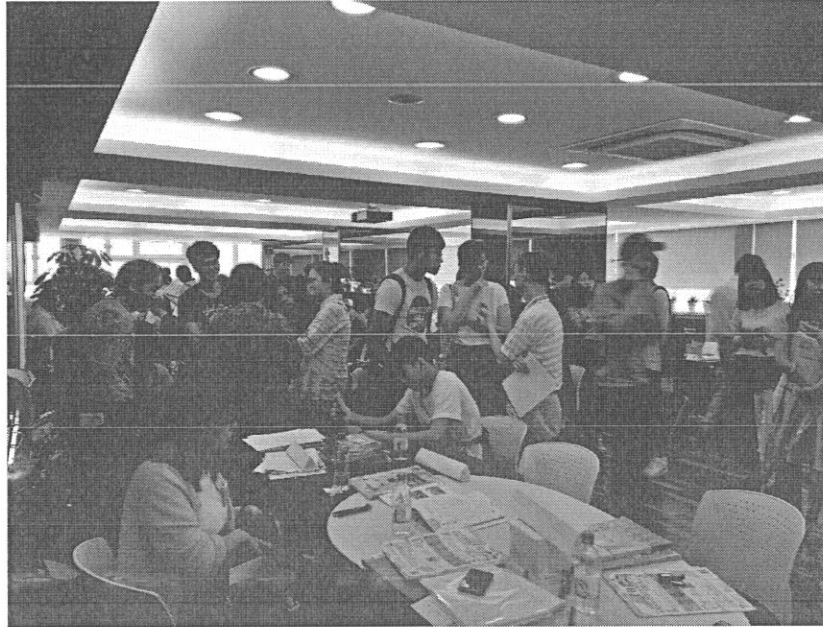
『選填志願諮詢服務暨獨招面談會』盛況。