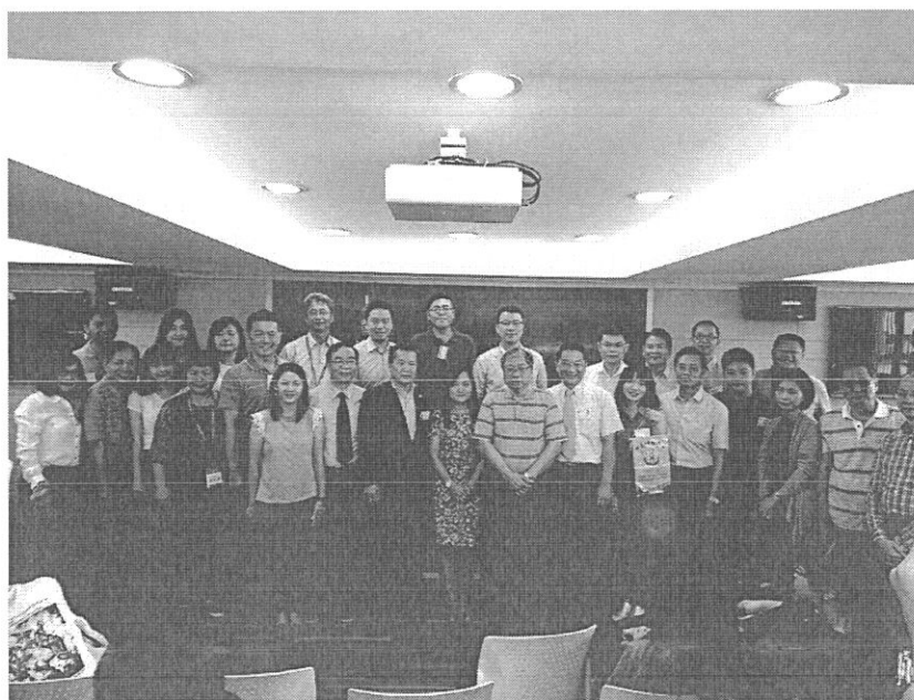
部分與會學校代表團體合照。