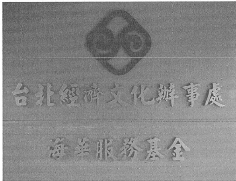
臺北經濟文化辦事處－海華服務基金