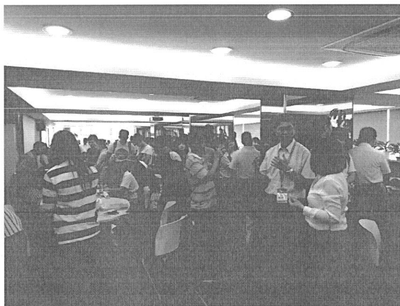
『選填志願諮詢服務暨獨招面談會』盛況。