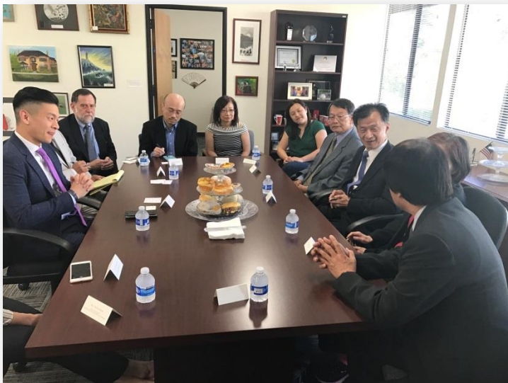
部長會晤羅議員，相談甚歡

由於羅議員長期致力推動加州同性婚姻合法化，部長特別針對推動立法及實踐過程中，請教羅議員如何因應社會上來自不同團體之各方阻力及反對聲浪。部長指出，我國傳統文化及民間宗教，對於多元性傾向雖多表示尊重及友善，然涉及家庭及子女教養議題時，則相對趨於保守，乃至於我國近 2 年來，論及同性婚姻立法議題時，往往衝突