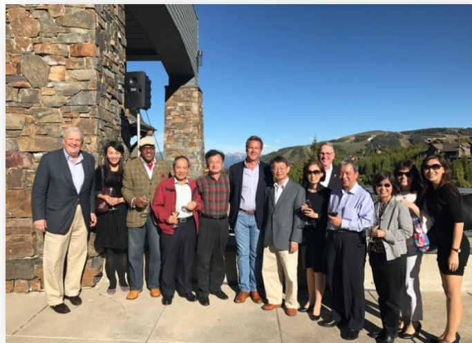
訪團全體與蒙大拿州州長 Steve Bullock(中)、蒙大拿州檢察長 Tim Fox(右五)合影

為利抵達會場後，仍有充裕時間準備開會事宜，訪團提前於會議前一日即 106 年 6 月 19 日上午 10 時許，即由邱部長帶隊搭機前往全美州州檢察長會議所在地蒙大拿州 BIG SKY 市，並於當地波斯曼機場與當時由法務部遴選派往美國史丹佛大學擔任訪問學者，原任於臺灣嘉義地方法院檢察署之陳檢察官靜慧回合，再行一同驅車前往 1 小時車程之外的大會會場。本次大會場地位於 BIG SKY 渡假村內，訪團成員全數下榻於渡假村高峰旅館（BIG SKY RESORT SUMMIT HOTEL），大會會場及用