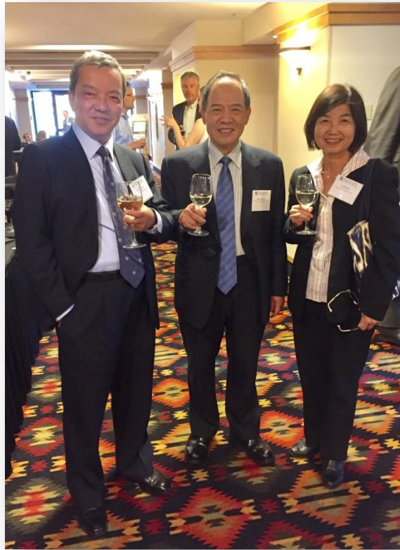
3 位檢察長於 NAAG 夏季年會晚會合影