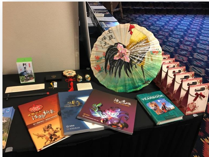
我國法務部出版品、禮品展示桌

交趾陶燒源自唐三彩，為臺灣傳統中氏建築（例如：廟宇）常見裝飾，色彩斑斕多變，獅子為吉祥獸，有驅邪納福、祥獅獻瑞之意，乃我國在地文化十足之代表。此交趾燒乃由嘉義監獄禮聘名師教學所發展出的特色商品，訪團有意藉此禮品，與美國各州檢察長交流法務部致力於透過矯正機關內手工藝教學轉化受刑人氣質、培養受刑人一技之長，且轄下矯正機關辦理自營工藝商品成效。至於青花瓷隨身碟內則內建法務部英文簡介，有利於美國各州檢察長對於我國組織與政策之認識。