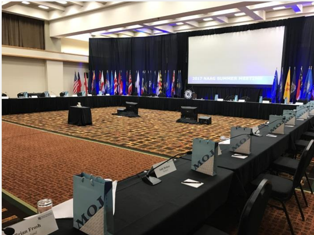
2017 年全美州檢察長協會夏季年會場地

對各該州人民負責；合作（collaboration and Cooperation），即促進會員州間經驗、知識及意見交流；參與及包容（Engagement and Inclusiveness），即提供交流平臺，使各州成員與其部屬能在信任及尊重的環境下，針對共同利益朝著同方向努力邁進，而不置身事外。