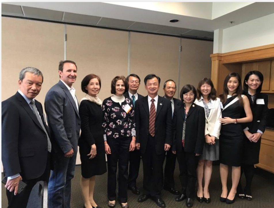
訪團全體於 NAAG 臺灣歡迎會上與最新當選之 NAAG 會長 Jeff Landry(左二)合影

每年，全美州州檢察長夏季年會邀請我國法務部參加與會，於法務部長或檢察總長率團參加時，均會特邀團長致詞，以展現雙方友好合作關係，並且藉此交流我國最新施政狀況，以維繫雙方司法互助情誼。本次邱部長率團與會，受邀於大會首日即美國時間 6 月 20 日下午 2 時 45 分許致詞演說，演說內容著眼於我國司法改革現狀，以及法務部近年施政方針。為表達對地主的尊重及敬意，邱部長特別全程以英文進行長達 20 分鐘的演說，以各州檢察長及與會來賓母語進行最貼近的交流，廣泛引發在場者共鳴，大獲好評。演說結束後，部長