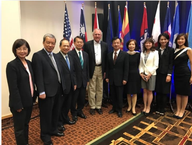
訪團全體與NAAG會長George Jepsen(中)於會場合影

全美州檢察長會議自1987年起，每年均會發函邀請我國參加夏季會議，而法務部或其下轄地檢署，則自該年度起，每年均組團應邀與會，並多為法務部長或檢察總長率隊出訪。今(2017)年夏季會議於2017年6月20日至22日舉辦，由蒙大拿州主辦，會議城市在蒙大拿州BIG SKY市，地主蒙大拿州檢察長Tim Fox嚴選一間位在黃石公園內的休閒渡假村(BIG SKY RESORT)，供州檢察長們攜家帶眷出遊與會，在嚴肅的會議同時，仍能兼顧社交、聯誼及天倫之樂。明(2018)年度的夏季會議將由奧瑞岡州檢察長接棒主辦，預定於2018年6月19日至21日在波特蘭市舉辦。