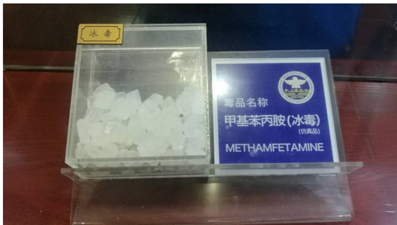
圖 7 反毒展示 冰毒仿品陳列