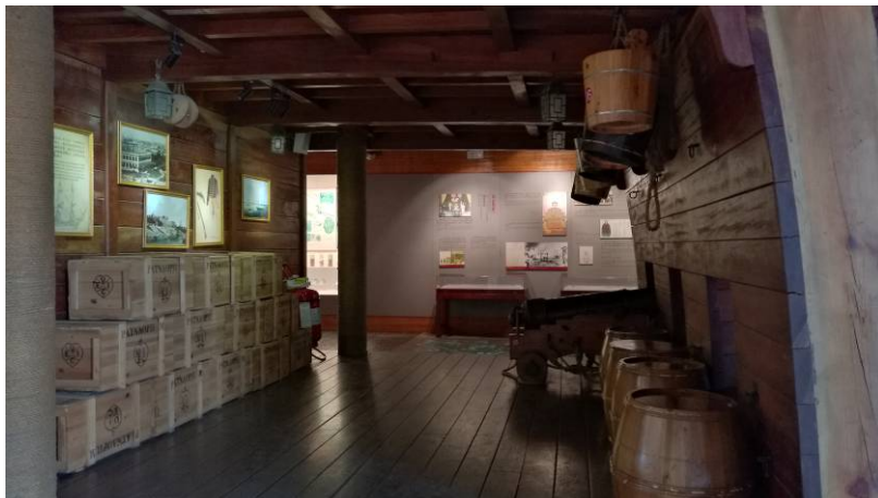
圖 5 鴉片戰爭史料與造景