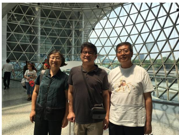
圖 11 與上海科技館之前合作人員合影

7月22日 整理收集新的上海自然博物館展覽資料。上海自然博物館新館的位置十分好，一出地鐵站即是該館的外部庭園。新館的展示與動線(如圖 12-14)在設計上都做的很好，在教育上除了有例行的導覽科教活動外，還設有探索中心(如圖 15)，其內有化石挖掘區(如圖 16)與探索的實驗、觀察與主題教室(如圖 17-18)。