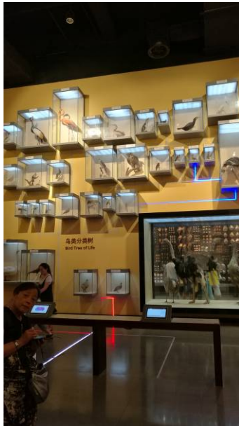
圖 14 上海自然博物館繽紛生命展區