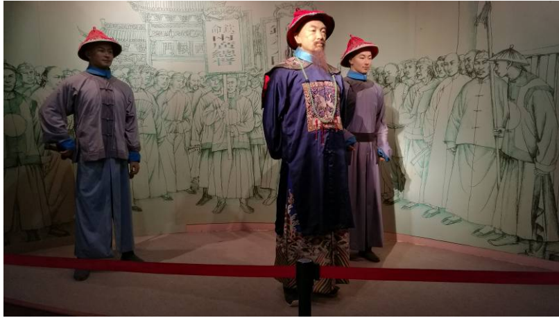
圖 4 林則徐廣東消煙時蠟像