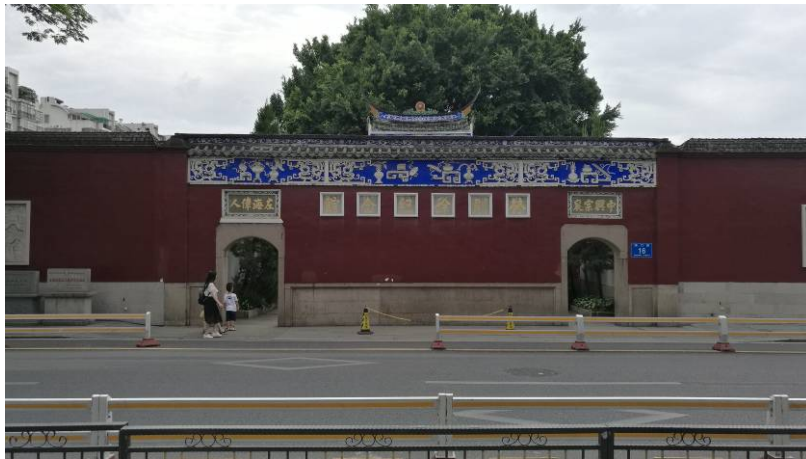
圖 3 林則徐紀念館

7月19日 整理收集林則徐紀念館(如圖3)展出的鴉片戰爭史料(如圖4-6)及反毒相關資料(如圖7-9)·此相關資料可做為接續CSI展設計使用。