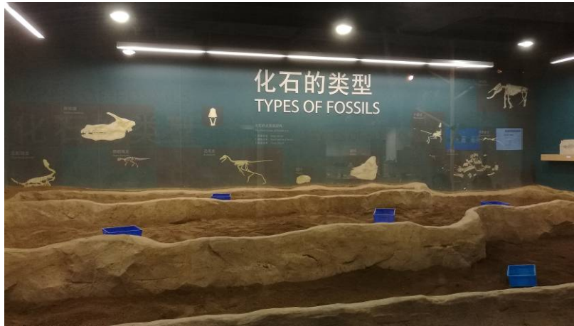
圖 16 化石挖掘區