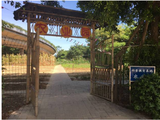
圖 2 開心農場-福州科技館農業園

7月19日 整理收集林則徐紀念館(如圖3)展出的鴉片戰爭史料(如圖4-6)及反毒相關資料(如圖7-9)·此相關資料可做為接續CSI展設計使用。