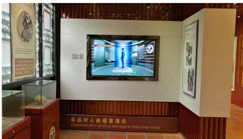
圖 8 反毒展示 虛擬人體影像