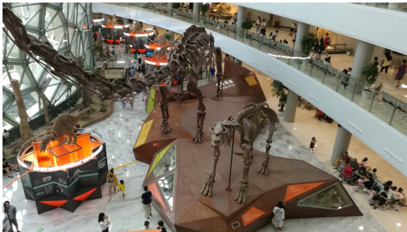
圖 13 上海自然博物館恐龍特展