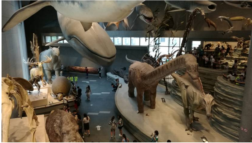
圖 12 上海自然博物館生命長河展區