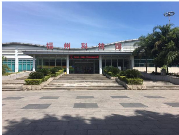
圖 1 福州科技館

該館除了有近似科學中心操作式的展示，還有受到當地民眾相當歡迎可免費種菜收菜的開心農場-農業園 (如圖 2)。