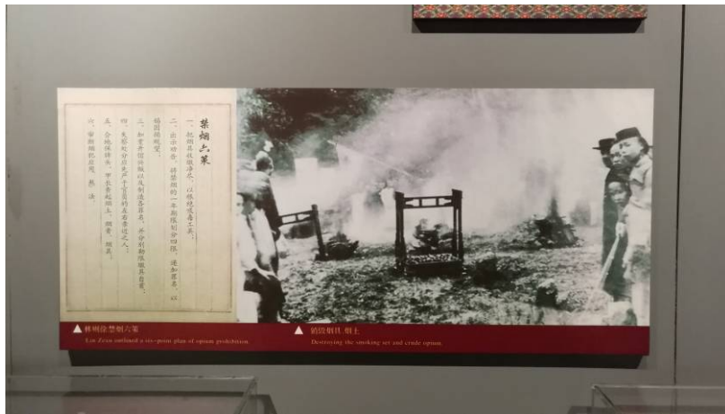
圖 6 鴉片戰爭面板史料