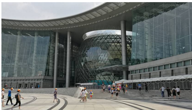
圖 10 上海科技館

他館所有合作的鳴蟲特展工作。該館現在執行特展工作的人員希望亦可提供相關資料供他們評估與參考。