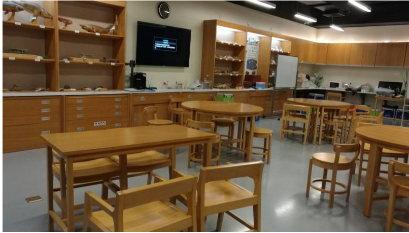
圖 18 實驗教室