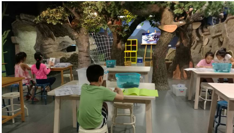
圖 17 觀察教室