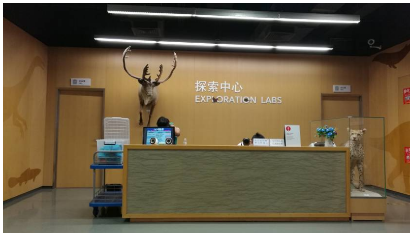
圖 15 探索中心