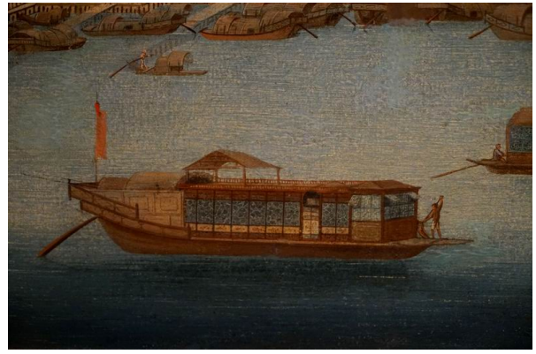
十三行 油畫 約 1784 年 右圖為局部 廣東省博物館藏 筆者攝。