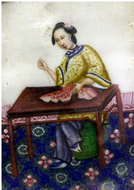
通草水彩畫，十九世紀，廣州美術館藏