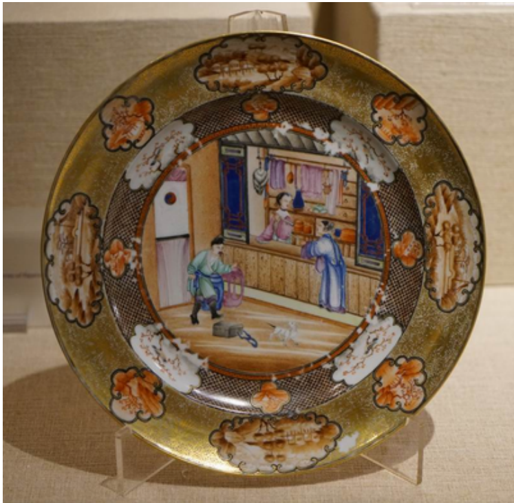
清 乾隆 廣彩錦地描金人物紋蝶