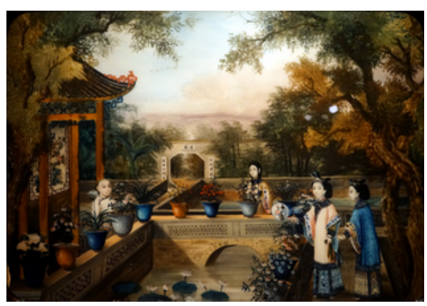
庭院人物玻璃畫，1852 年，廣東省博物館