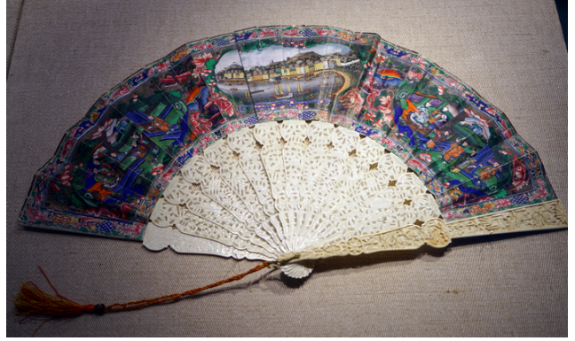
清末 象牙雕扇骨彩繪摺扇