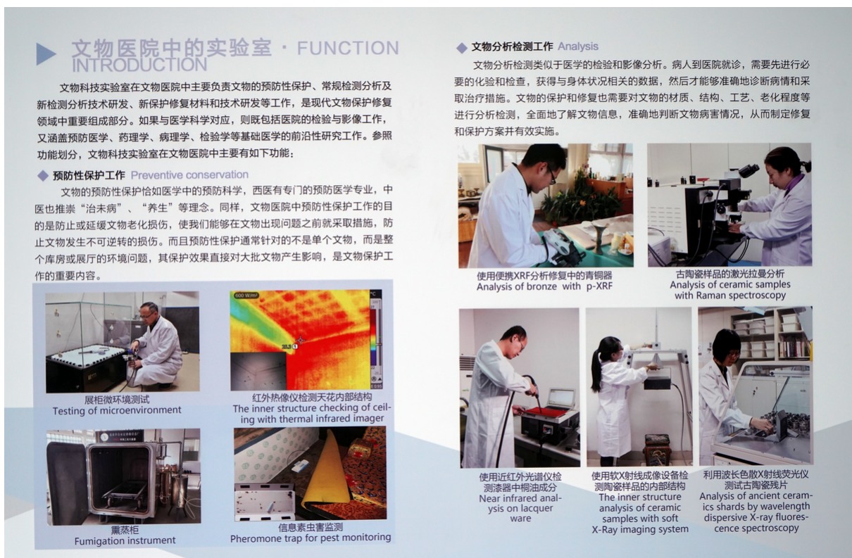
北京故宮博物院文物醫院中的展示海報：實驗室工作介紹（翻攝自文物醫院中的展示海報部份內容）

除了瞭解實驗室中的分析工作外，此次也透過數位與紙本資料，梳理北京故宮的宮廷繪畫中所使用的顏色與設色類型，提供未來進一步分析研究的基礎。在另外一方面，清代傳教士除了引進新的繪畫顏料和技法外，也引進玻璃與珐瑯色料。在西方，部份珐瑯色料或其原始材料也作為繪畫用之顏料，故此次也仔細研究該院所藏之部份珐瑯彩瓷（瓷胎畫珐瑯、瓷胎洋彩）展件。