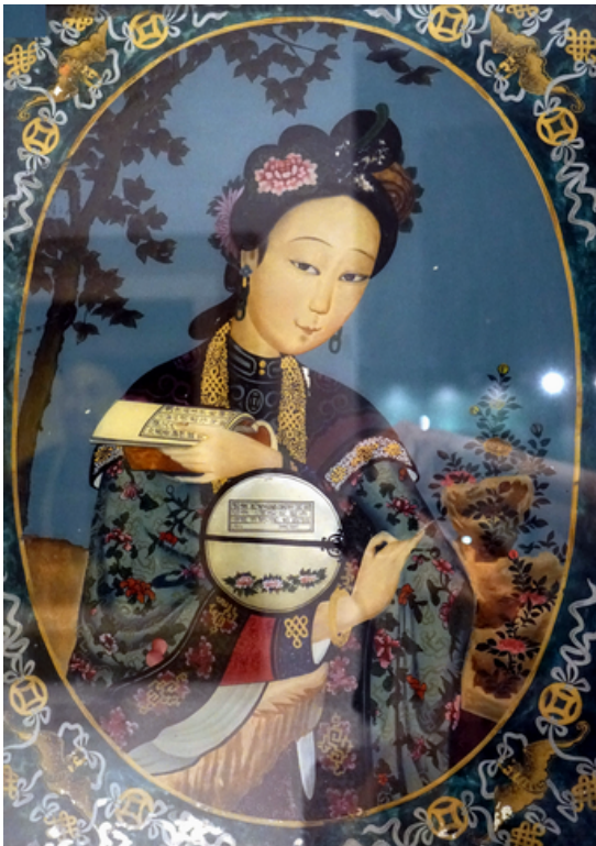
清代 仕女圖 玻璃畫