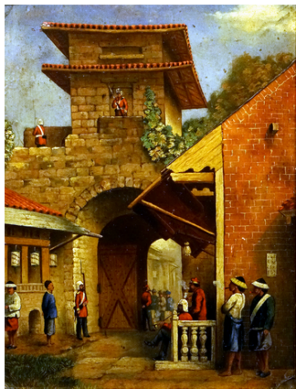
廣州東門，英國畫家，油畫，19 世紀，筆者攝