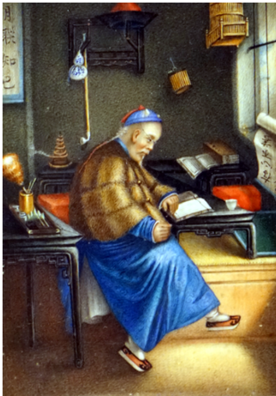
學者在書房，象牙水彩畫，19 世紀