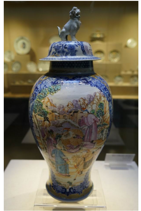
清乾隆 廣彩青花人物紋獅鈕方蓋瓶