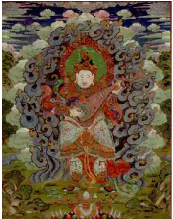
北京故宮博物院藏唐卡，左圖：清人畫乾隆的普寧寺佛裝像；右圖：清乾隆持國天王畫像