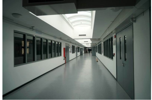
北京故宮博物院文保科技部文物醫院。左圖：文物醫院大門；右圖：文物醫院內部一景