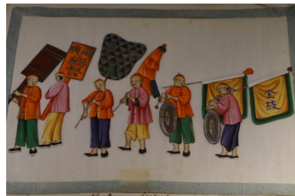
清 通草水彩畫 十三行博物館藏