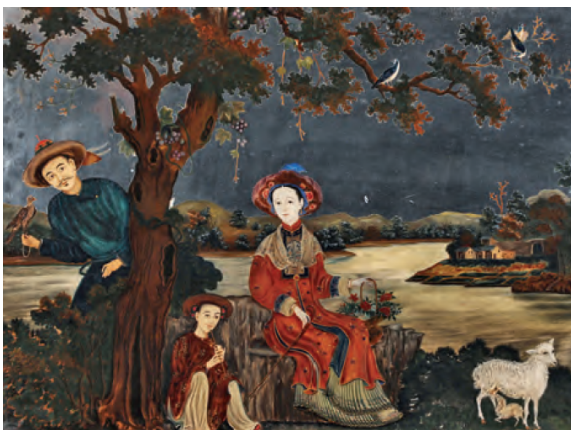
牧羊女圖 玻璃畫 廣東省博物館