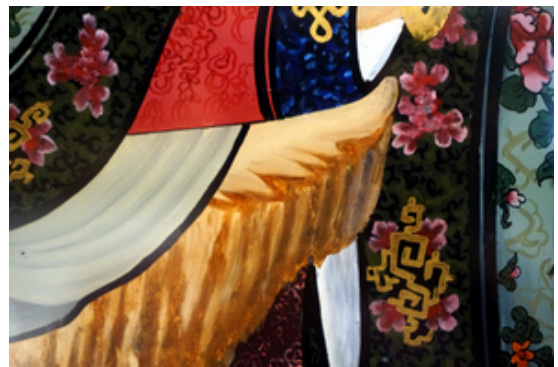
清代 仕女圖局部 玻璃畫，筆者攝