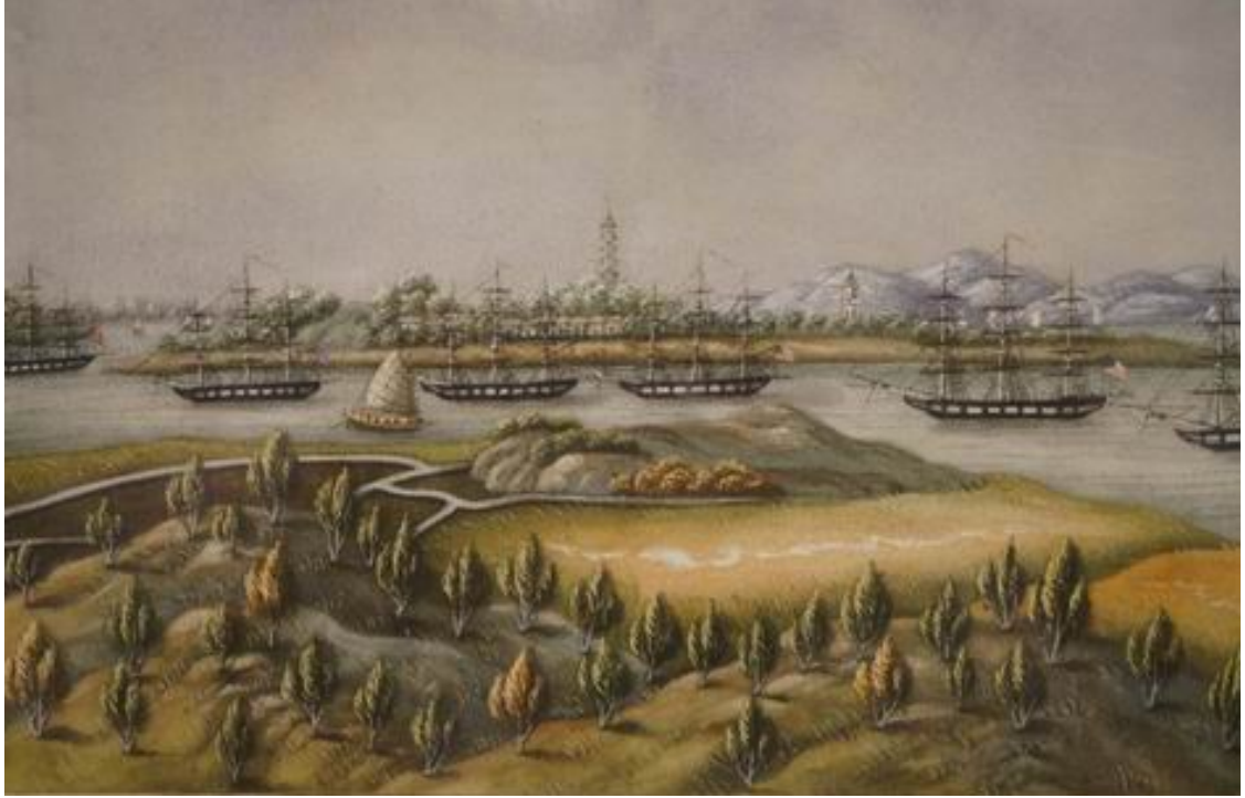
黃埔錨地 19世紀 通草水彩畫 廣州美術館 筆者攝