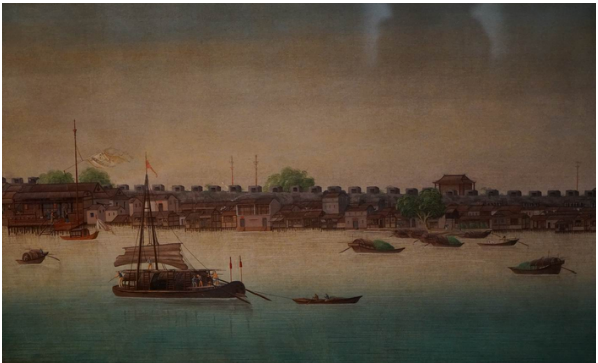
十三行附近風光 水粉畫 約 1790 年 廣東省博物館藏

廣東省博物館近年來向海內外徵集數千件外銷藝術作品，種類繁多，包括象牙器、竹器、漆器、扇、通草畫、油畫、玻璃畫、廣珐瑯、廣綉、金銀器、木雕…等，並在 2013 年推出了「異趣同輝—清代外銷藝術精品展」，展出 20 餘個品類共 210 件文物，並舉辦國際研討會。此行參觀了該館的各類展覽外，重點也著重於十八世紀後的外銷畫，包括油畫、水彩畫、水粉畫(不透明水彩畫)、玻璃畫及象牙畫。