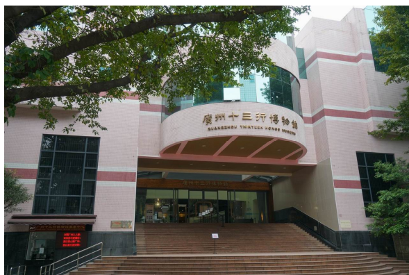
廣州十三行博物館

本次觀察研究主要以該館的水彩畫、油畫、玻璃畫、象牙扇畫及廣彩等有關顏料或色料的使用狀況為主。