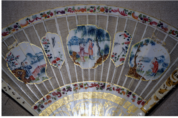
清乾隆 象牙雕扇骨彩繪人物文摺扇