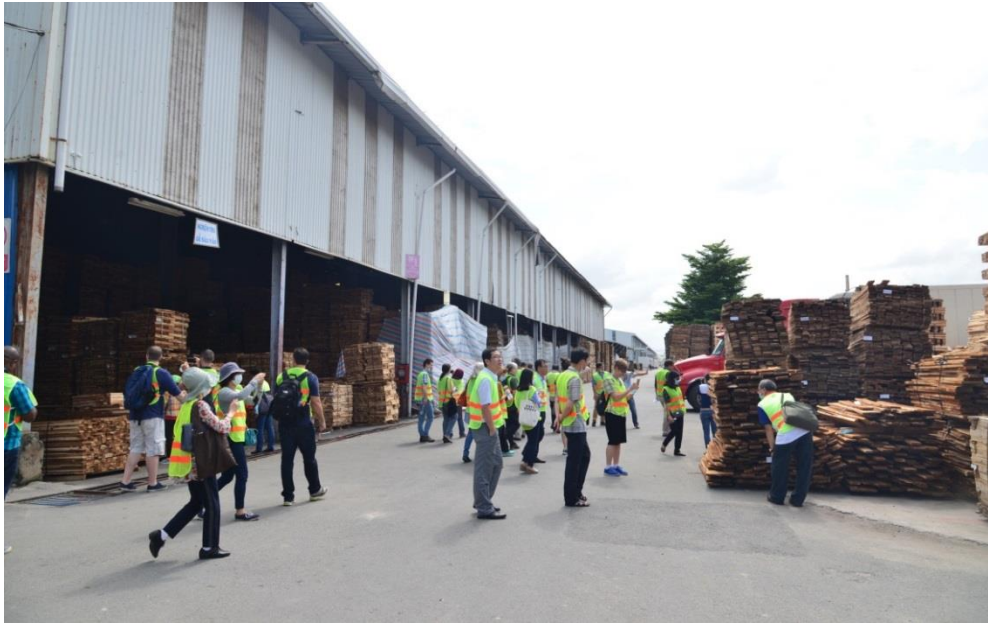
圖5 :EGILAT 參訪傢俱製廠 SCANSIA PACIFIC