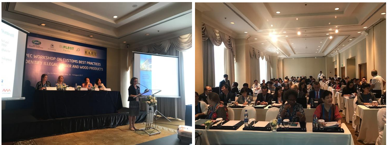
圖1: 海關識別非法木材和木製品的最佳做法工作坊照片

本工作坊旨在加強與會者識別合法和非法貿易木製品的能力，並採取適當行動。會議邀請包括來自國際組織的技術專家，以及來自APEC各經濟體的海關和執法部門代表進行專題報告，開幕致詞由美國貿易代表處官員Jennifer Prescott女士與越南林業行政局副局長Nguyen Van Ha演說，整個工作坊圍主題包含：一、針對非法木材的協議和方法論；二、海關專業人員木材識別的最佳作法；三、合法木製品認證計畫；四、監測木材合法性的文件和數據審查協議；五、木材追溯系統與部門別方法。各小節重點摘述如下，專題簡報可至網址( https://sites.google.com/view/apecillegaltimber2017/home )下載。