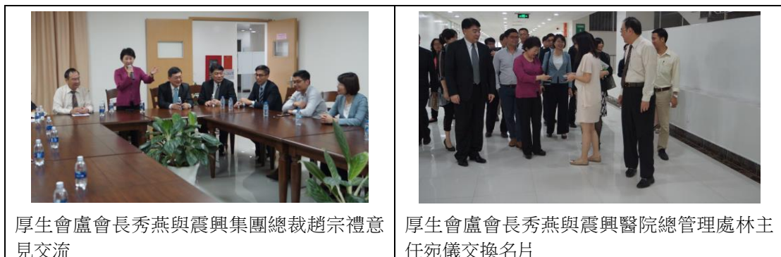
表 10 震興醫院參訪情形

該醫院軟硬體設施仍在建置中，尚未正式營運，為參考台灣醫療體系的發展經驗與高品質的醫療技術，同奈震興醫院已與彰化基督教醫院簽署合作計畫，目前由彰化基督教醫院派遣醫生協助相關醫療業務的建置作業，未來還要透過相互交流學習來加速提升該醫院醫生與護士的專業技能。