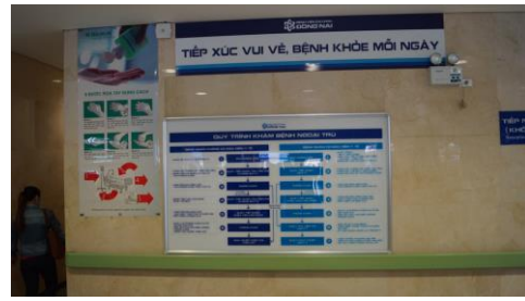
Dong Nai General Hospital 樓層介紹