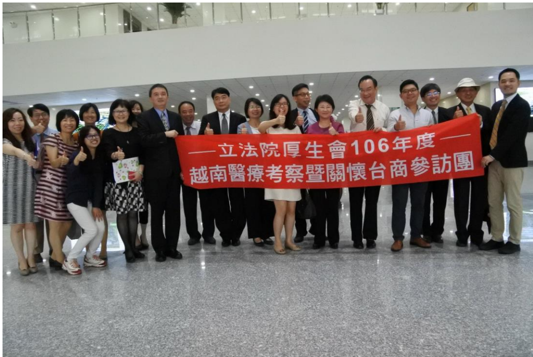
震興醫院員工與參訪團全體成員合影