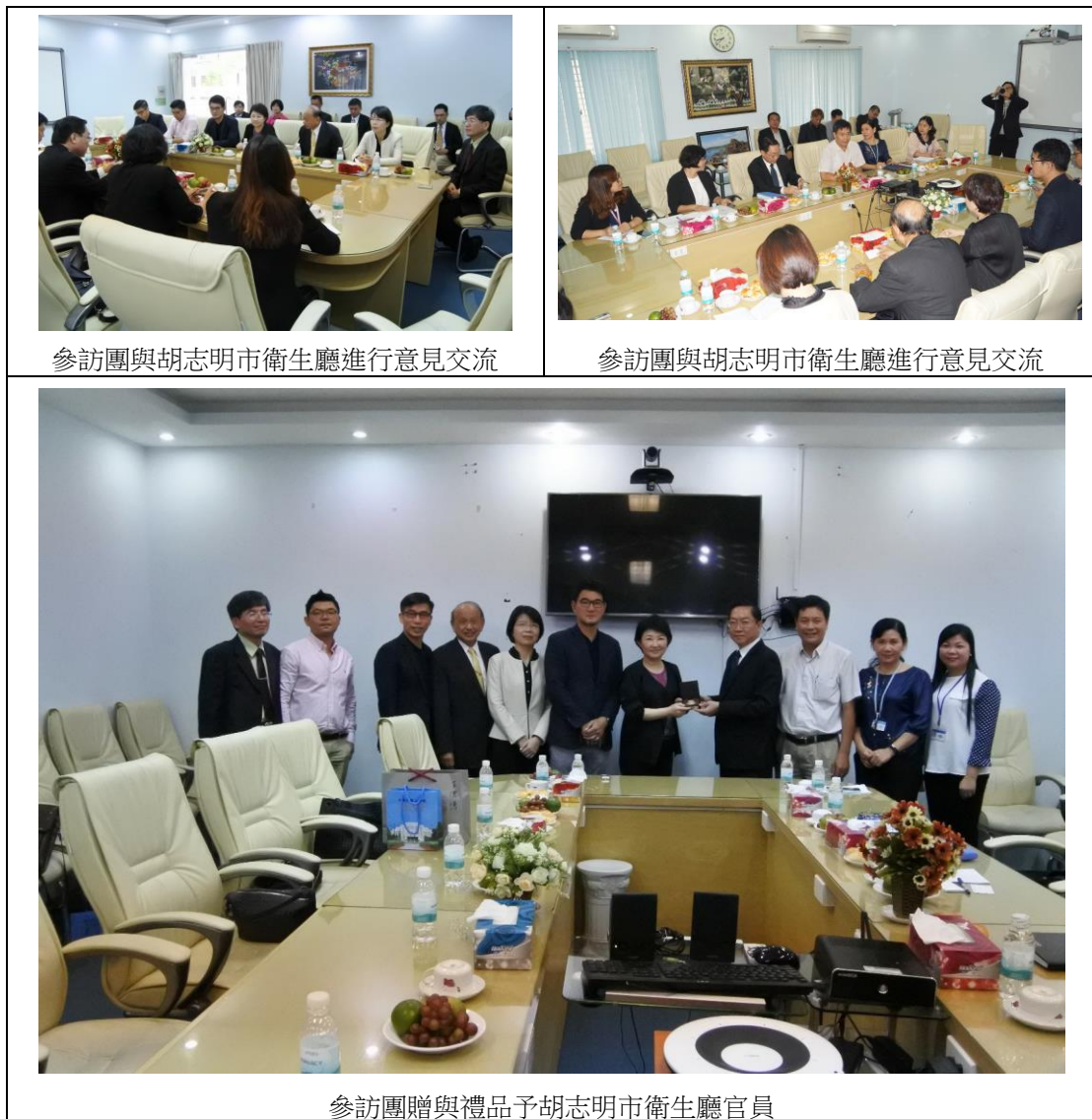
參訪團與胡志明市衛生廳進行意見交流