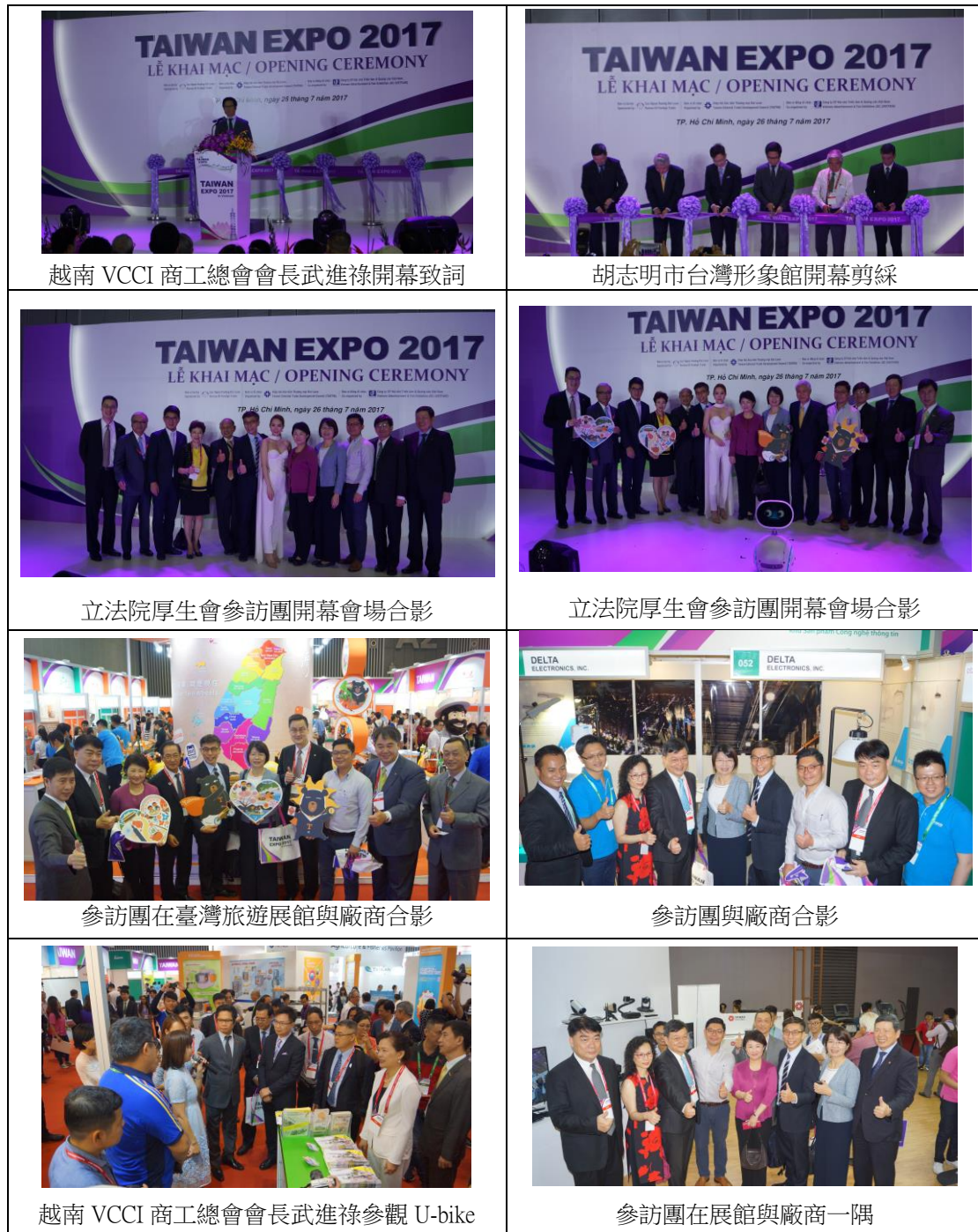
表 7 胡志明市台灣形象館開幕參訪情形

此外，配合政府新南向政策所辦理的「越南臺灣週」系列活動，外貿協會於 7 月 25 日在越南同奈省辦理「臺灣智慧醫療系統捐贈典禮」，在外貿協會的協助下，獲第 25 屆臺灣精品獎廠商－精聯電子捐贈 5 套「遠距健康照護系統 LIGCare HG700」智慧病房予越南臺資的震興醫院，將臺灣醫療服務與科技結合的健康照護軟實力進駐醫院提供服務，以大幅提升該院對病患的照護品質。