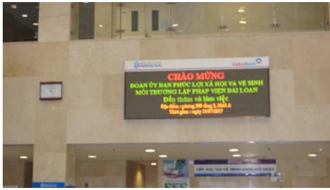
Dong Nai General Hospital 跑馬燈歡迎立法院厚生會參訪團