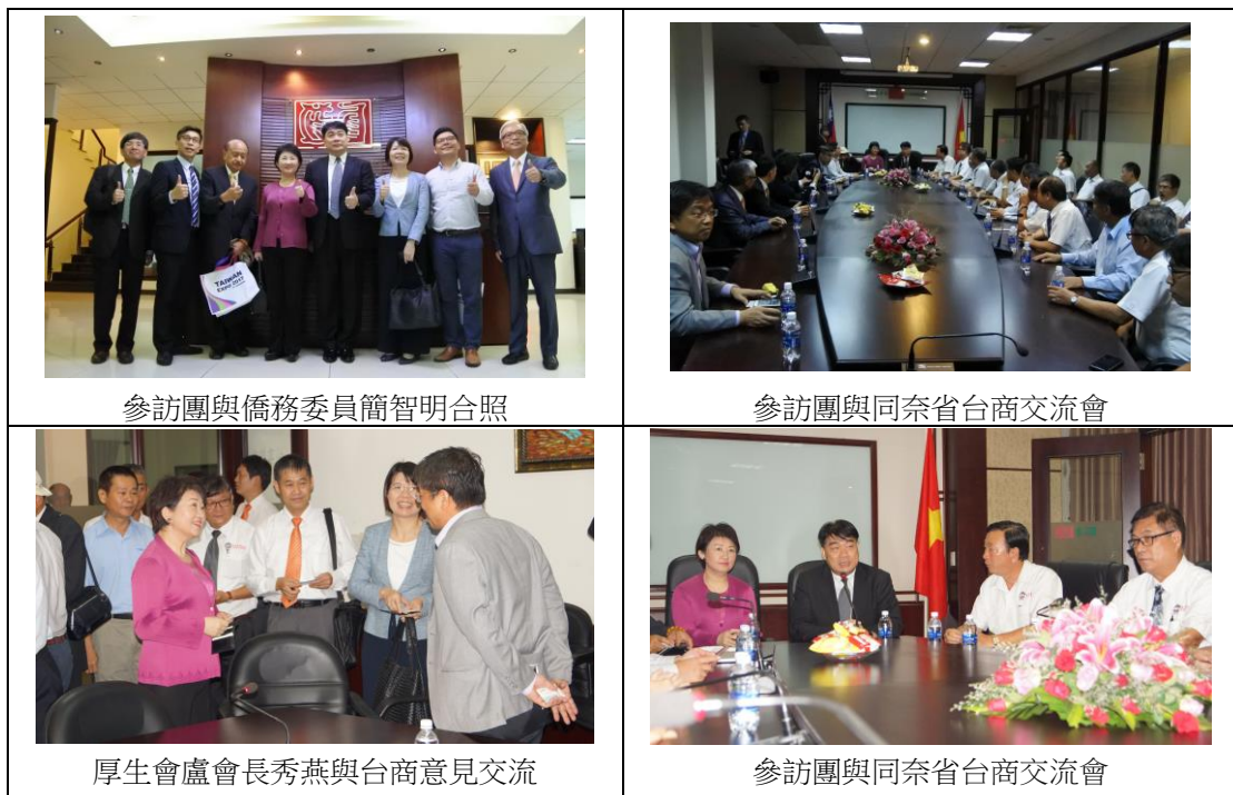
表 9 同奈省台商交流會