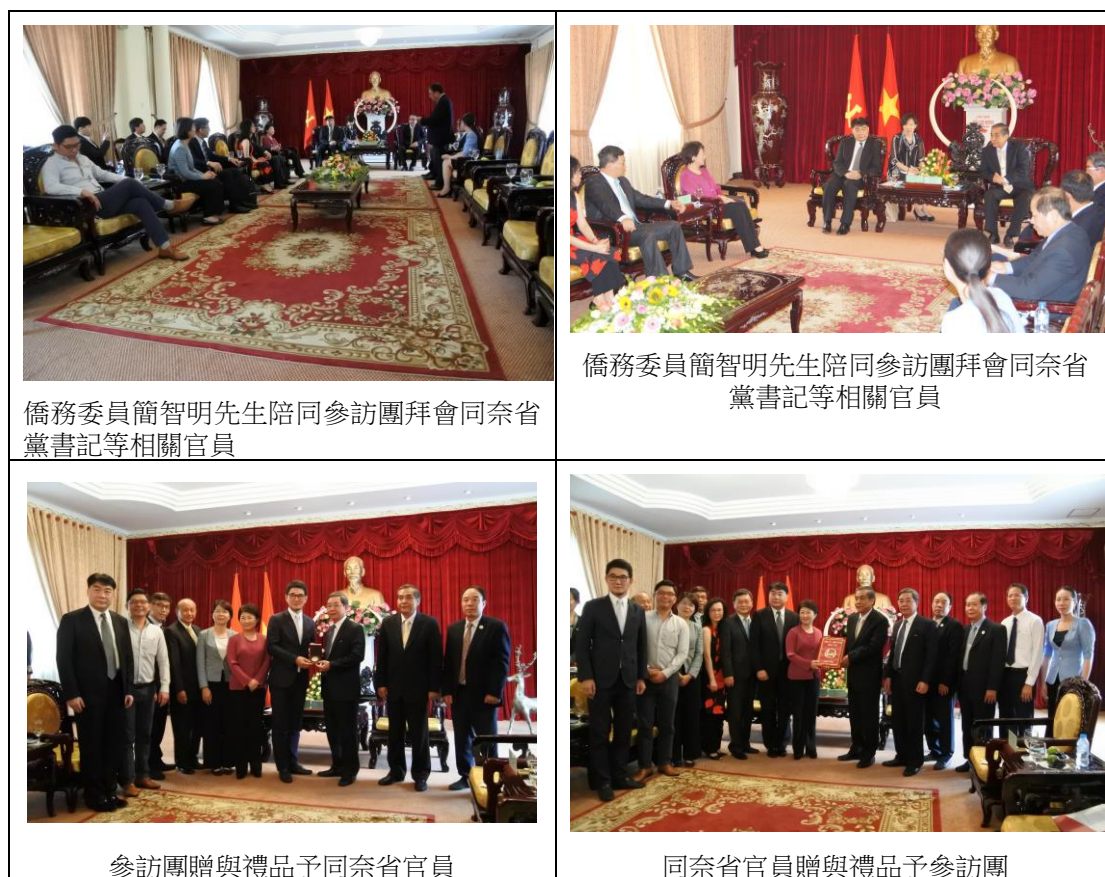
表 11 同奈省府拜會情形