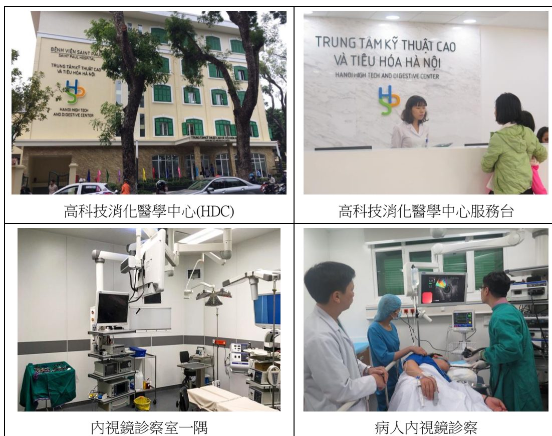
圖 1 Hanoi High tech and Digestive Center 提供之服務

該中心係 2016 年 11 月 28 日落成營運，設有 12 間諮詢室，10 間病房，45 張病床，及 4 間內視鏡診察室和 3 間手術室。