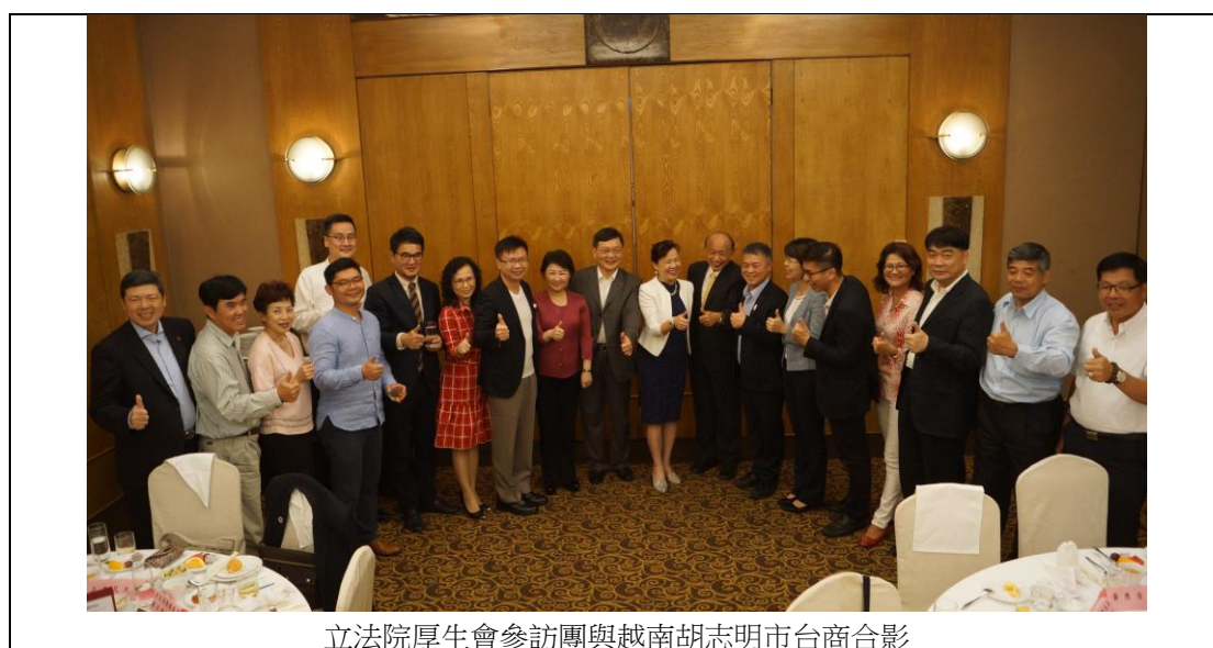
表 8 胡志明市台商交流會