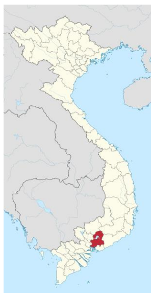
圖 3 越南同奈省地理位置

參訪團由越南台灣商會聯合總會同奈分會會長僑務委員簡智明先生及我國駐胡志明市台北經濟文化辦事處梁光中處長安排拜會同奈省相關官員，同奈省官員表示，台商在當地的投資以前是排名第 1，近年來有被其他國家迎頭趕上的情形，目前是排名第 4，但該政府相當重視台商經營過程所面臨的問題，會努力協助台商解決問題，希望台商能夠持續在同奈省進行投資。