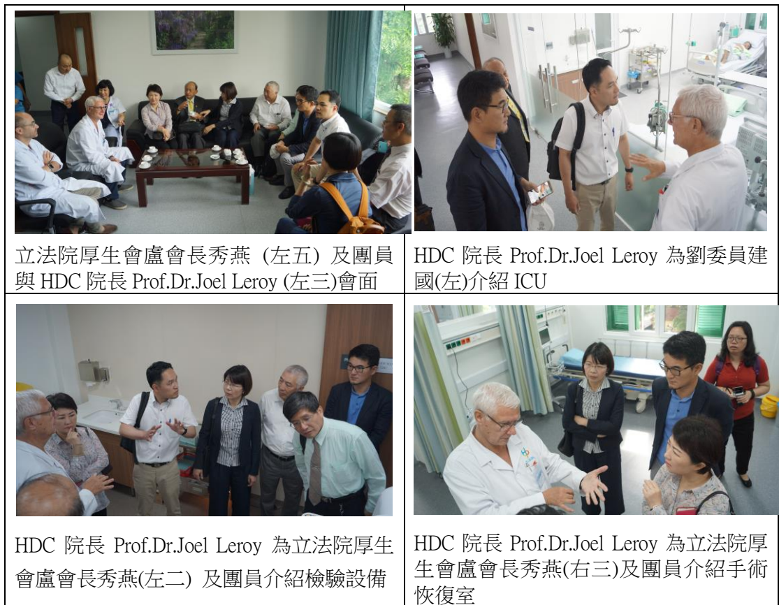
表 4 Hanoi High tech and Digestive Center 參訪情形

河內高科技消化系統中心的使命是為河內提供國際標準的醫療服務與教學，並與全世界的消化系統領域醫師和醫學專家進行學術交流與合作。