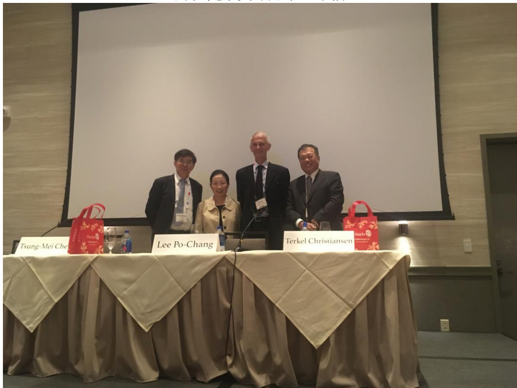
李署長與本次會議參與人合影