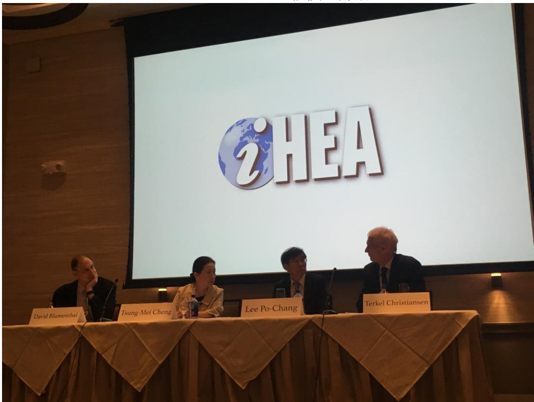
李署長與評論人與談現況