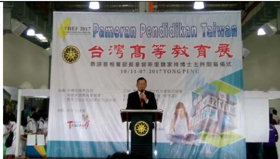
07/10 參加永平教育展開幕典禮，駐馬來西亞台北經濟文化辦事處章計平代表致詞