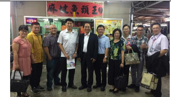
07/10 宴請柔佛及麻六甲地區獨中校長及校友，向與會嘉賓介紹本校各項入學管道。