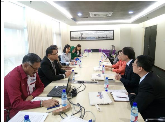
07/12 參訪砂拉越大學 (UNIMAS)