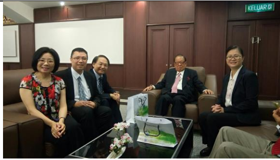
07/09 拜會本校名譽博士楊忠禮博士