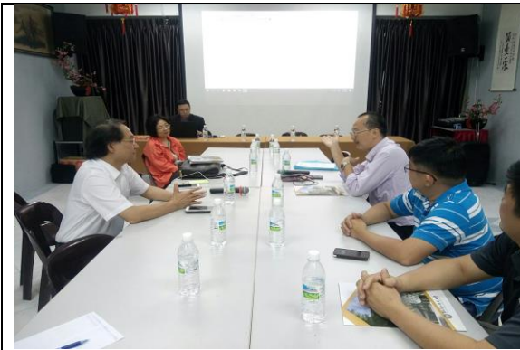
07/11 拜會古晉留台同學會