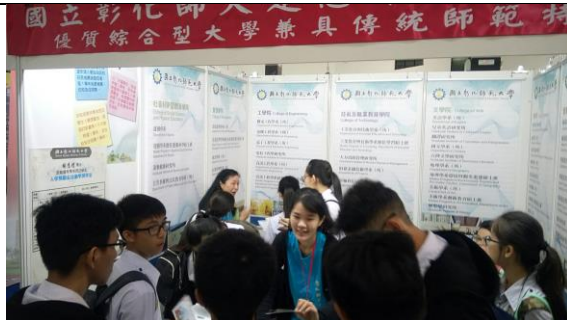
07/08 同仁於本校教育展攤位為來訪學生解說