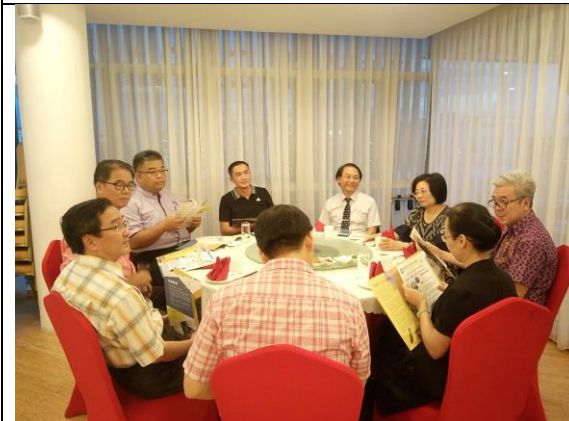
07/12 宴請彰師大校友及古晉獨中校長