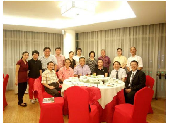
07/12 古晉五所獨中校長聯袂出席本校餐會