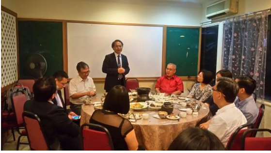
07/05 與本校校友會及森雪隆獨中代表餐敘