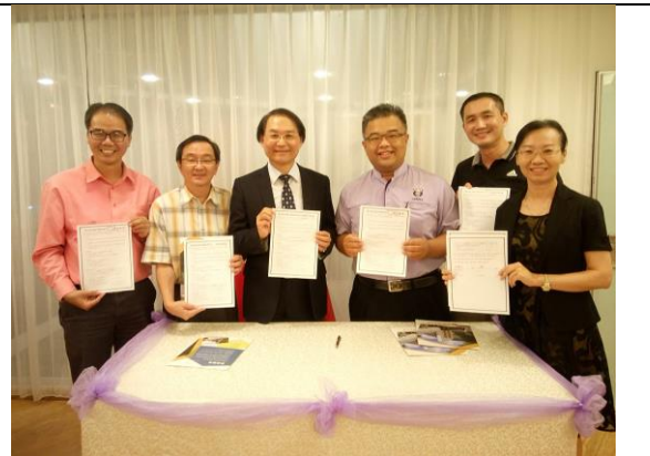
07/12 五所獨中校長皆於餐會中簽定招生合作意向書