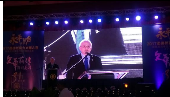
07/09 參加柔聯文華之夜，馬來西亞首相署部長魏家祥博士會中發表精彩演說