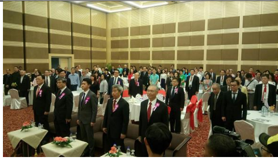
07/07 參加教育展開幕禮