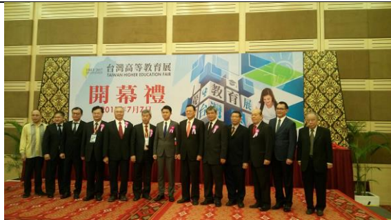
07/07 參加教育展開幕禮