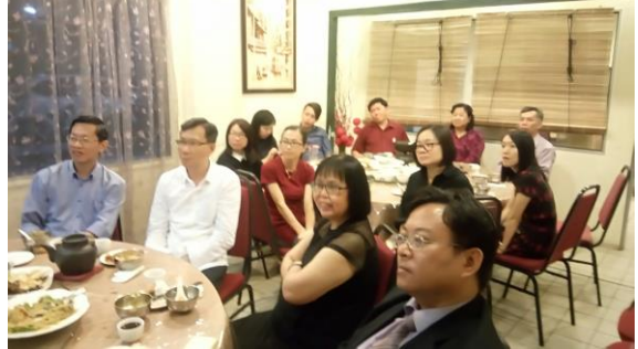
07/05 與本校校友會及森雪隆獨中代表餐敘