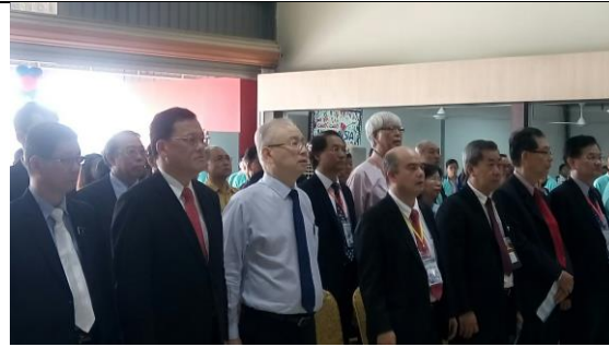
07/10 參加永平教育展開幕典禮