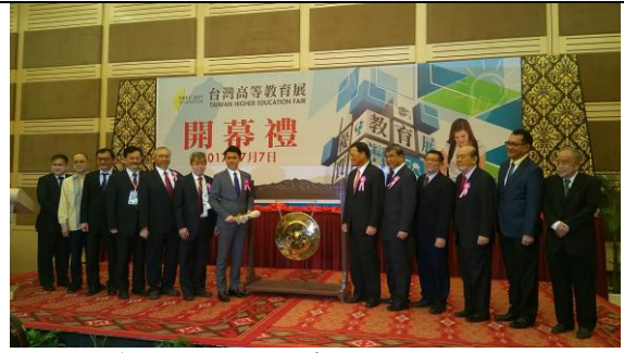
07/07 參加教育展開幕禮