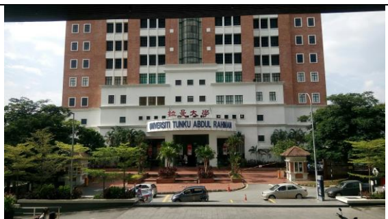
07/08 參訪拉曼大學雙溪龍校區(UTAR Sungai Long Campus)