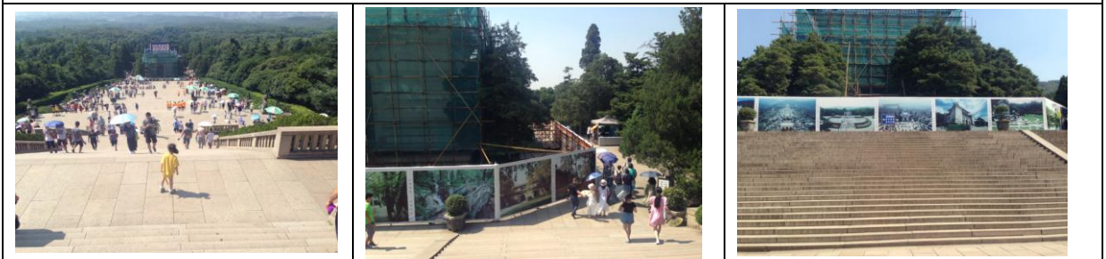
中山陵入口處城樓修繕，用名勝照片圍起來