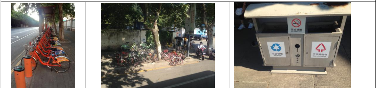
積極發展共享腳踏車，但須妥善管理