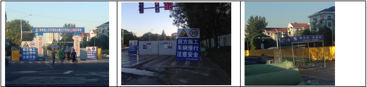
工地入口警示明顯，工程告示顯著，裡面還有休息亭供應茶水