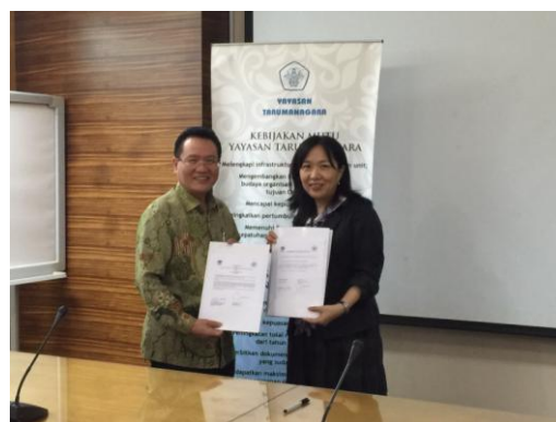
圖 4：簽署 MOU