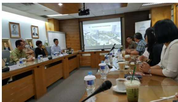
圖 3：討論雙方合作事宜