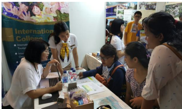
圖 3：詳細解說入學資訊(一)