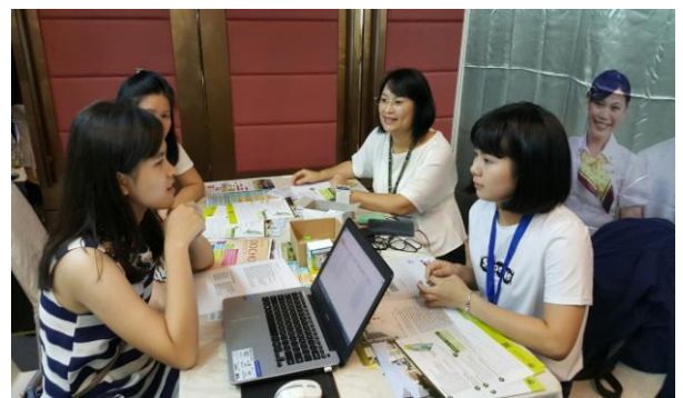
圖 4：詳細解說入學資訊(二)