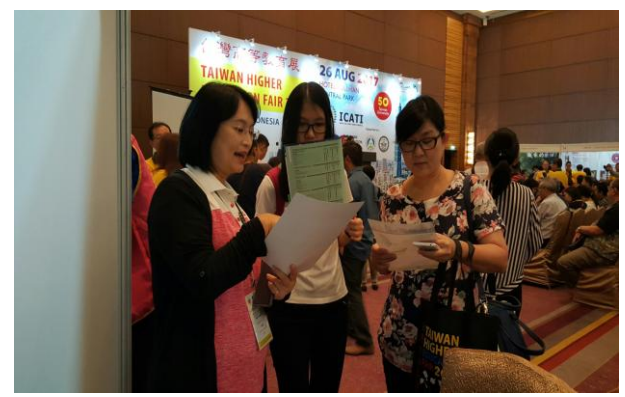
圖 6：詳細解說入學資訊