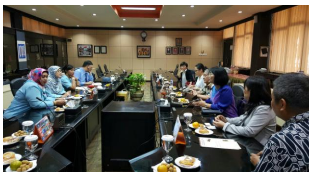
圖 3：討論雙方合作事宜