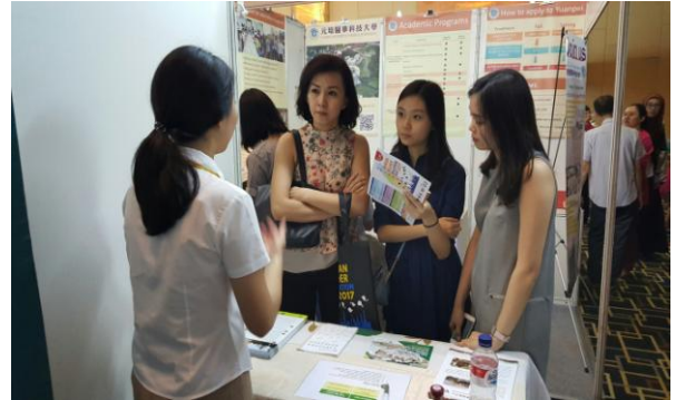
圖 2：學生家長詢問升學資訊