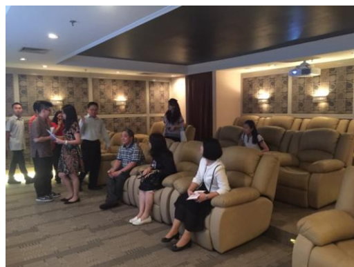
圖 2：校園影片解說欣賞