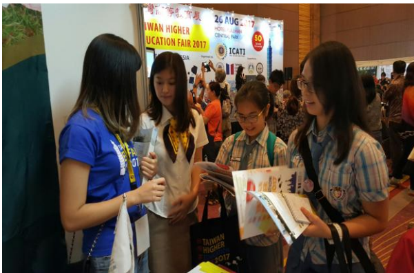
圖 5：學生家長詢問升學資訊(二)