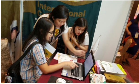
圖 3：學生留下聯繫資訊