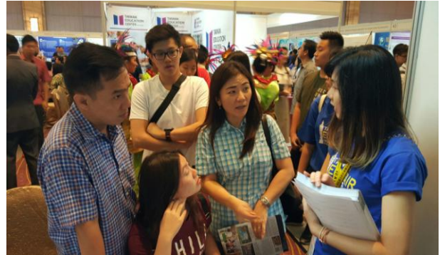
圖 4：學生家長詢問升學資訊(一)