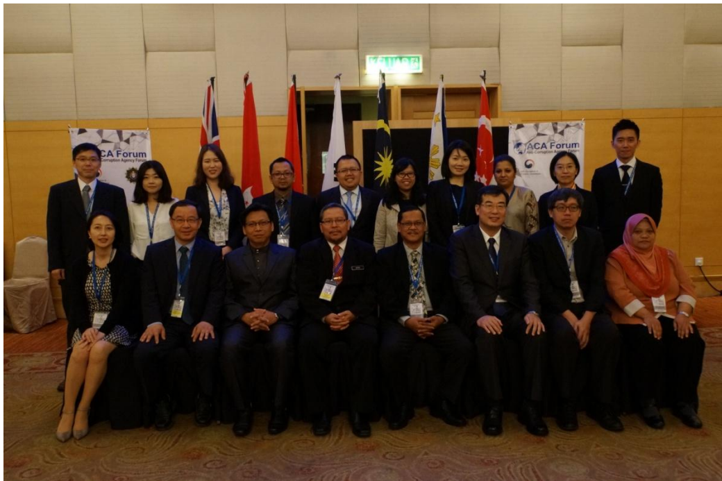
全體與會人員會後合照