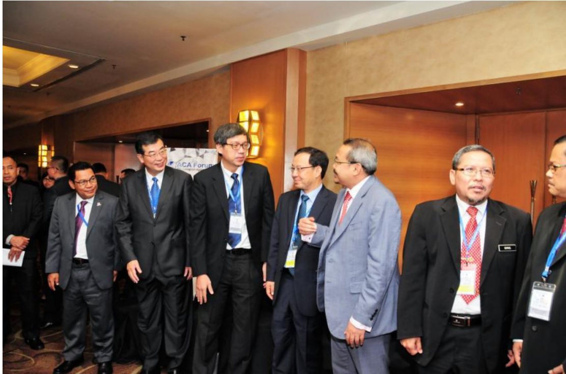
各國反貪機構代表互相問候寒暄