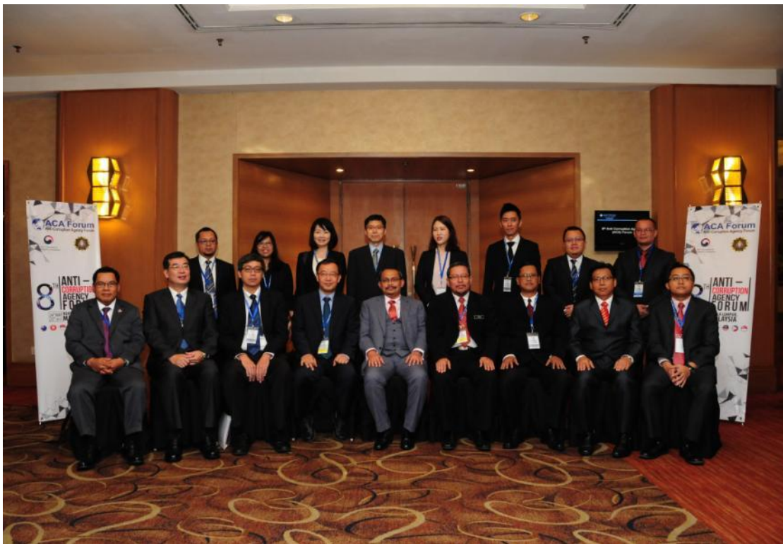
與會人員與馬來西亞反貪委員會委員長 Datuk Dzul kifli Ahmad 合照