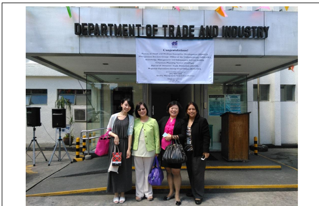
菲律賓貿易工業部