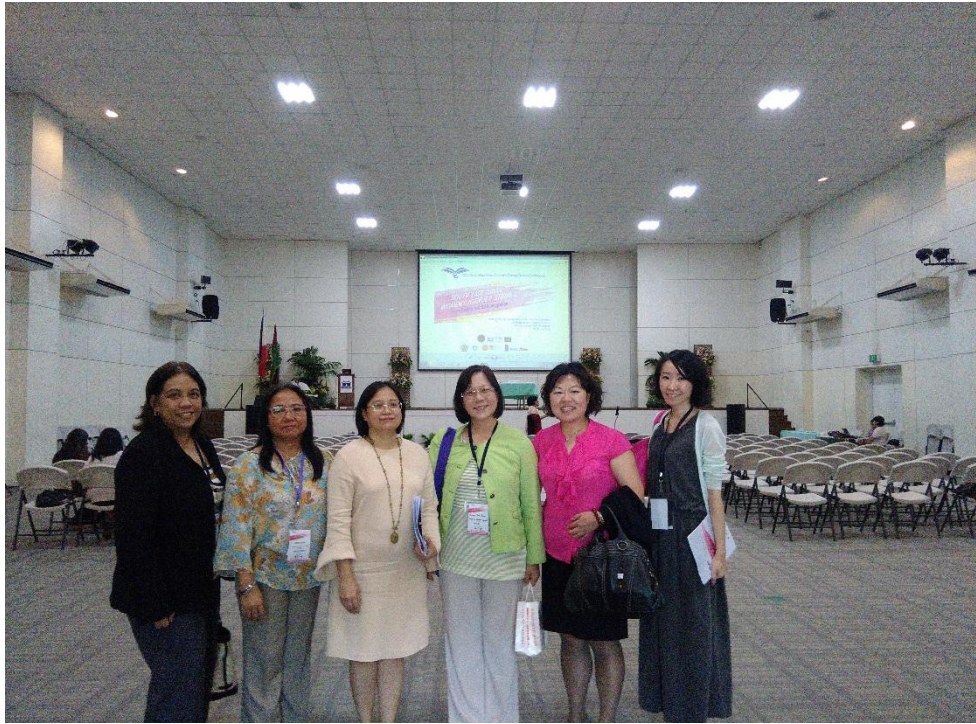
菲律賓大學婦女研究中心