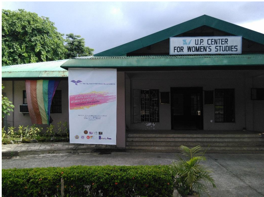
菲律賓大學婦女研究中心