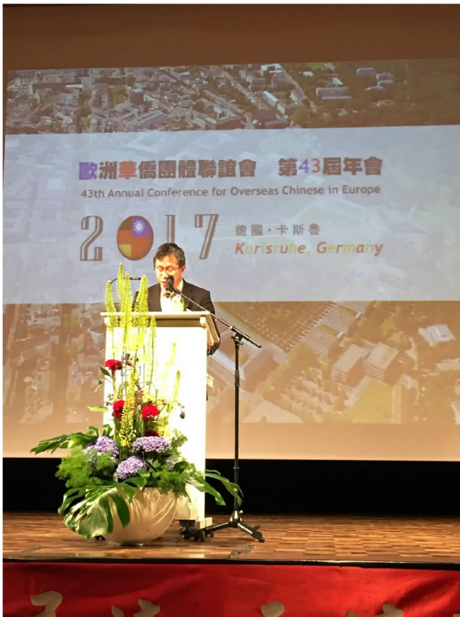
第 43 屆歐華年會駐德國代表處謝志偉大使致詞