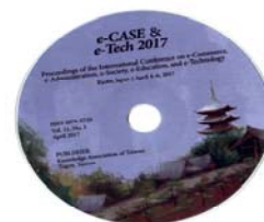
研討會論文集光碟