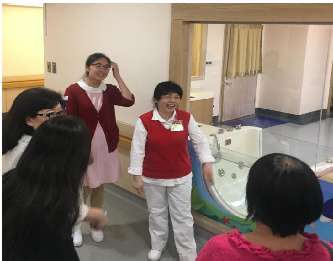
圖 6 廈門長庚醫院坐月子中心設施考察