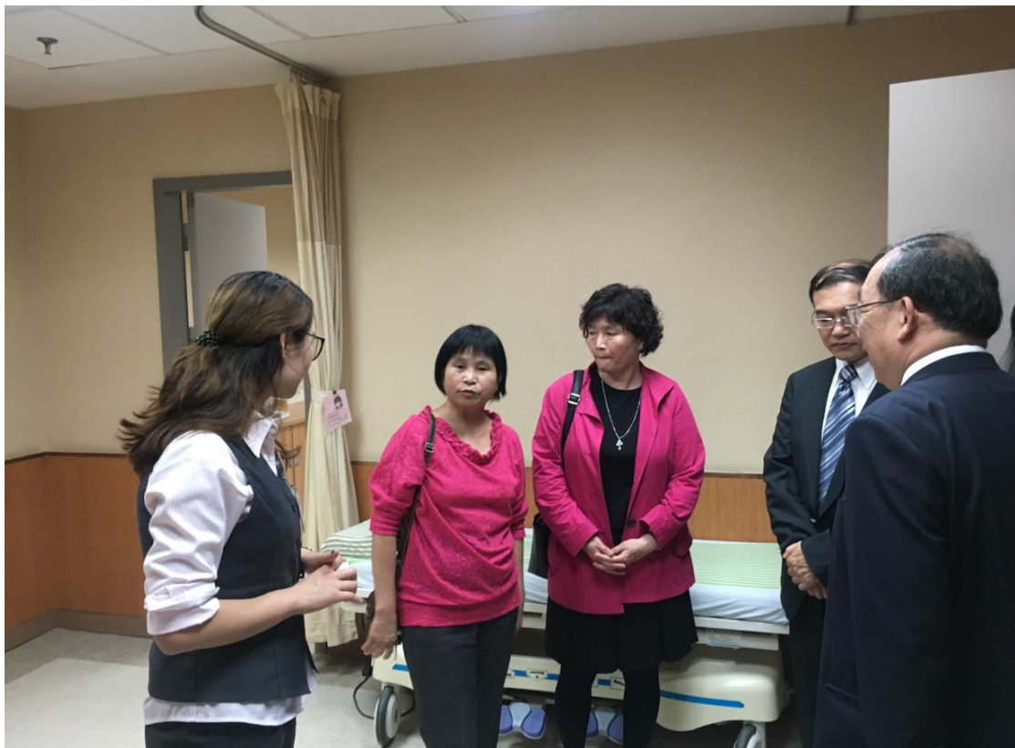
圖 4 廈門長庚醫院病床設施考察