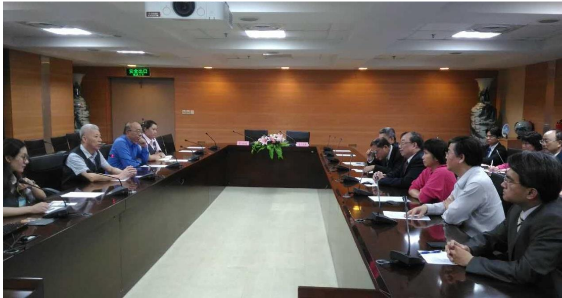
圖 1 與廈門市長庚醫院交流座談(雙方會談狀況)