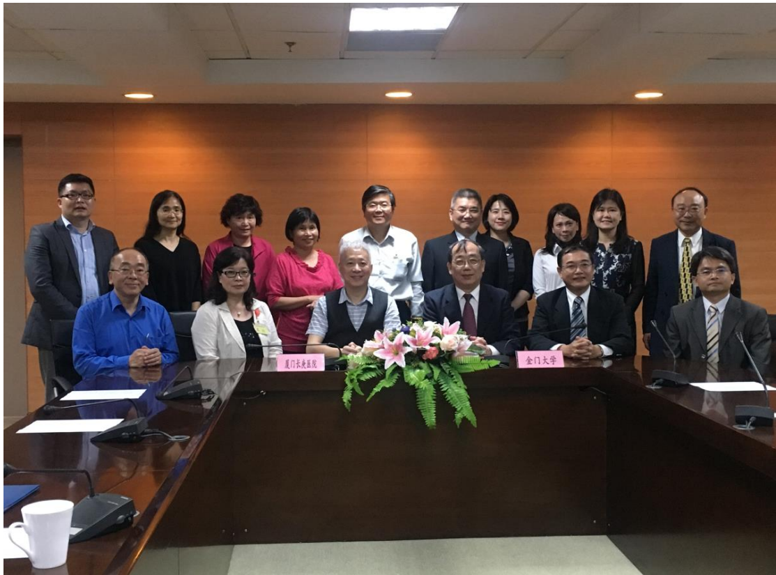
圖 3 會後簽約雙方大合照