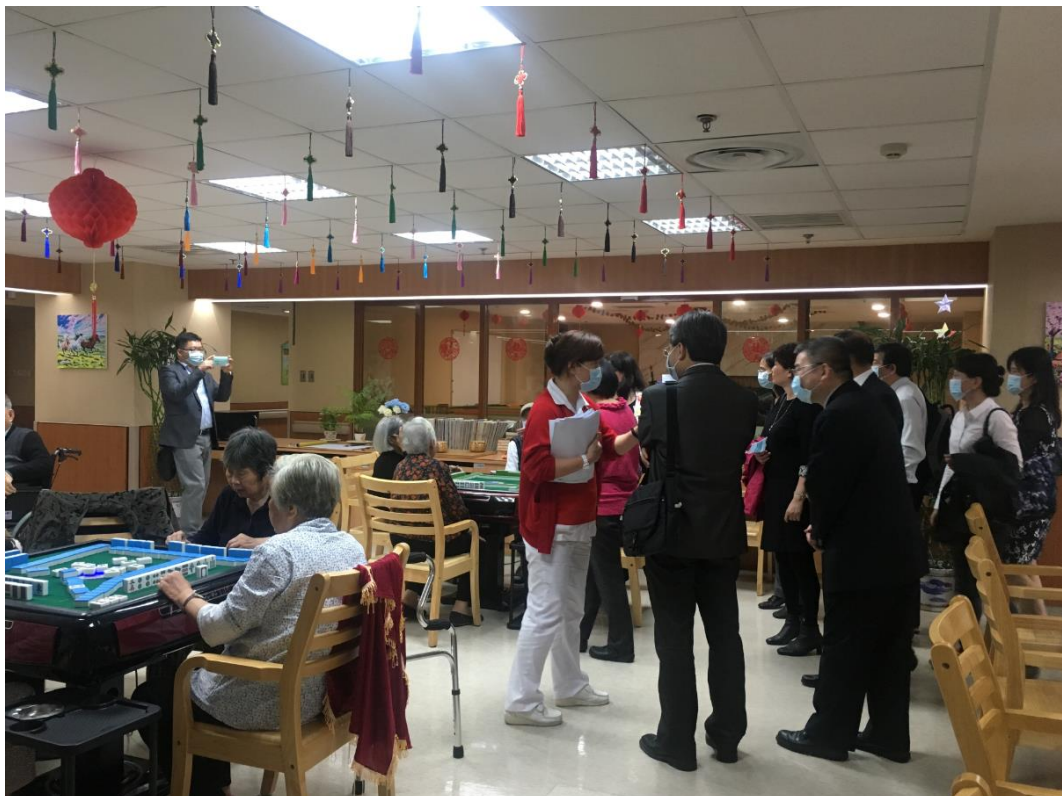
圖 5 廈門長庚醫院護理院設施考察